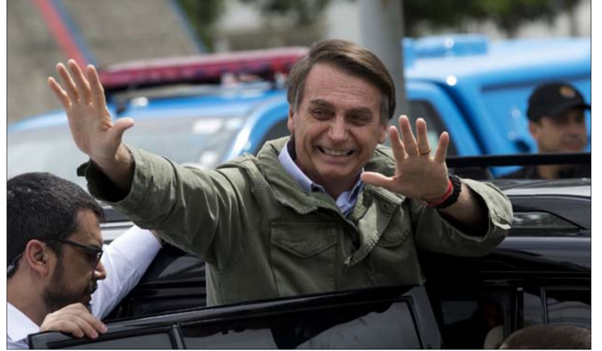
بولسونارو.. حشرة المد الإنجيلي في أمريكا اللاتينية