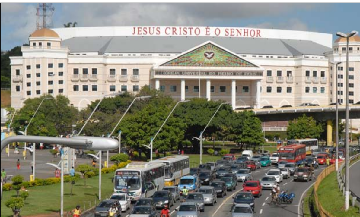
فجر البرازيل للكنيسة العالمية لمملكة الرب