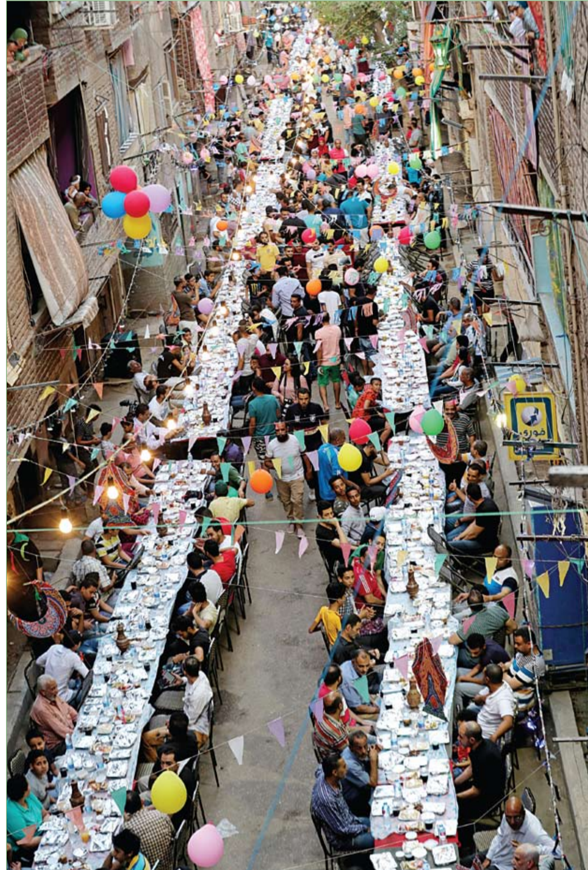
سكان عزية حمادة في حي المطرية بالقاهرة يتجمعون لتناول وجبة الإفطار معا خلال شهر رمضان المبارك.

قال الممثل الأمريكي الشهير، أرنولد شوارزينغر، إنه لن يقاضي الشخص الذي باغته بهجوم أمام الكاميرات في جنوب أفريقيا قبل أيام. وكان شوارزينغر "71 عاما" يشارك في التحكيم على مسابقة للمصارعة باسم أرنولد كلاسيك أفريكا للهواة في مدينة جوهانسبرغ بجنوب أفريقيا، عندما شوهد أحد الأشخاص وهو يقفز في الهواء ويركل شوارزينغر بقدميه من الخلف. ووردت الكاميرات سقوط النجم الأميركي، وحاكم ولاية كاليفورنيا السابق، أرضا من شدة الركلة. وعلى الفور، أمسك حراس أرنولد بالمهاجم الذي لم يتم الكشف عن هويته، أو الدافع من وراء فعلته. وفي تغريدة عبر تويتر، مساء الأحد، قال شوارزينغر إن الكثير من محبيه طالبوه بمقاضا المعتدي، لكنه أكد أنه لن يفعل ذلك.