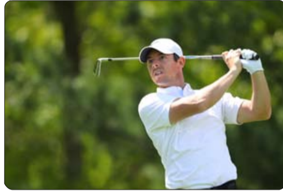
34 في المركز 14 مشترك وانضم الدنماركي لوكاس بيريجارد إلى

في الموسم الحالي. لا يزال لوري في المركز الثالث برصيد 1533.3 نقطة في حين قفز فان روين من المركز 20 إلى المركز 17 إلى 881.3 نقطة. أنهى لاعب التايواني جاز جانتانانوند، الذي لعب في بطولة الولايات المتحدة الأمريكية لأول مرة، ليشترك المركز 14 الذي جعله يتقدم في الترتيب من المركز إلى المركز 49 برصيد 456.6 نقطة. كما قفز الفرنسي مايك لورينزو