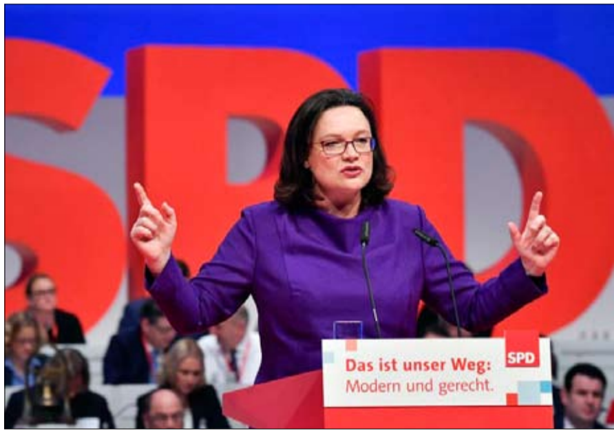
الحزب الاشتراكي الديمقراطي الألماني في مازق

ويسلم الكاتب بأن إيران تمارس نفوذاً مهماً في العراق، على أساس أنها الشريك التجاري الثالث لبغداد مع تبادل سنوي يصل إلى 12 مليار دولار سنوياً. وفي الانتخابات التشريعية عام 2018، فاز المواليون لإيران ضمن تحالف "الفتح" بـ48 مقعداً. أي ما نسبته 14.6% من مقاعد البرلمان العراقي، وتصبح ثاني أكبر كتلة نيابية. وتسلخ إيران الميليشيات الشيعية، التي تقطن حصصاً من