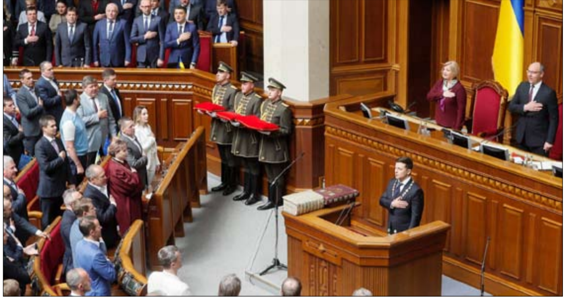
زيلينسكي يحل البرلمان بعد تنصيبه