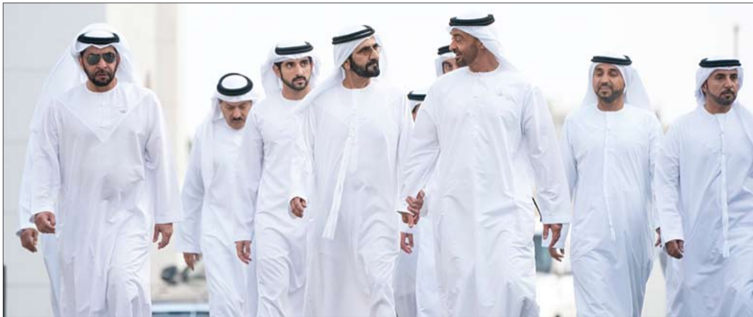
محمد بن راشد خلال لقائه محمد بن زايد في قصر البطين بأبوظبي

يومية - سياسية - مستقلة www.alfajrnews.ae