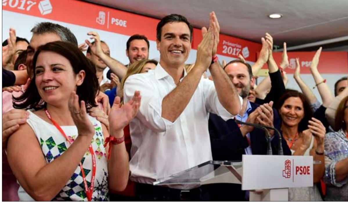
بيدرو سانثيز امل اليسار الاوروي

ومع أن الميليشيات المدعومة من إيران تمثل تهديداً مثل داعش، إن لم يكن أكثر، فإن الردود على الجانبين لم تكن متشابهة. إذ قادت واشنطن ونظمت تحالفاً عسكرياً لهزيمة التنظيم، بينما تبقى مواجهة إيران "هدفاً غير عسكري" وفقاً للبيتاغون.