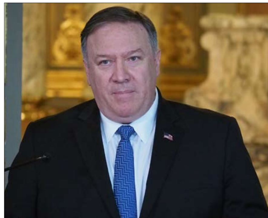
وزير الخارجية الأمريكي.. انجيلي ايضا..