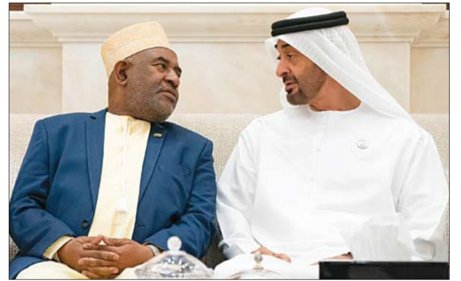
محمد بن زايد خلال استقباله رئيس جزر القمر

أبوظبي-وام: التقى صاحب السمو الشيخ محمد بن راشد آل مكتوم نائب رئيس الدولة رئيس مجلس الوزراء حاكم دبي «رعاه الله»، أخاه صاحب السمو الشيخ محمد بن زايد آل نهيان ولي عهد أبوظبي نائب القائد الأعلى للقوات المسلحة مساء أمس في قصر البطين بأبوظبي. وتبادل سموهما مع جموع المهنيين التهانى