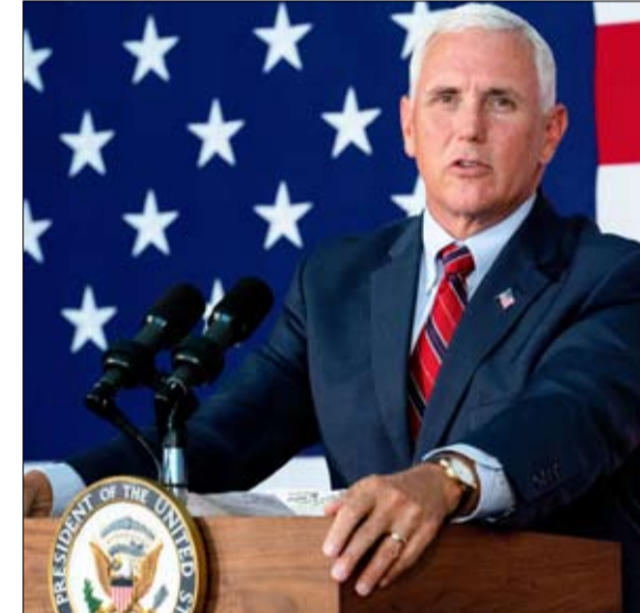
نائب الرئيس ابرز الانجيليين في البيت الابيض

كان في القارة الأمريكية اللاتينية، كان لا بد من أربعين سنة حتى يصل هذا الجيل الثالث من الينتكوستاليين والإنجيليين، الى مرحلة التأثير بشكل كبير على السياسة. وجدت هذه الحركة شديدة التنوع، في مثل أمريكا اللاتينية، غواتيمالا ، قبل أربع سنوات في المحفظة السياسية للجماعة الإنجيلية. وضد كل التوقعات ، عام 2015 ،