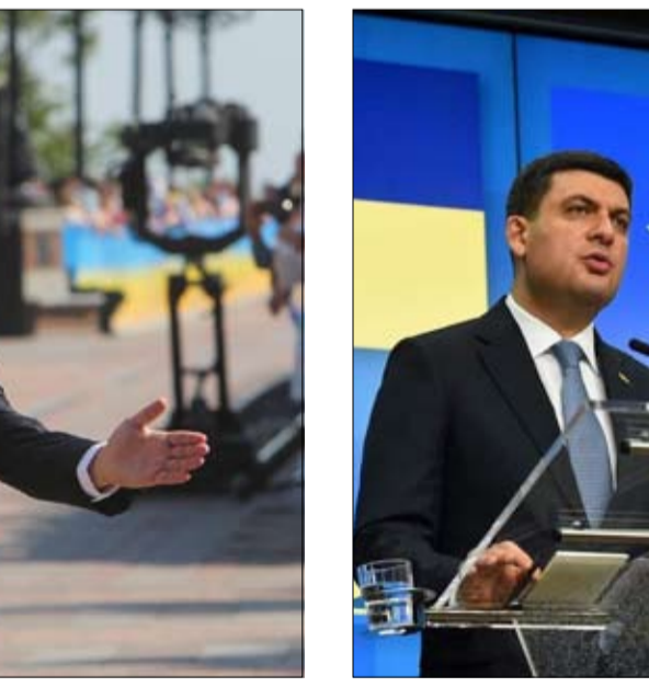
رئيس الحكومة يقدم استقالته

حتى يكسب رهان التشريعية، على زيلينسكي العثور على مرشحين أكفاء ستكون أولويته، هي التوصل إلى وقف لإطلاق النار في شرق البلاد، حيث تستمر الاشتباكات مع الانفصاليين الموالين لروسيا والتي أودت بحياة 13 شخص منذ عام 2014. وأعلن، تحت تصفيق النواب، انه لن يتم استئناف الحوار مع روسيا. إلا بعد عودة الأراضي الأوكرانية، بما في ذلك شبه جزيرة القرم، وهو أمر مستبعد للغاية. وتعهد فولوديمير زيلينسكي، بالحفاظ على المسار المؤيد للغرب