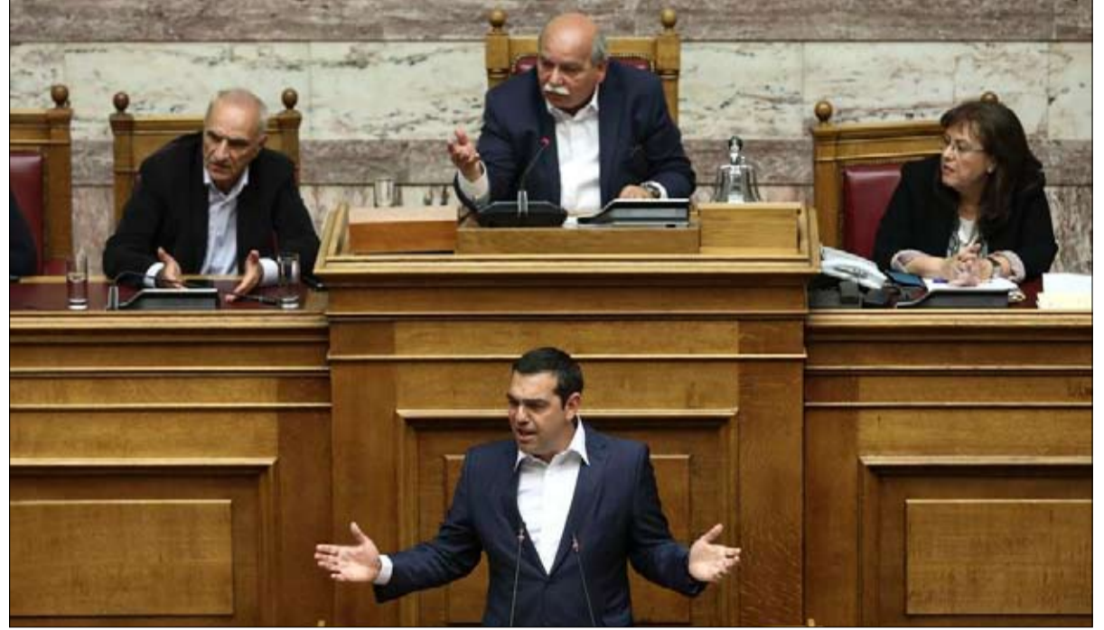
اليونان سيريزا حاضر والاشتراكي اختفى