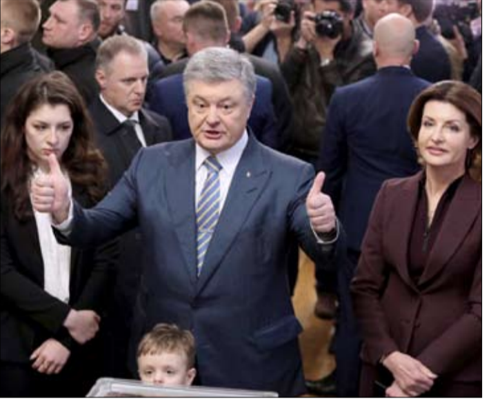
بيتروشينكو حرم من الأغلبية في البرلمان