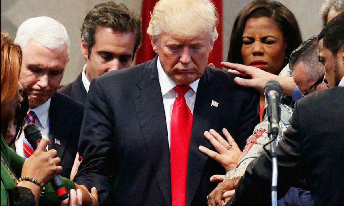
ترامب.. انتهازية وليست ايماننا

الرب كربيان عظيم للسياسة، يحلم به الإنجيليون (وخصوصا أكثر المحافظين منهم)، وهم على وشك تحقيق ذلك في بعض الأماكن. على سبيل المثال، في الولايات المتحدة، حيث تحصلوا على انتصار كبير مع