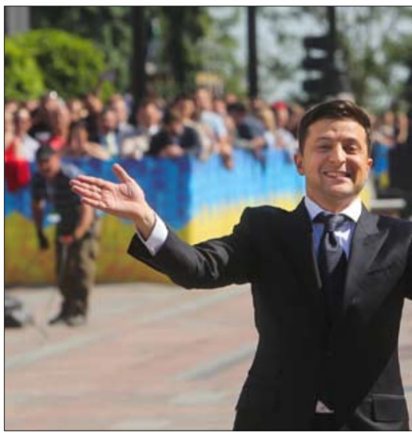
الرئيس الجديد عند وصوله الى البرلمان

الحفاظ على المسار المؤيد للغرب ورفض استئناف الحوار مع روسيا إلا كيف من خطة مساعدات قادها صندوق النقد الدولي، إلا انه تم منح الاعتمادات قفظة قفظة بسبب صعوبة اتخاذ بعض تدابير التقشف في الميزانية، أو مكافحة الفساد. ولا يزال القسط القادم، 1.3 مليار دولار، غير مؤكد. ورغم الإصلاحات التي أجراها رئيس الدولة المنتهية ولايته، فإن متوسط دخل الأوكرانيين هو واحد من أدنى المعدلات في أوروبا. واختتم الرئيس الجديد خطابه "طوال حياتي، حاولت أن أزج الابتسام على شفاه الأوكرانيين، وعلى مدى السنوات الخمس المقبلة، سأفعل كل شيء حتى لا تكون. شكراً لكم، كان مسلياً"، أجاب بصراحة رئيس البرلمان، أندريه باروبويك.