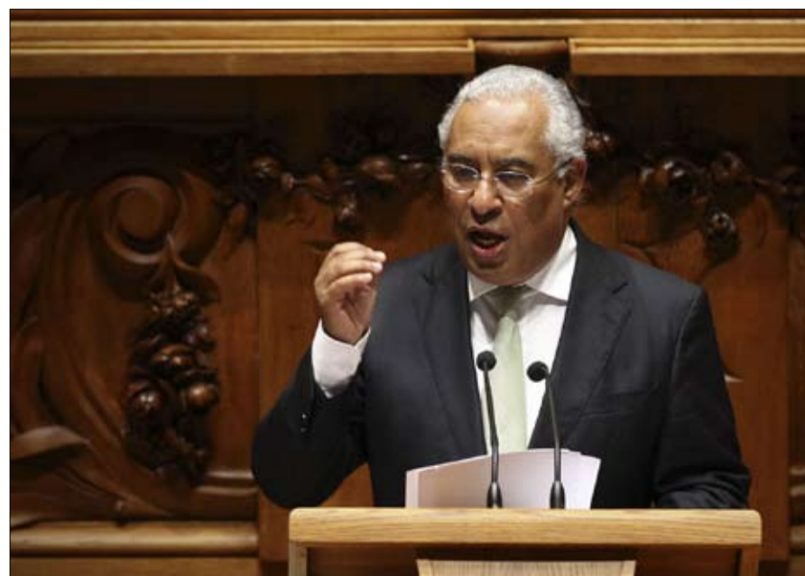
الوضع في البرتغال قريب من إسبانيا

في اليونان، اليسار المتطرف لسيريزا، حتى وإن رُوّضته ممارسة السلطة، يفترض أن يجني سبعة مقاعد و 25 بالمائة من الأصوات، أي يضع نقاط خلف حزب الديمقراطية الجديدة المحافظ، أما حزب باسوك، الحزب الاشتراكي اليوناني، الذي خسّر مصداقيته الكاملة جراء سوء إدارته لأزمة الديون، فقد اختفى