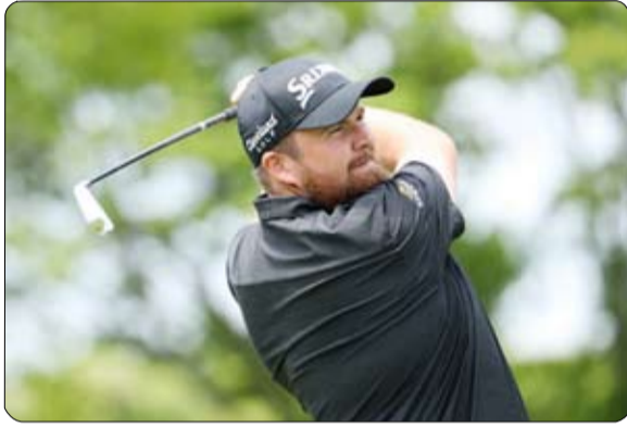
20 لاعباً بعد أن قفز من المركز 21 إلى المركز 19.