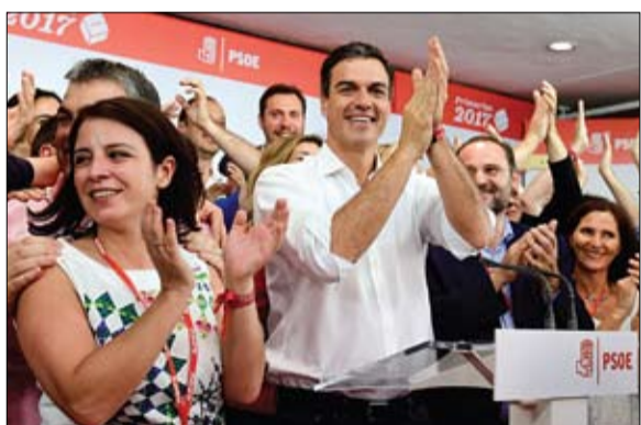
بييرو سانشيز.. امل اليسار الاوروبي

الارهابية المدعومة من إيران من مواصلة استهدافها للأعيان المدنية والمرافق المدنية وكذلك المدنيين وسيكون هناك وسائل رد حازمة وستتخذ قيادة القوات المشتركة كافة الإجراءات الرادعة بما يتوافق مع القانون الدولي الإنساني وقواعد العرفية. إلى ذلك أفادت مصادر ميدانية بسقوط قتلى وجرى من عناصر مليشيات الحوثي في غارات لقناتل التحالف ومواجهات مع القوات المشتركة والحزام الأمني في مناطق متفرقة شمالي محافظة الضالع. واستهدفت مقاتلات التحالف العربي مواقع وتجمعات لمليشيات الحوثي في منطقة الفاخر، وتعزيزات لهم في منطقة الجب المحاذية لمديرية الحساء. كما استهدفت تجمعات لهم في منطقة باجة حجر غربي مديرية قعقبة، وأدت الغارات الى سقوط عدد من القتلى والجرى وتدمير معدات قتالية للحوثيين.