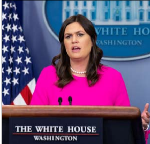
سارة هাকাيب ساندرز.. انتخاب ترامب إرادة إلهية

الذي أخذه الإنجيليون إلى العلن. جورج بوش، "الولد من جديد" (أي اعتنق البروتستانتية الإنجيلية) ، يدين بإعادة انتخابه لدعمهم، حافظت المنظمة الأيديولوجية والسياسية التي تم تحديدها في عهد ريغان، على ثوابتها: "التركيز على القيم العائلية، ومكافحة الإجهاض، أو حقوق المثليين ، ومعارضة نظرية التطور أو الدراسات الجنسية"، يوضح يانكي فير. في فجر القرن الحادي والعشرين، تكمن القوة الضاربة للينتكوستاليين، الناشطون جدا في الأوساط الشعبية، في قدرتهم على الانضمام ، كما رأينا في البرازيل، إلى شكل من أشكال الشعبية.