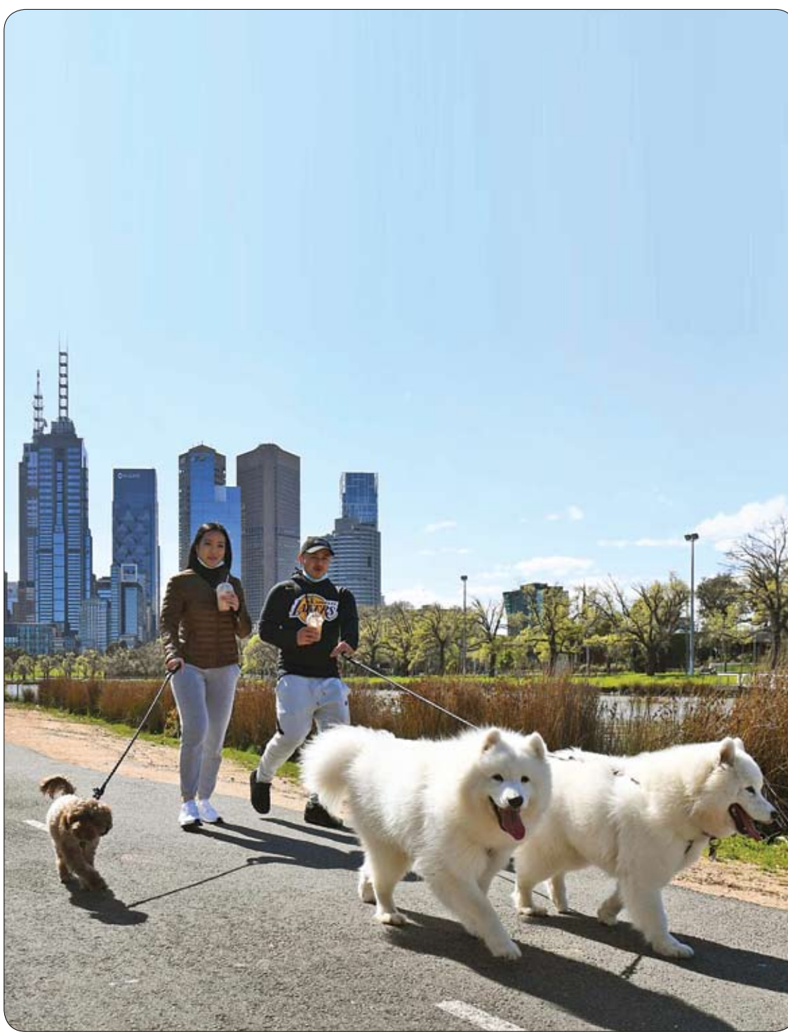
رجل وامرأة يمتحان كلاهما فرصة للمشي على طول ضفاف نهر يارا في ملبورن حيث سيتم رفع حظر التجول الليلي بسبب كورونا في ثاني أكبر مدن أستراليا اعتباراً من اليوم.

لكن على الرغم من التقدم المُحرز في العلاج الطبي، يتمثل أحد أكبر التحديات التي تواجه الأسر في التحكم في الأعراض اليومية لمرض فقر الدم المنجلي، لا سيما لدى الرضع والأطفال.