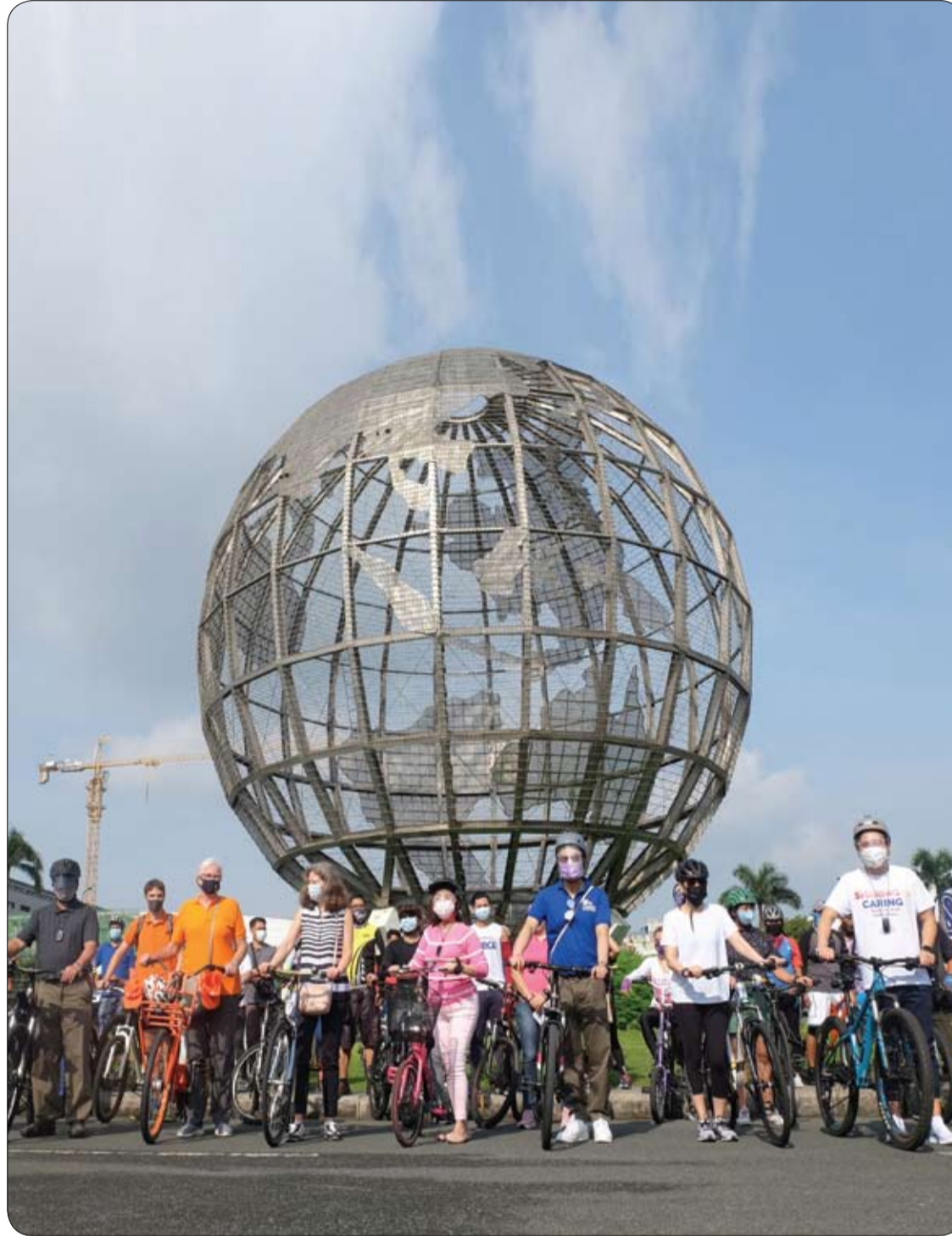
يستعد المشاركون جنباً إلى جنب مع مسؤولي الحكومة المحلية لركوب الدراجات خلال إطلاق فعاليات

ولكن لمجرد أنك تستيقظ كثيرا في الليل، وإذا كنت تنام عادة على معدتك، فهذا لا يعني بالضرورة أنك ستصاب بالخرف بنسبة 100%. حيث أن هناك عوامل أخرى إضافية يمكن أن تلعب دورا أهم في الإصابة بالمرض، مثل العامل الوراثي والتاريخ العائلي للمرض.