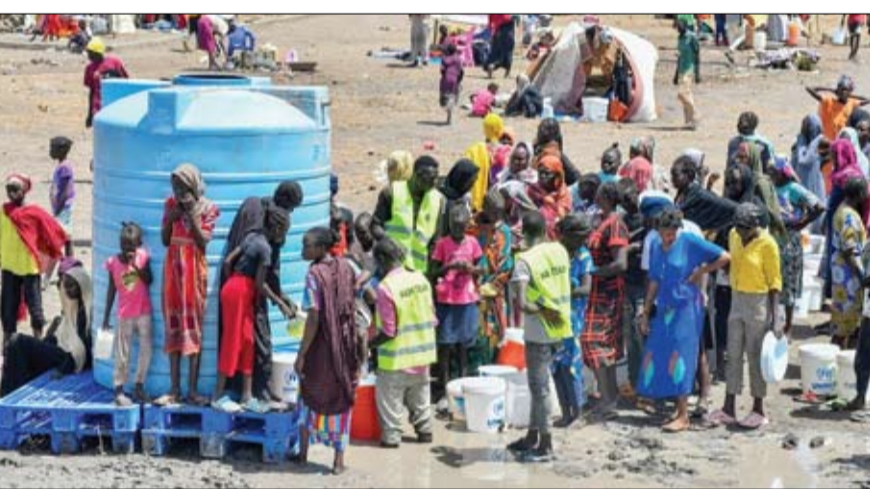
تفاقم الوضع الإنساني في الأقاليم السودانية إثر استمرار الصراع العسكري