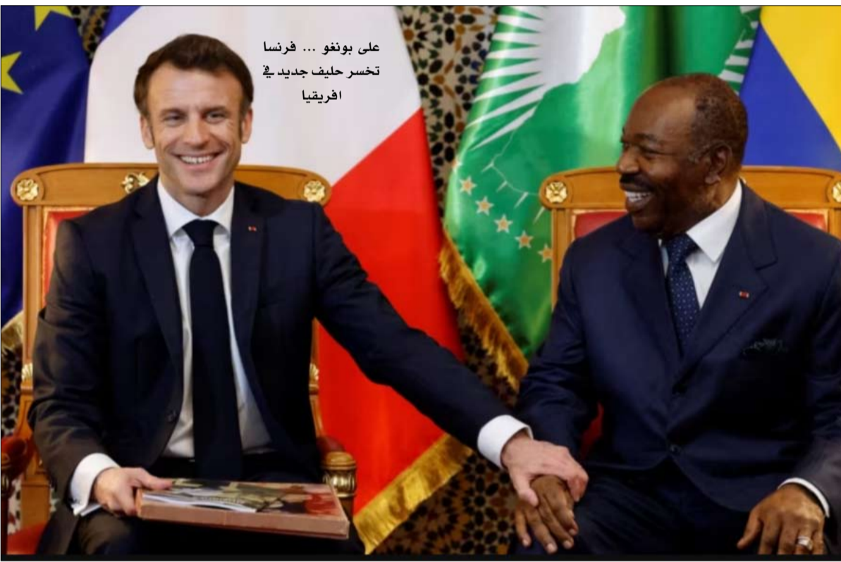
على بونغو... فرنسا تخسر حليف جديد في إفريقيا

كريستوف شاتيلو خيرة الشيباني- عن صحيفة لوموند الفرنسية تواجه المملكة المتحدة حالياً أعلى معدل تضخم