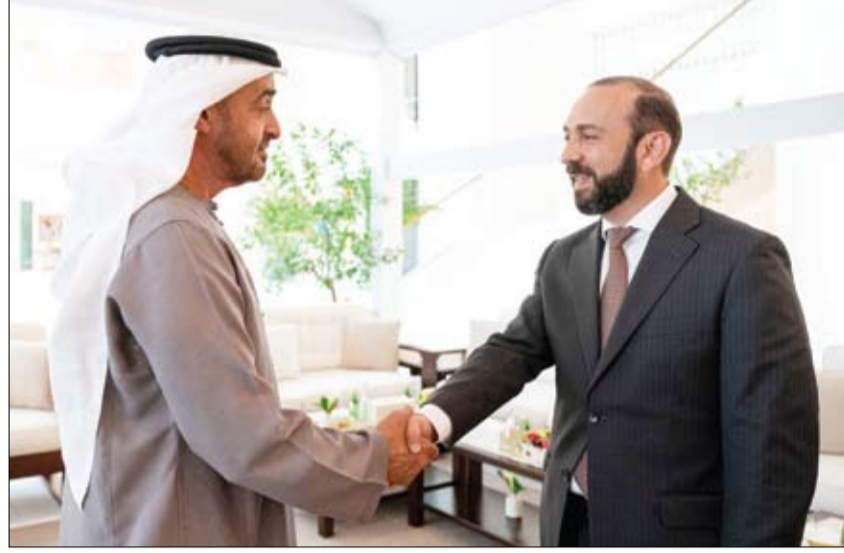
محمد بن زايد خلال استقباله وزير خارجية جمهورية أرمينيا