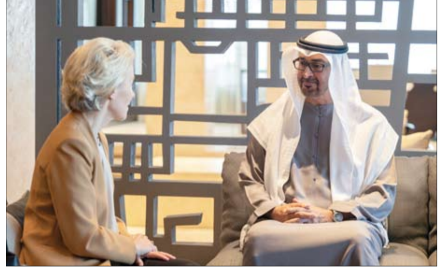
محمد بن زايد خلال استقباله رئيسة المفوضية الأوروبية