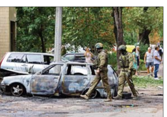
آثار الدمار إثر القصف الروسي على أوديسا الأوكرانية