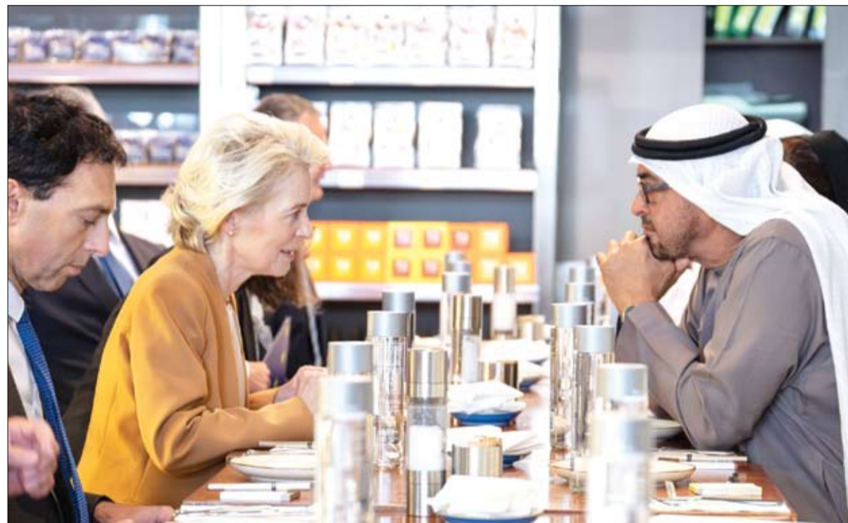
بحثا التعاون والعمل المشترك بين دولة الإمارات والاتحاد الأوروبي