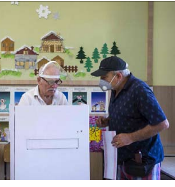
مواطني هونغ كونغ

في ساعة مبكرة الخميس. وفاقم فيروس كورونا المستجد حالة الترف في وقت تسعى السلطات إلى منع تسجيل إصابات جديدة دون الإضرار أكثر باقتصاد يعاني أصلا ويواجه ركودا. وتم تسجيل أكثر من 380 وفاة بالفيروس بين السكان البالغ عددهم مليوني نسمة، ما يجعل هذه الدولة الأكثر تضرا بعدد الوفيات نسبة إلى عدد السكان، في منطقة غرب البلقان، وفق أرقام رسمية.