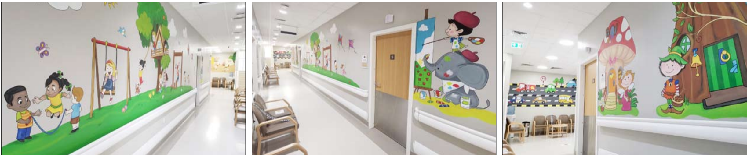
في بيئة آمنة ، وموقع واحد

ينظم نادي دبي للسيدات مخيماً صيفياً اقتراضي للأطفال اعتباراً من الأحد المقبل وذلك في إطار جهودها الاجتماعية الرامية لتوفير نشاط صيفي آمن للأطفال يجمع بين الأهداف التعليمية والتنموية والتسليم والترفيه ويستهدف البنات والأولاد الذين تتراوح أعمارهم بين 6 و12 عاماً. وتضمن فعاليات المخيم التي تقام عن بعد عن طريق برنامج زووم باقة متنوعة من الأنشطة التي تجذب الأطفال وتقدم لهم مهارات جديدة مثل الورش الفنية المبتكرة وحصص فن الطبخ وتجارب الكيمياء التي تجمع بين العلم والمعرفة حصص النشاط والحمام التي تتضمن اللياقة البدنية وزومبا الأطفال ونقش الحناء بالإضافة لتعليم مهارات متمعة في الرياضات السريعة وكذلك مهارات كرة القدم وغيرها من الأنشطة للأطفال من الجنسين.