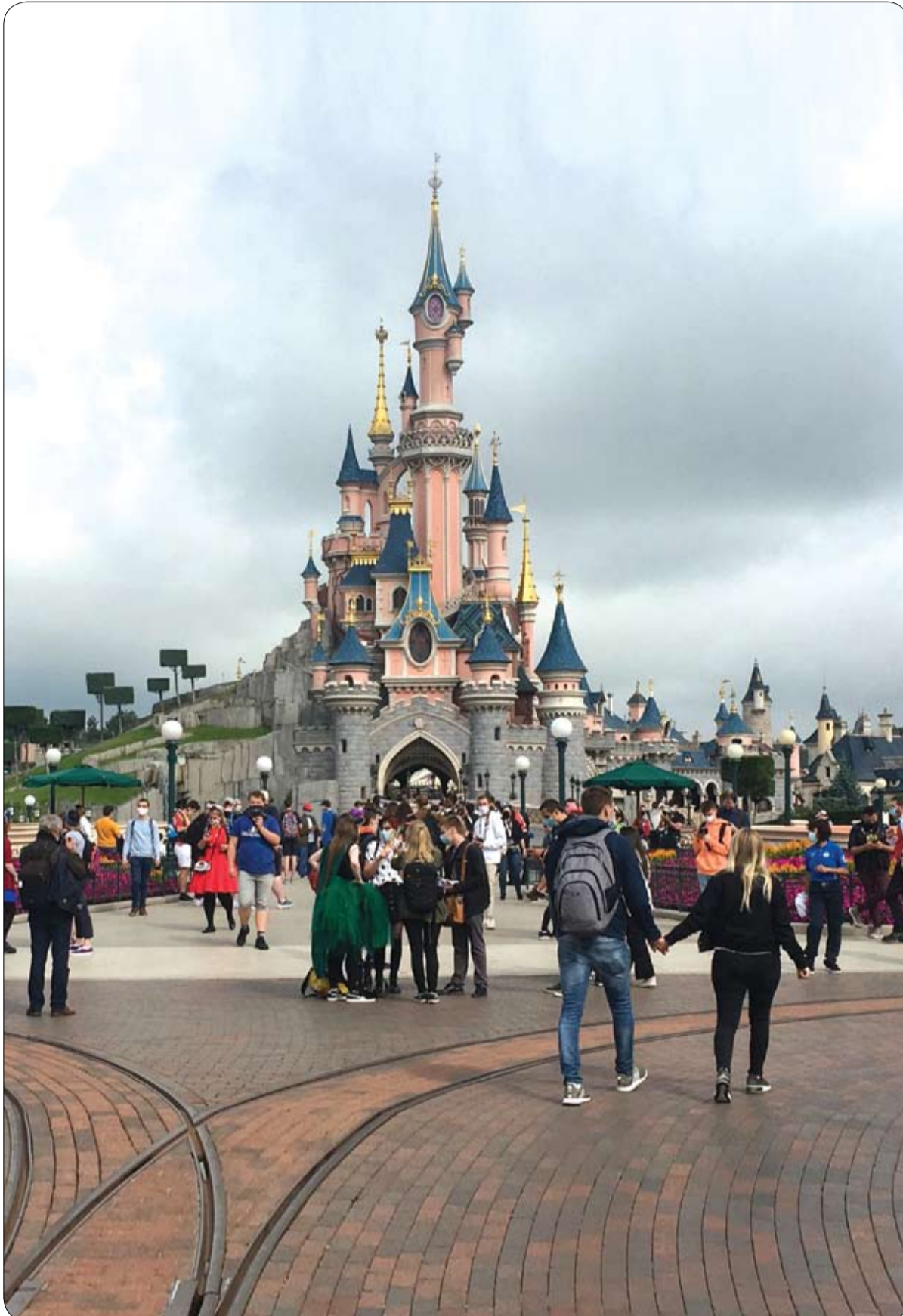
الزوار والموظفون يرتدون أقنعة واقية للوجه، حيث بدأت ديزني لاند باريس في إعادة فتح مرحلي بعد إغلاق أشهر بهدف وقف انتشار فيروس كورونا.