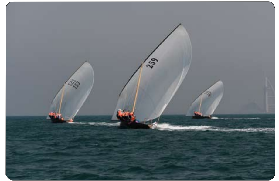
قوارب زايد بن حمدان في القمة