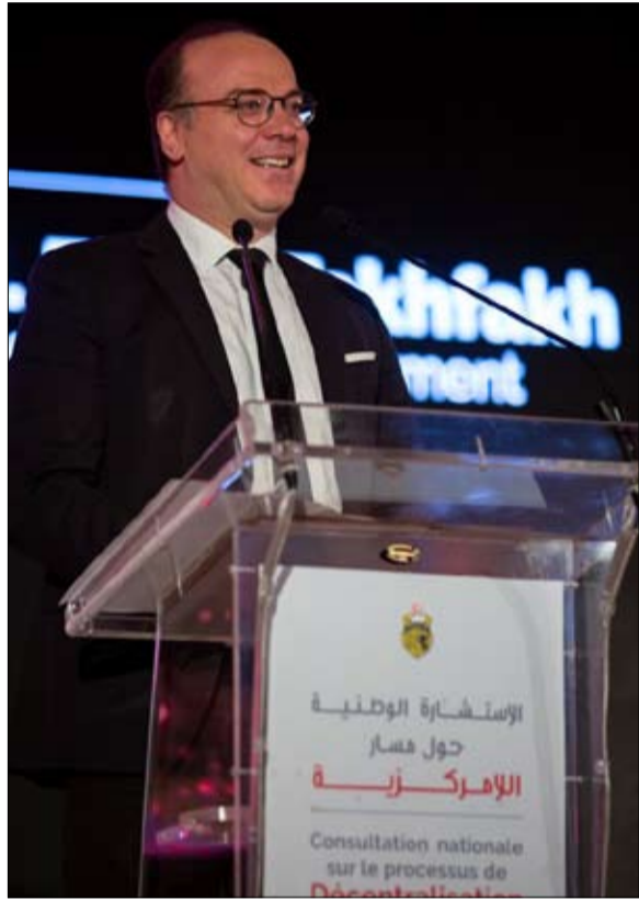
رئيس الحكومة على كرسي هزاز

الحكومة حتى اخر لحظة وحتى الاجتماع قبل الأخير لمجلس الشوري. وجدد الهاروني تأكيده على ان النهضة نهت لوضعية تضارب المصالح وخاصة لمسألة تقسيم وزارة البيئة والشؤون المحلية منذ مفاوضات تشكيل الحكومة لكن دون جدوى. وشدد على ان وضعية رئيس الحكومة الحالية لا تسمح بإدارة الحكومة وادارة شؤون البلاد في أحسن الظروف وعلى ان الحركة وجدت نفسها امام خيارين لا اختار رئيس الجمهورية إلياس الفخفاخ لرئاسة الحكومة إما ان تقبل بوضع ناقص وتعمل على تطويره او الذهاب الى انتخابات سابقة لأوانها مذكرا بأنهم قبلوا كحزب مسؤول بوضع ناقص مع العمل على تطويره وبأنهم