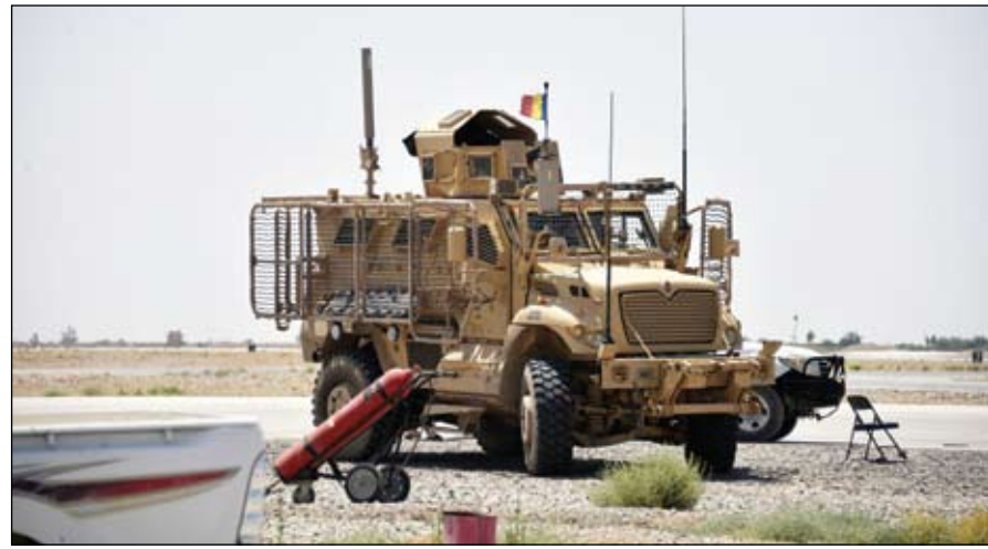
مركبة مصفحة تابعة للنازو خلال دوريات داخل قاعدة عسكرية أمريكية في قندهار.

وقال أوستن خلال زيارة للقيادة الأمريكية في المحيط الهادي والتي مقرها هاواي إن الطريقة التي سنقاتل بها في الحرب الرئيسية المقبلة ستكون مختلفة تماما عن الطريقة التي قاتلنا بها في الحروب السابقة. ولم يشر أوستن بشكل صريح إلى منافسين مثل الصين أو روسيا ولكن تصريحاته جاءت في وقت تبدأ فيه الولايات المتحدة انسحابا