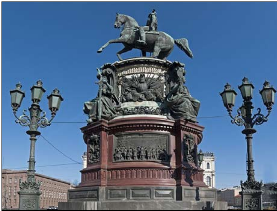
تجسيد جديد لنيكولاس الأول