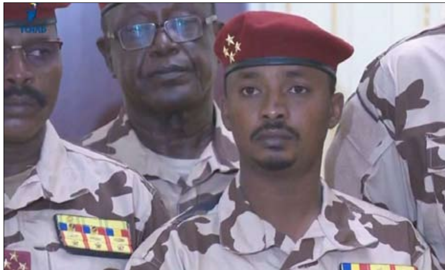
محمد إدريس ديبي، عند إعلان وفاة والده