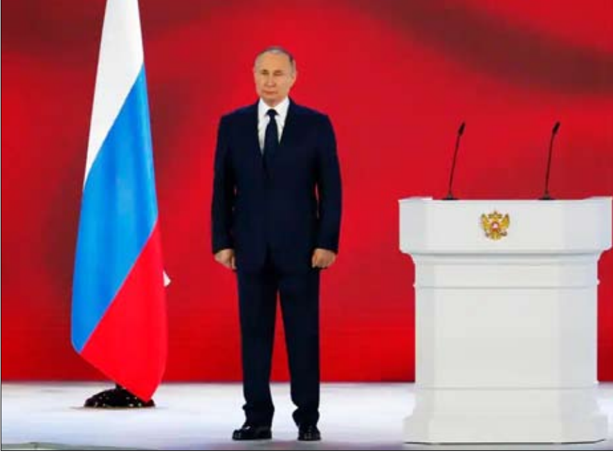
بوتين رجل مرحلة انتقالية

بوتين شخصية انتقالية، لا سوفياتية ولا حقاً مابعد سوفياتية