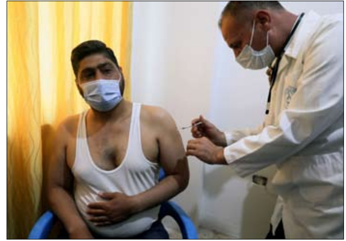
•• إدلب-أ ف ب

وتسلمت مناطق سيطرة الفصائل المقاتلة في محافظة إدلب وشمال حلب في 21 نيسان أبريل أول دفعة مؤلفة من 53.800 جرعة من لقاح أسترازينيكا ضمن برنامج كوفاكس الذي يخصص احتياطاً إنسانياً لا سيما في الدول التي تشهد نزاعات أو انقسامات على غرار سوريا. وفي مدينة إدلب، بدأت الحملة بتلقيح طبيب في مستشفى ابن سينا للأطفال، الذي يقع في وسط المدينة ويعد أحد أكبر مشافيهها.