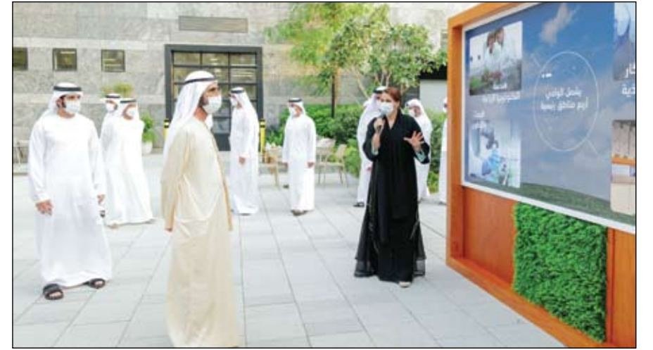
محمد بن راشد خلال إطلاقه مشروع وادي تكنولوجيا الغذاء

استقبل صاحب السمو الشيخ محمد بن زايد آل نهيان ولي عهد أبوظبي نائب القائد الأعلى للقوات المسلحة أمس في قصر الشاطئ.. صاحب السمو الأمير فيصل بن فرحان بن عبدالله وزير خارجية المملكة العربية السعودية الشقيقة. وتبادل سموه ووزير خارجية المملكة التهانى بمناسبة شهر رمضان المبارك متمنين للبلدين الشقيقين دوام الخير والرخاء والازدهار. وبحث الجانبان خلال اللقاء العلاقات الأخوية بين دولة الإمارات والمملكة العربية السعودية والتعاون الإستراتيجي والتنسيق المشترك بينهما في مختلف المجالات، والسبل الكفيلة بدعمه وتطويره بما يحفز المصالح المتبادلة للبلدين وشعبهما الشقيقين. (التفاصيل ص2)