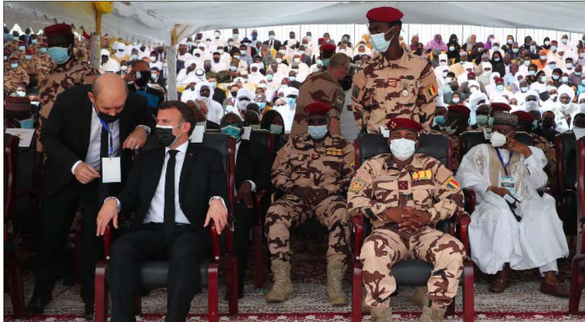
إيمانويل ماكرون ومحمد إدريس ديبي، خلال جنازة إدريس ديبي