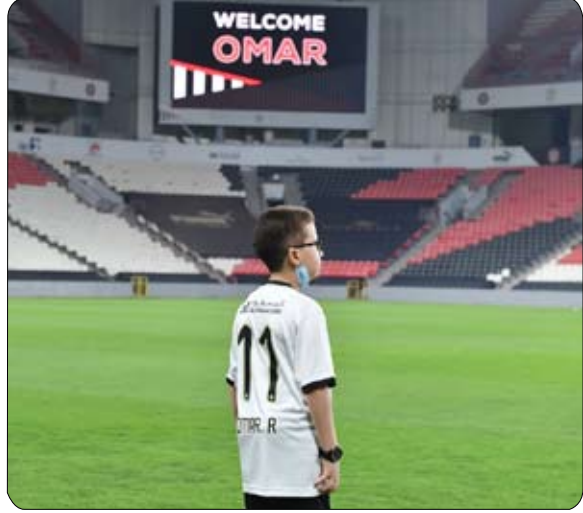
مجتمع الإمارات. أبو ظبي.

عن مؤسسة تحقيق أمنية هي مؤسسة غير ربحية مكرسة لتحقيق أمانى الأطفال الذين يعانون من حال صحية تهدد حياتهم بشكل عام . وهي مؤسسة مرخصة من وزارة تنمية المجتمع بدولة الإمارات العربية المتحدة، ويقع المركز الرئيسي في مدينة خليفة.