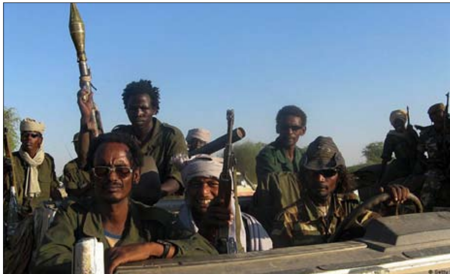
المتطردون على بعد 300 كلم من العاصمة