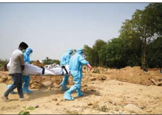
هنود يشيرون ضحايا كورونا في نيودلهي

الاولى التي يتجاوز فيها عدد الحالات بالهند 400 ألف وذلك بعد مرور عشرة أيام متتالية تتجاوز فيها العدد 300 ألف. وقفز عدد الوفيات بسبب المرض بواقع 3523 وفاة خلال الاربعة والعشرين ساعة الماضية، مما رفع إجمالي عدد الوفيات بكوفيد-19