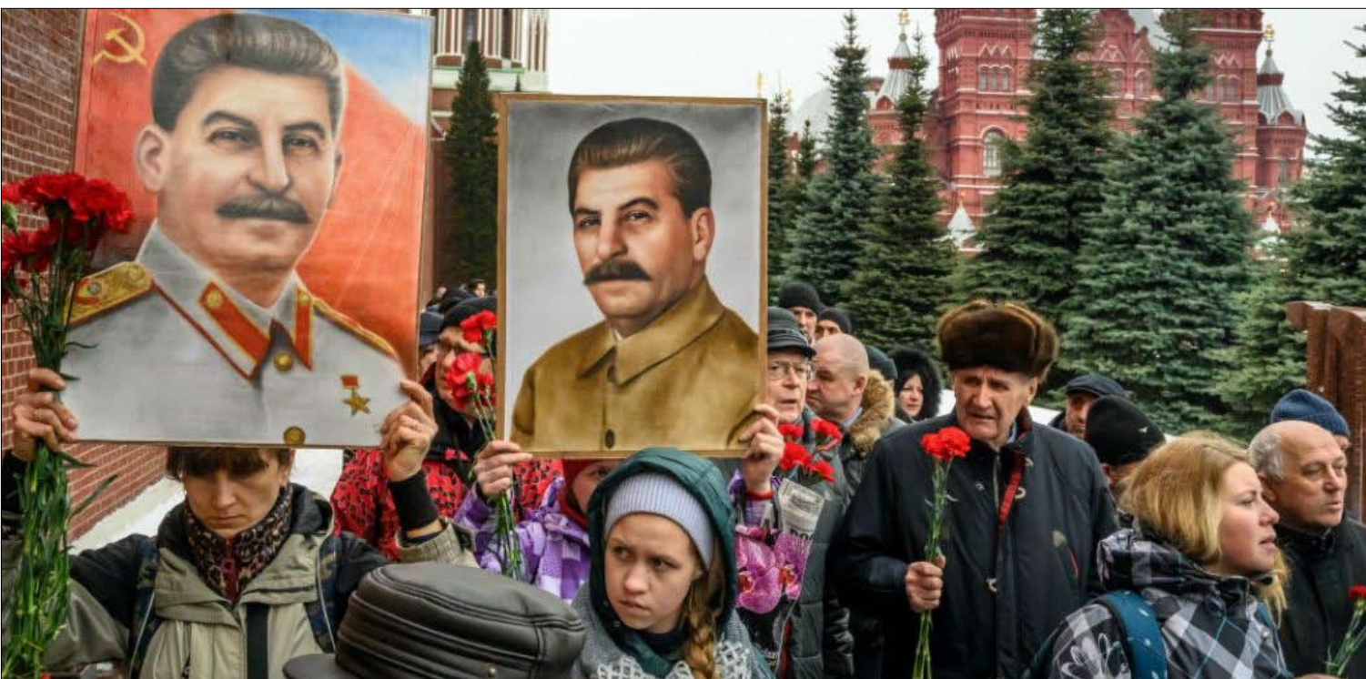
فلاديمير ليس ستالين