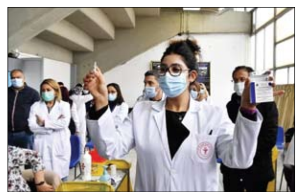
ارتفاع عدد المصابين في تونس

قال مسؤول في لجنة مستشارين علميين شكلتها الحكومة الهندية في تصريحات لرويترز إن اللجنة أبلغت السلطات باكتشاف طفرات طفيفة في بعض عينات فيروس كورونا يمكنها أن تتجنب الاستجابة المناعية وتتطلب مزيدا من الدراسة. وأضاف المستشارون أنهم يعملون على تحديد هذه الطفرات ولا يوجد سبب حاليا للاعتقاد بأنها تنتشر أو تمثل خطورة كبيرة. من جهة أخرى سجلت الهند أمس السبت رقما قياسيا جديدا بالنسبة لعدد الإصابات اليومية بفيروس كورونا بلغ 401993 إصابة، في حين فتحت البلاد حملة التطعيم الضخمة أمام كل البالغين رغم أن بعض الولايات حذرت من حدوث نقص حاد. وهذه هي المرة