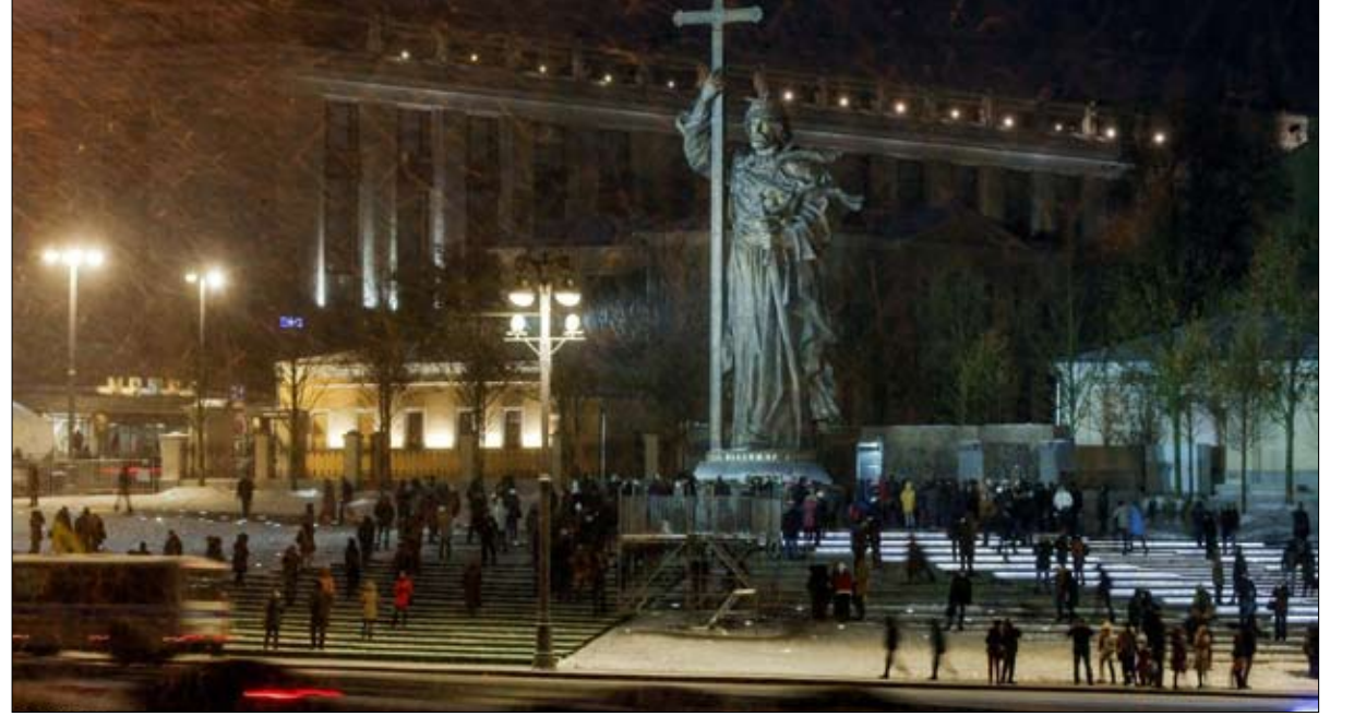
اقام بوتين تمثالا ضخما للقدس فلاديمير

بوتين شخصية انتقالية، لا سوفياتية ولا حقاً مابعد سوفياتية