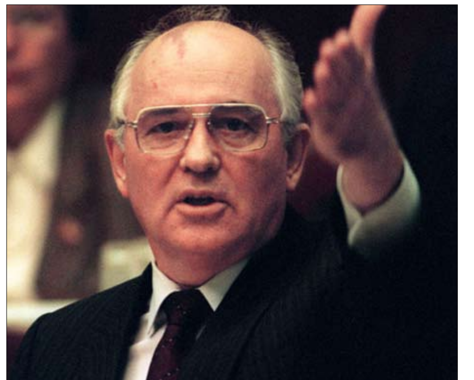
غورباتشوف... روسيا الرخوة