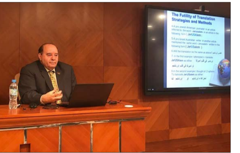
ضمن مشروعه الوطني والتنقيضي «ترجمات»