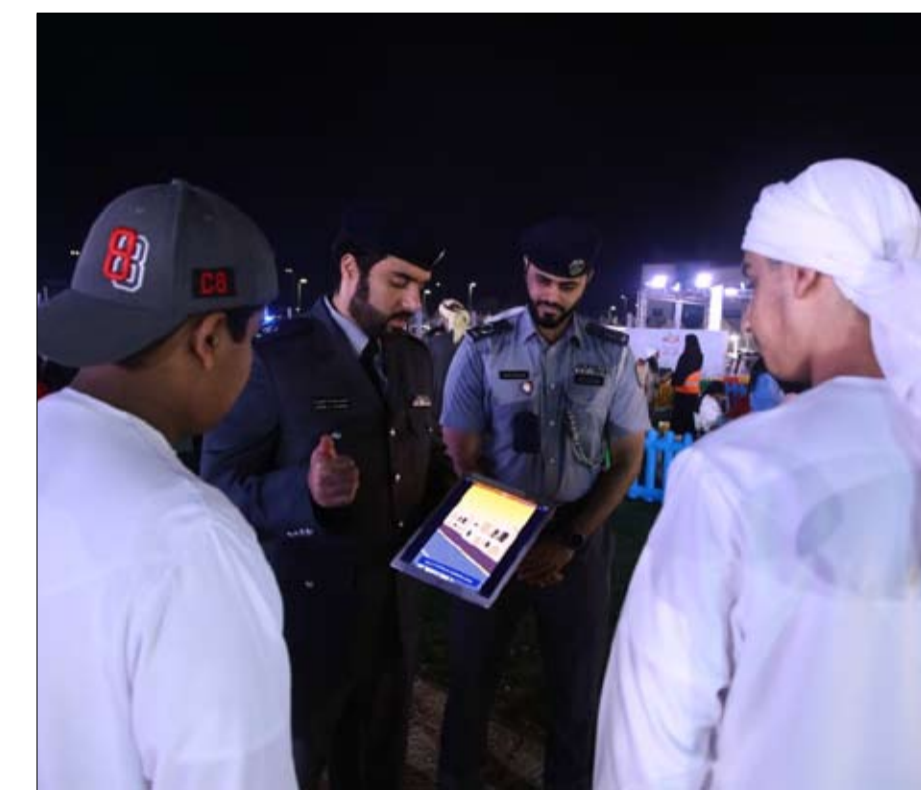
الطفل ودور دورية السعادة في تعزيز الإيجابية .

ضرورة التعاون في تحقيق التطلعات بتعزيز السلامة المرورية لافتاً إلى أهمية نشر ثقافة الوعي المروري لدى الجمهور بما يعكس إيجابياً على جهود الحد من الحوادث على الطرق، والسلامة العامة، والحفاظ على مكتسبات الأمن والاستقرار.