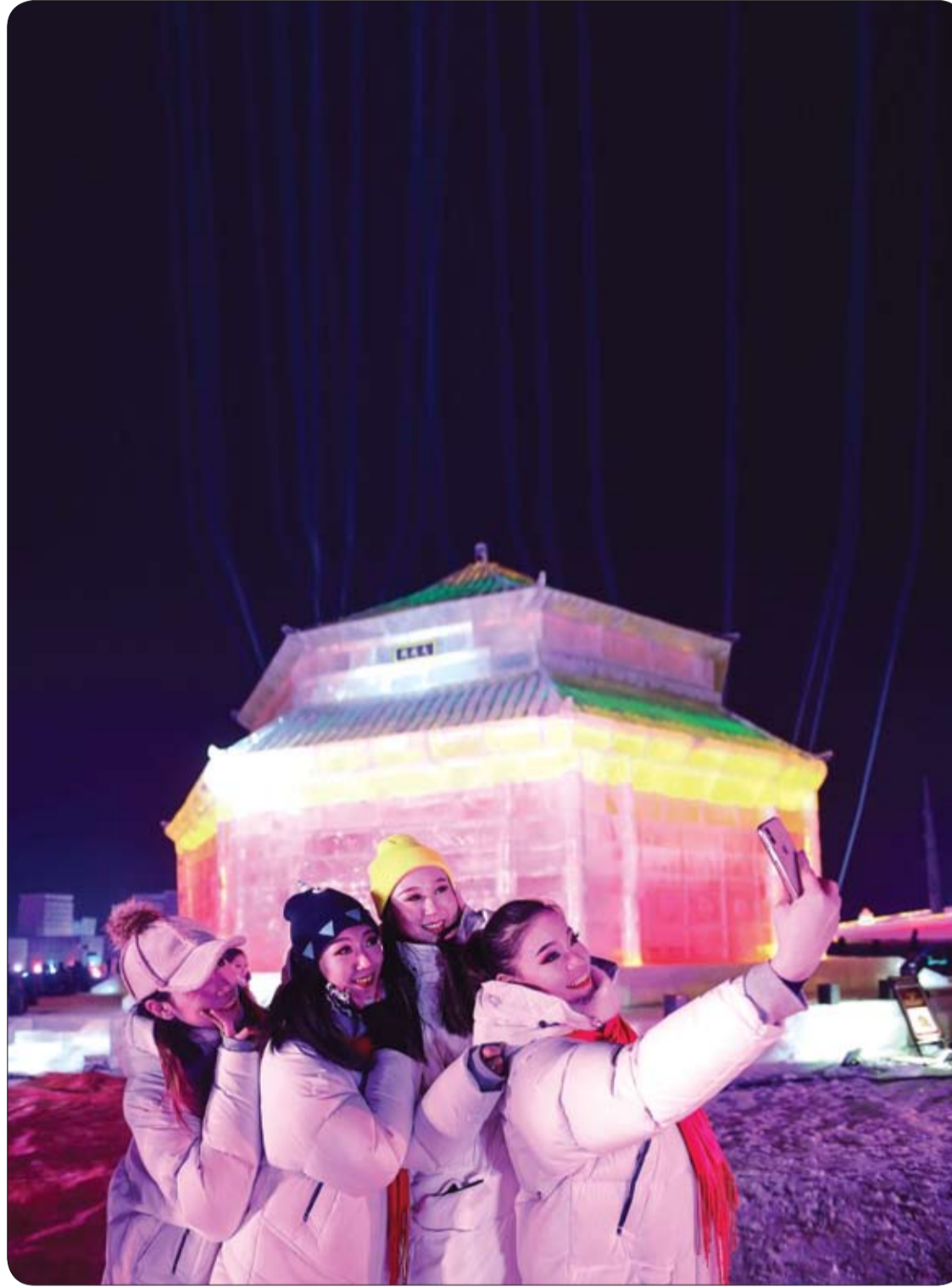
فتيات يلتقطن صوراً شخصية أثناء زيارتهن لعرض نحت الثلج في شنيانغ بمقاطعة لياونينغ بشمال شرق الصين. ا ف ب

تعاني الكثير من النساء من الإصابة باكتئاب ما بعد الولادة، وكل ما يحتجن إليه في معاناتهن، هو الدعم، لذا من الضروري معرفة الأسباب التي تزيد من احتمال الإصابة، من أجل الاستعداد للتعامل مع الأمر، وأخيراً، ظهرت دراسة حديثة لتشير بأصابع الاتهام إلى جنس المولود. ففي دراسة أجريت في جامعة Kent، أشار الباحثون إلى أن النساء الحوامل بذكور، يصبحن أكثر عرضة للإصابة باكتئاب ما بعد الولادة. الدراسة شملت بيانات 296 امرأة، من حيث جنس المولود، وحالتهم بعد الولادة، وكشفت النتائج أن إناج الذكور يزيد احتمال الإصابة باكتئاب ما بعد الولادة بنسبة تصل إلى 79%. وأعزى العلماء نتائج الدراسة إلى أن استجابة الجهاز المناعي للالتهابات، يتناسب طردياً مع الإصابة بالاكتئاب، وبما أن الالتهابات تزداد في حال إناج الذكور، بالتالي تزداد نسبة الإصابة بالاكتئاب ما بعد الولادة للأمهات الحوامل بأجنة ذكور. وعلى هامش الدراسة، أوصى العلماء بأهمية تقديم الدعم النفسي للأمهات من أجل تخفيف حدة أعراض اكتئاب ما بعد الولادة، وسرعة الشفاء منه، وأن يكون المحيطون بالحامل على استعداد لتقديم الدعم الكامل لها.