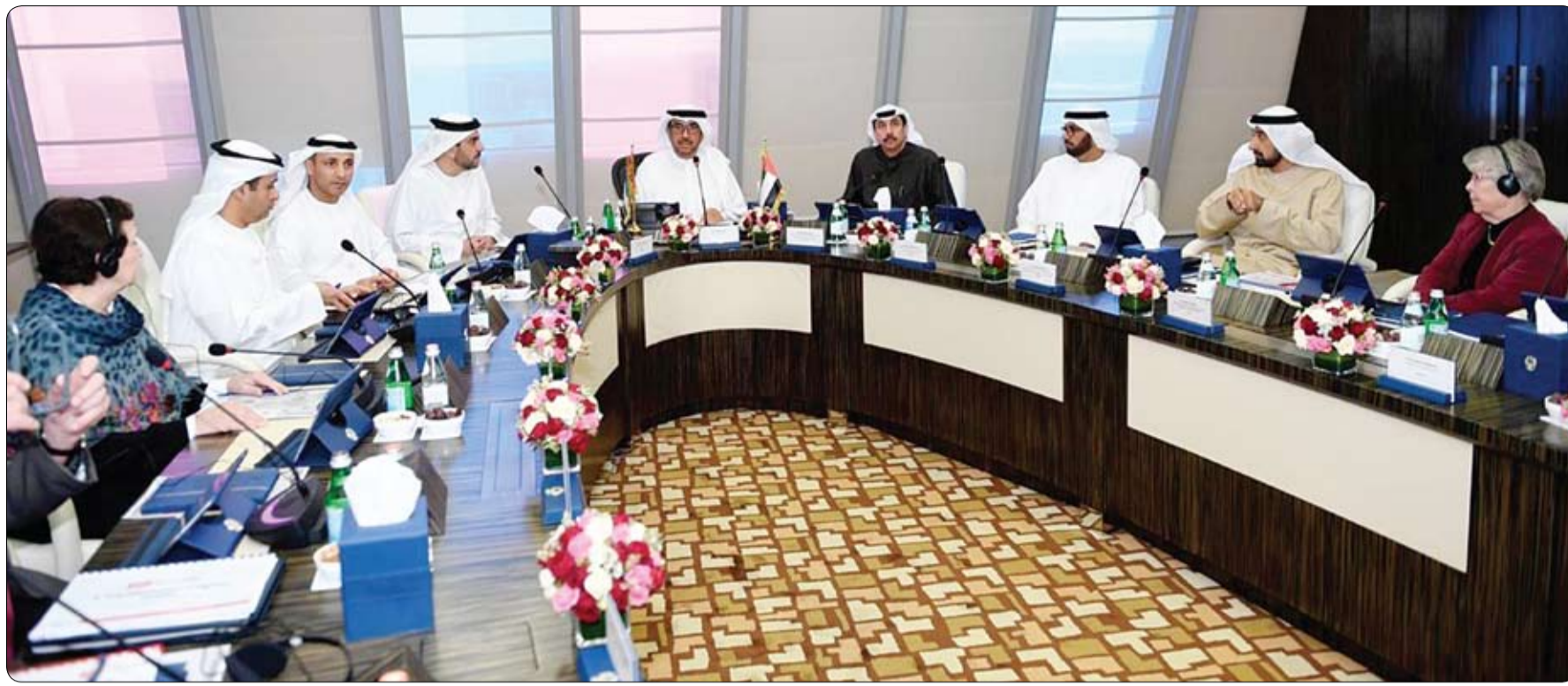
خلال اجتماعه الثاني بالعين