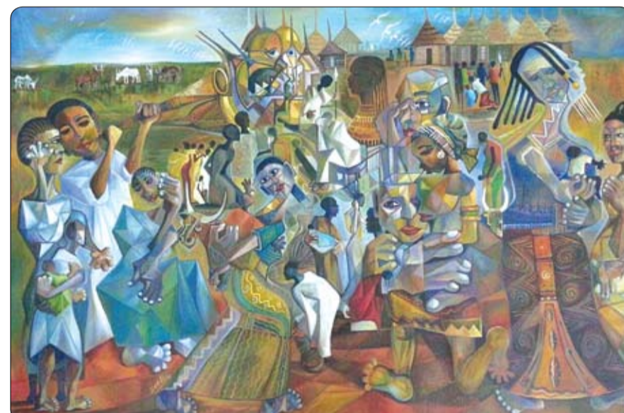
تصوّر للوطن والتاريخ