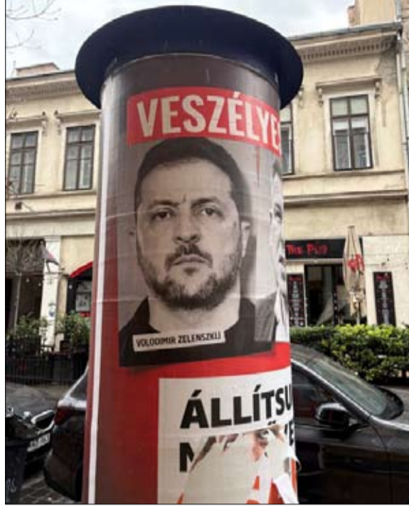
فلماذا تستمر الصين في المجر؟