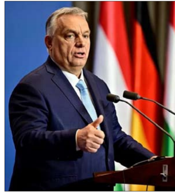
أوربان يرى أن قيادة الفوضوية الأوروبية الحالية الأسوأ في التاريخ