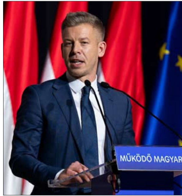
زعيم المعارضة المجرية ماغيار يتعهد بإعادة المجر إلى الغرب

كابوس لبروكسل يعرف فيكتور أوربان أكثر من غيره أوجه القصور في هذه أوروبا التي يكرهها، بما في ذلك المادة 7 سينة السمعة من معاهدة الاتحاد الأوروبي التي تسمح بحرمات دولة عضو من حقوقها التصويتية بموافقة بالإجماع من الدول الـ 26 الأخرى. ويعزز رئيس الوزراء المجري علاقاته مع أعلى المستويات، بإمكانه الاعتمادي، نظيره السلوفاكي، روبرت فيكو، الذي وعد بالفعل بمرقعة القرض لأوكرانيا في حال خسارة فيكتور أوربان في انتخابات أبريل. كابوس لبروكسل. من جانبها، يتعهد زعيم المعارضة، بيتر ماغيار، بأنه في حال انتخابه، سيتصدى لرفع جميع الأموال الأوروبية. إلا أن ترشحه يثير أملاً حذرًا لدى الدول الـ 26 يقول دبلوماسي أوروبي: «لا ننسى أنه كان جزءاً من الدائرة القريبة لأوربان لعشر سنوات، حتى عام 2024، كان ماغيار مسؤولاً تنفيذياً في حزب فيدس، ومستورجاً من وزيرة العدل. الآن، بعد أن أصبح معارضاً ومطلقاً، لا يزال حذرًا للغاية بشأن أوكرانيا، ويتجنب بعناية أي دعم مطلق - حتى أنه يعارض تسليم الأسلحة إلى كييف. إذا فاز، فإن الجزء الأصعب لا يزال في انتظاره. في دولة يهيمن عليها أوربان وفي وضع اقتصادي سيء، باختصار، سيفعل «فيكتور، كل شيء لتقويض منافسه. هل سيعود أقوى بعد أربع سنوات؟ أوربان، البالغ من العمر 62 عاماً، لا يزال أمامه عمر ميد.