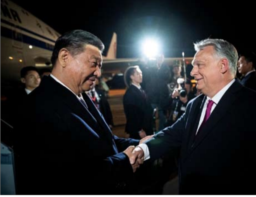
أوربان جعل من المجر أكثر بلدان أوروبا تقارباً مع الصين

بشعار: «لا تدعوا زليينسكي يضحك أخيراً». ثم يكن على الحزب الحاكم، فيدس، البحث طويلاً للعثور على هذه الجوهرة، وهي نسخة طبق الأصل - كلمة بكلمة - من ملصق حملته الانتخابية لعام 2018، الذي استهدف الملياردير جورج سوروس. وهكذا، يستمر فيكتور أوربان في منصبه، مدفوعاً بخطاب «العدو الأول للشعب»، لقياب الأخبار السارة. يجب القول إن سجل المجر بعيد كل البعد عن الإلهام.