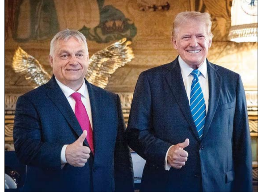
ترامب يدعو المجرين لانتخاب أوربان

للمدبراطيات حول العالم، فإذا فشل أوربان، فسويوه ضربة قوية لصعود المد الشعبي. أما فوزه، على النقيض، فسيسبب وكأنه انتصار للنموذج الذي يتبناه ترامب وبوتين. ويتابع شي جين بينغ هذه الانتخابات عن كثب. فمنذ عام 2023، تُعد الصين المستثمر الأجنبي الرئيسي في البلاد، وتعتمد على شريكها المهم للدفاع عن مصالحها في الاتحاد الأوروبي. وتلخص ناتالي لوازو، عضوة البرلمان الأوروبي قائلة: «لدينا في الاتحاد الأوروبي حصان طروادة يخدم خصومنا الثلاثة: الولايات المتحدة بقيادة دونالد ترامب، وروسيا، والصين». وقد جعل فيكتور أوربان من هذا سلاحه الدبلوماسي الرئيسي. ويشير إيفان كراستيف، عالم السياسة البلغاري، إلى أنه «على مدى الثلاثين عاماً الماضية، ركز حوالي 40% من الاستثمارات الصينية في أوروبا في المجر، لأن أوربان هو الزعيم الوحيد الذي يعارض السياسات المعادية للصين، حيث يرى كراستيف أن أوربان يبيع حق النقض ليكبن. لكنه يحتاج إلى السوق الأوروبية المشتركة لتحقيق ذلك. وإلا،