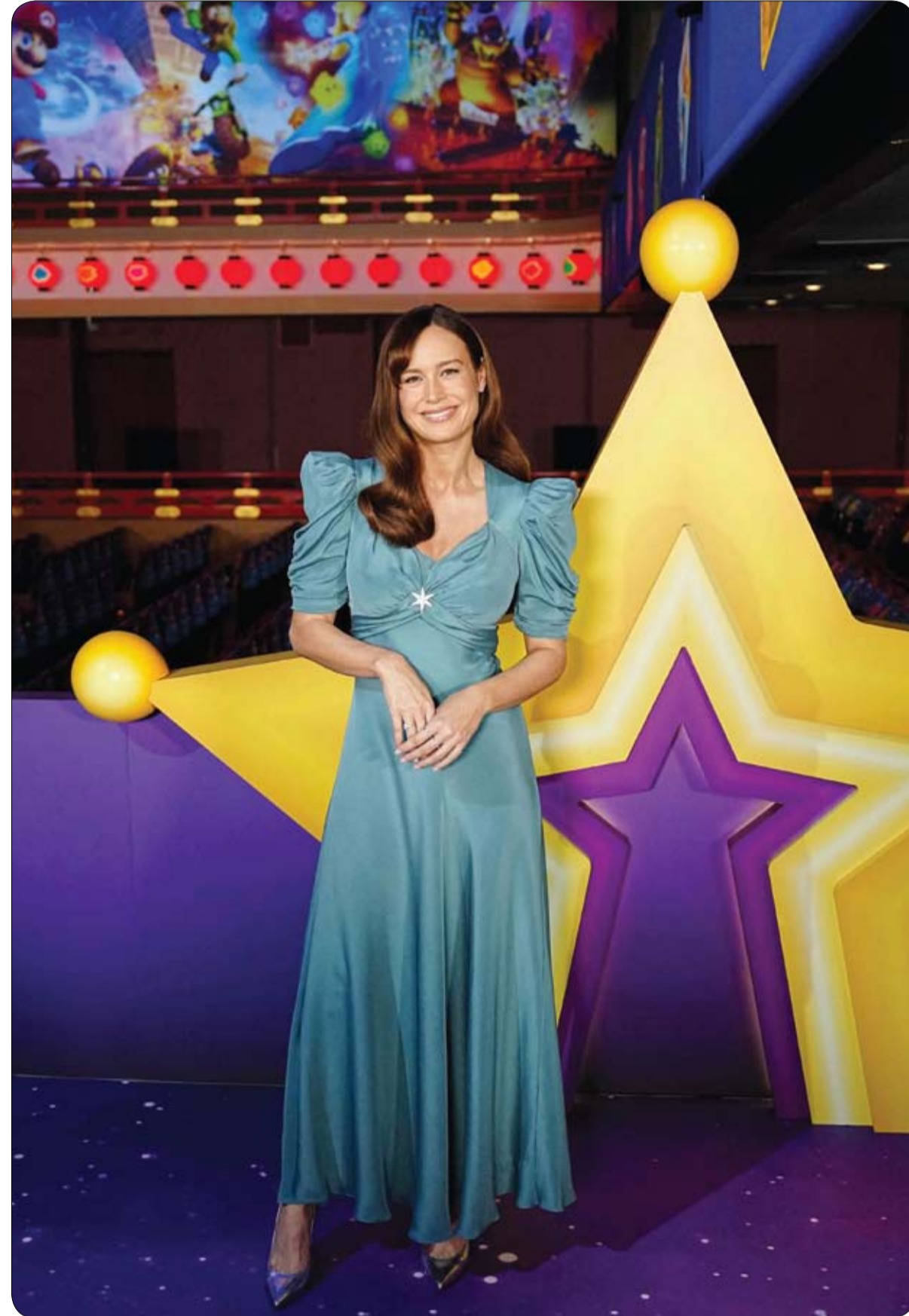
الممثلة الأمريكية بري لارسون لدى حضورها العرض العالمي الأول لفيلم «سوبر مارينو جالاكسي» في كيتو.

في تطور جديد لقضية هزت أروقة هوليوود، تواجه النجمة بليك لايفلي ضغوطاً متزايدة قد تهدد مستقبلها الفني، بعد قرار قضائي شكل نقطة تحول في نزاعها مع زميلها جاستن بالدوني. فقد أسقطت المحكمة معظم الاتهامات التي تقدمت بها لايفلي، بما في ذلك التحرش والتشهير والتأمير، وهو ما اعتبره خبراء خطوة قد تلقي بظلالها على صورتها العامة داخل صناعة السينما. ورغم ذلك، لا تزال بعض القضايا قائمة، مثل "حرق العقد" و"الانتقام"، ومن المقرر أن تُنظر أمام القضاء خلال الفترة المقبلة. ويرى مختصون في إدارة السمعة أن هذه التطورات قد تجعل الطريق أكثر صعوبة أمام النجمة، خاصة في ظل طبيعة هوليوود التنافسية وسرعة تبدل نجومها. فمع تصاعد ثقافة "الإلغاء" وزيادة التدقيق الجماهيري، أصبحت شركات الإنتاج أكثر حذراً في اختيار الأسماء التي قد تثير الجدل.