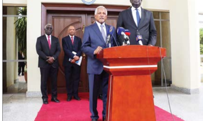
البعوث الخاص لقائد الجيش خلال مؤتمر صحفي مع وزير خارجية جنوب السودان في جوبا

تفصيلاً، قالت منظمة الصحة العالمية إن 604 أشخاص قتلوا جراء الصراع السوداني حتى الآن، مشيرة إلى إصابة أكثر من 5000 آخرين. من جهة ثانية، قال المتحدث باسم المنظمة الدولية للهجرة بول ديولون، أمس الثلاثاء، إن عدد النازحين داخل السودان ارتفع لأكثر من مثليه في الأسبوع الماضي ليبلغ أكثر من 700 ألف في ظل استمرار القتال بين الجيش وقوات الدعم السريع شبه العسكرية. وأضاف ديولون خلال مؤتمر صحفي في جنيف عدد النازحين داخليا في السودان ارتفع إلى أكثر من مثليه في الأسبوع الماضي، وفقا لرويتزر. كانت المنظمة قد أعلنت في الأسبوع الماضي أن عدد النازحين داخل السودان بلغ نحو 340 ألفاً.