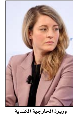
وزيرة الخارجية الكندية

شريك تجاري لكندا، بالرد. وأعلنت وزارة الخارجية الصينية الإثنين أن "الصين قررت إعلان جينيفر لين لالوند الفئصل العامة لكندا في شنغهاي شخصاً غير مرغوب فيه" مضيفاً أنها "تحتفظ بالحق في اتخاذ مزيد من الإجراءات الرد." وأضافت أن حكومة جاستن ترودو "تنتهك بشكل خطير ليس القانون الدولي فحسب بل أيضا القواعد الأساسية للعلاقات الدولية." ودعت الصين كندا إلى وقف "الاستفزازات غير المبررة" بعد طرد متبادل لدبلوماسيين من البلدين. وقال الناطق باسم وزارة الخارجية وانغ ونبين في إعادة صحافية "ننصح الجانب الكندي بالتوقف الفوري عن استفزازاته غير المبررة (...). إذا لم يصمت الجانب الكندي لهذه التصيحة وتصرف بتهور، ستتحذ (الصين) إجراءات انتقامية حازمة وقوية