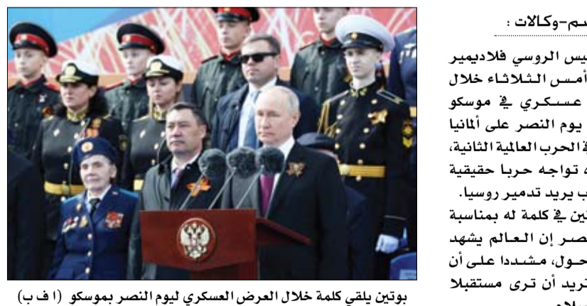
بوتين يلقى كلمة خلال العرض العسكري ليوم النصر بموسكو

الأمينة مشددة في أعقاب سلسلة هجمات بالطائرات المسيرة من بينها هجوم على الكرملين نفسه تلقى موسكو باللائمة فيه على أوكرانيا. ويعد يوم النصر من أهم العطلات الرسمية في روسيا ويحيى الروس فيه ذكرى التضحيات الكبيرة التي بذلتها الاتحاد السوفيتي في أثناء ما يعرف باسم الحرب الوطنية