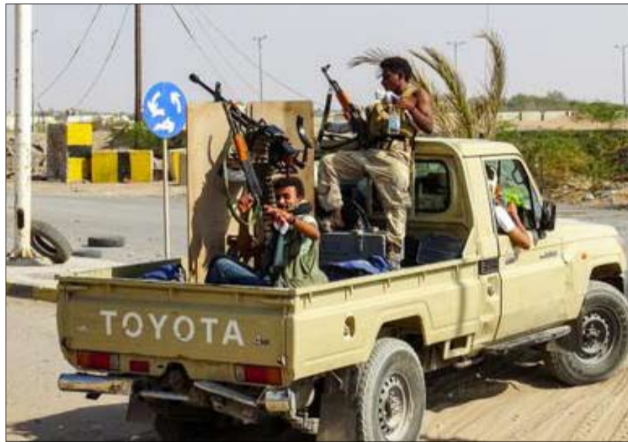
انقلاب داخل الانقلاب ونقل صحيفة "الرؤية" الإماراتية أن الحوثيين أطلقوا حملة لإبعاد قيادات بارزة محسوبة على حزب المؤتمر الشعبي العام في صنعاء عن مناصبها. إما عبر الترفيعية ولا للمناورات السياسية للحوثيين، وعلى المجتمع الدولي أن يكون حازماً معهم عبر اتخاذ إجراءات عقابية لحملهم على الانخراط في مساعي السلام من دون تردد والالتزام بتعهداتهم.

تسعى ميليشيا الحوثي المدعومة من إيران إلى التثبيت بمراكزها ونقاطها التي تسيطر عليها في الداخل اليمني، ما قد يشير إلى تصعيد عسكري جديد قد تعيشه البلاد الغارقة في النزاع المسلح منذ انقلاب تلك الميليشيات على الشرعية في سبتمبر-أيلول 2014. ووفقاً لصحف عربية صادرة أمس الأحد، تتزايد الدعوات لاسيما العربية منها لضرورة وضع حد لتمادي الانفصاليين عبر قرارات أممية تعكس مسيرة الحوثيين في وضع العراقيل أمام خطط السلام.