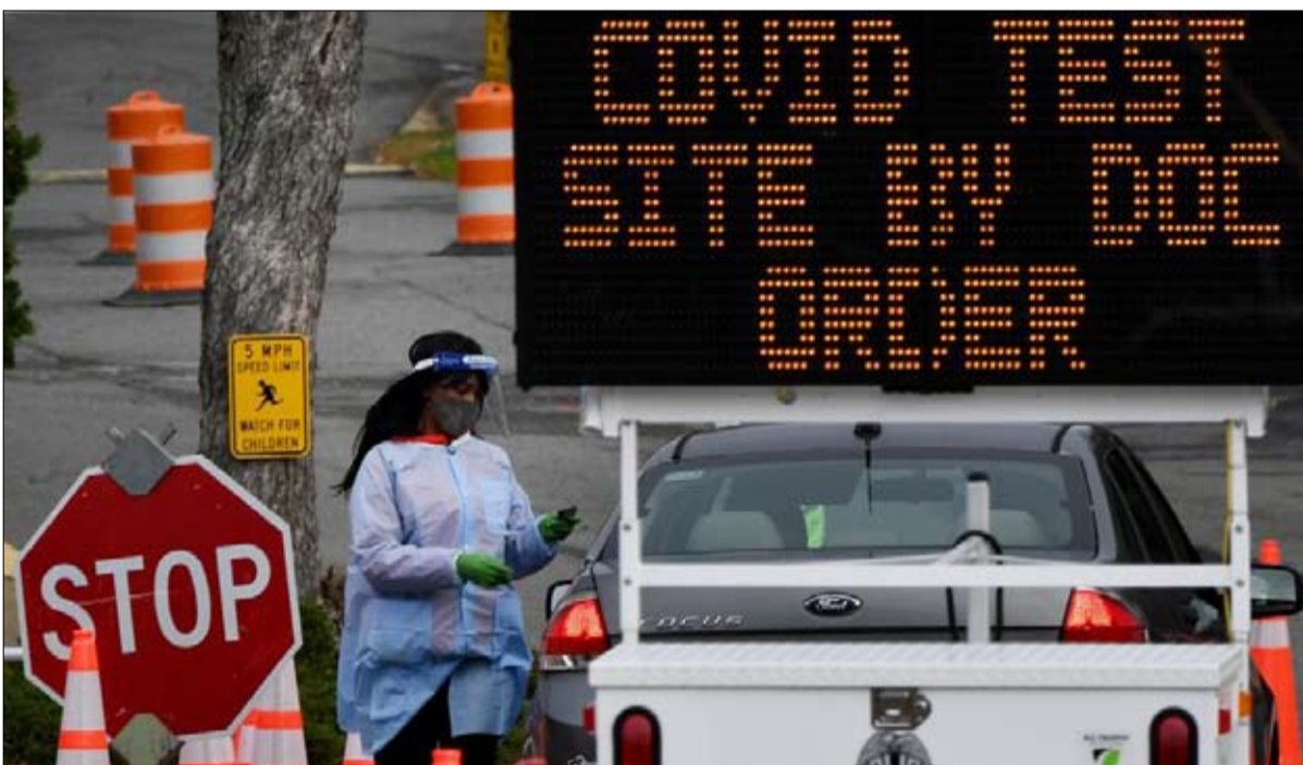
في مواجهة شتاء قاتل

وتتم تحديد أكثر من مليون حالة جديدة في الأيام الخمسة الأولى من شهر ديسمبر، وللمرة الأولى منذ بداية الوباء، تم نقل أكثر من 101 ألف شخص إلى المستشفى. يوم الجمعة وحده، تم تسجيل 225 ألف حالة جديدة، و2563 حالة وفاة، وفقا لمشروع تتبع كوفيد. وكانت آخر مرة تجاوزت فيها الولايات المتحدة الفتي حالة وفاة في شهر أبريل. وأدى الفيروس حتى الآن بحياة أكثر من 281 ألف شخص، أي ما يقرب من خمسة أضعاف عدد القتلى الأمريكيين في فيتنام، وما يعادل عدد سكان مدينة ستراسبورغ.