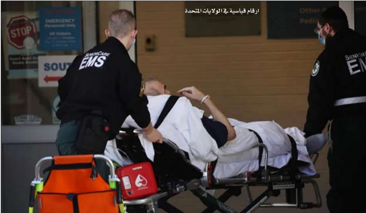
ارقام قياسية في الولايات المتحدة

في الولايات المتحدة، كان الأسبوع المنقضي من أسوأ الأسابيع على جبهة الوباء منذ تسعة أشهر. فقد سجلت البلاد أرقاما قياسية جديدة للعدوى ودخول المستشفيات كل يوم تقريبا.