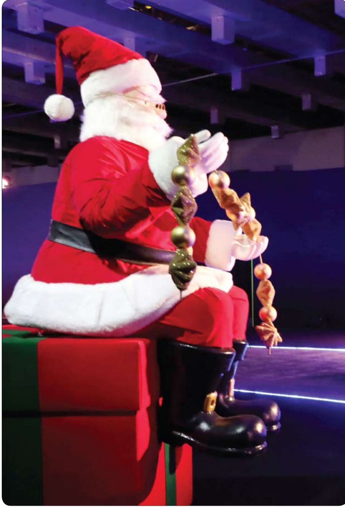
تمثال سانتا كلوز أمام مقر مهرجان لومينا فاست، وهو مهرجان ضوئي لعيد الميلاد، في ساو باولو، البرازيل.