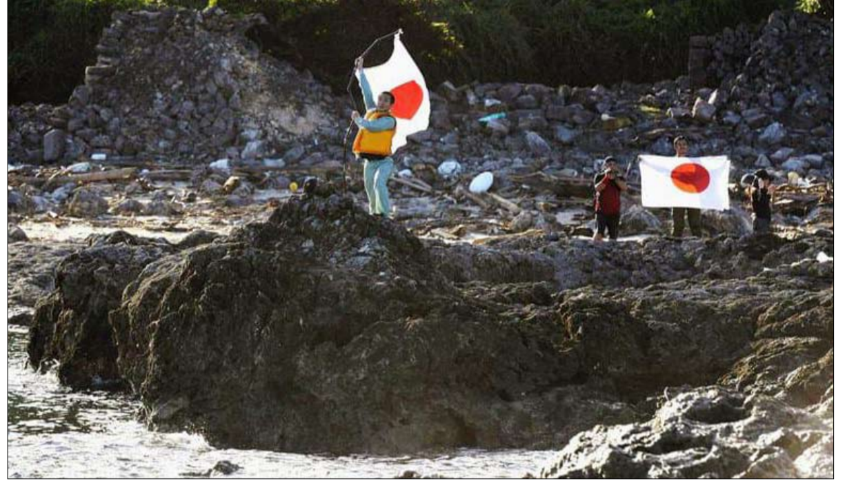
الجزر اليابانية مادة حرب وصراع مستقبلي

نقاط الضعف في النظام الصيني (الديون المدومة في الميزانيات العمومية للبنوك، التفاوت الاجتماعي، الشرح المرضي للمواد الخام...)، ستشهد البلاد نمواً إيجابياً بأكثر من 1 بالمائة عام 2020. وهذه النتيجة مهمة مقارنة بحالات الركود في الدول