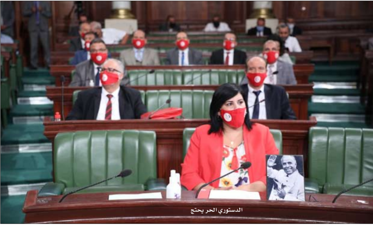
الدستوري الحر يحتج