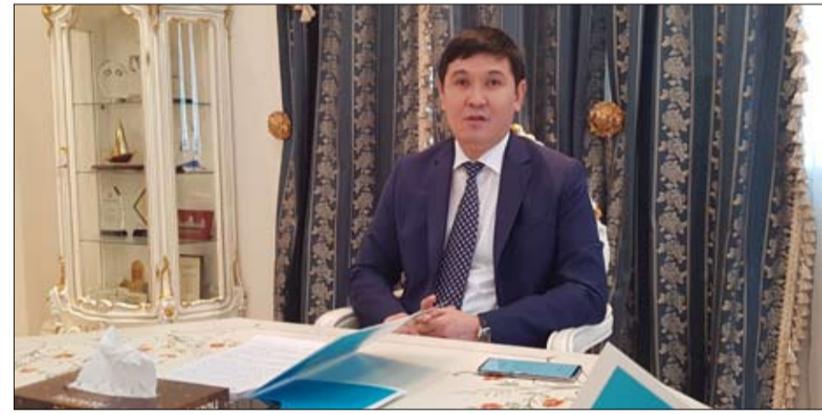
سفير كازاخستان لدى الدولة (أرشيفية)

إلى الرؤى الحكيمة لقيادتي البلدين ممثلة في صاحب السمو الشيخ خليفة بن زايد آل نهيان رئيس الدولة «حفظه الله» وصاحب السمو الشيخ محمد بن راشد آل مكتوم نائب رئيس الدولة رئيس مجلس الوزراء حاكم دبي «رعاه الله» وصاحب السمو الشيخ محمد بن زايد آل نهيان ولي عهد أبوظبي نائب القائد الأعلى للقوات المسلحة وقخامة نور سلطان نزارباييف الرئيس الأول والمؤسس لجمهورية كازاخستان والرئيس الحالي لكازاخستان قاسم جومارت توكاييف. مشيراً إلى لوكالة أنباء الإمارات (وام) بمناسبة الذكرى التاسعة والعشرين لاستقلال بلاده أسباب النهضة والتقدم التي تشهدها الإمارات وكازاخستان حالياً