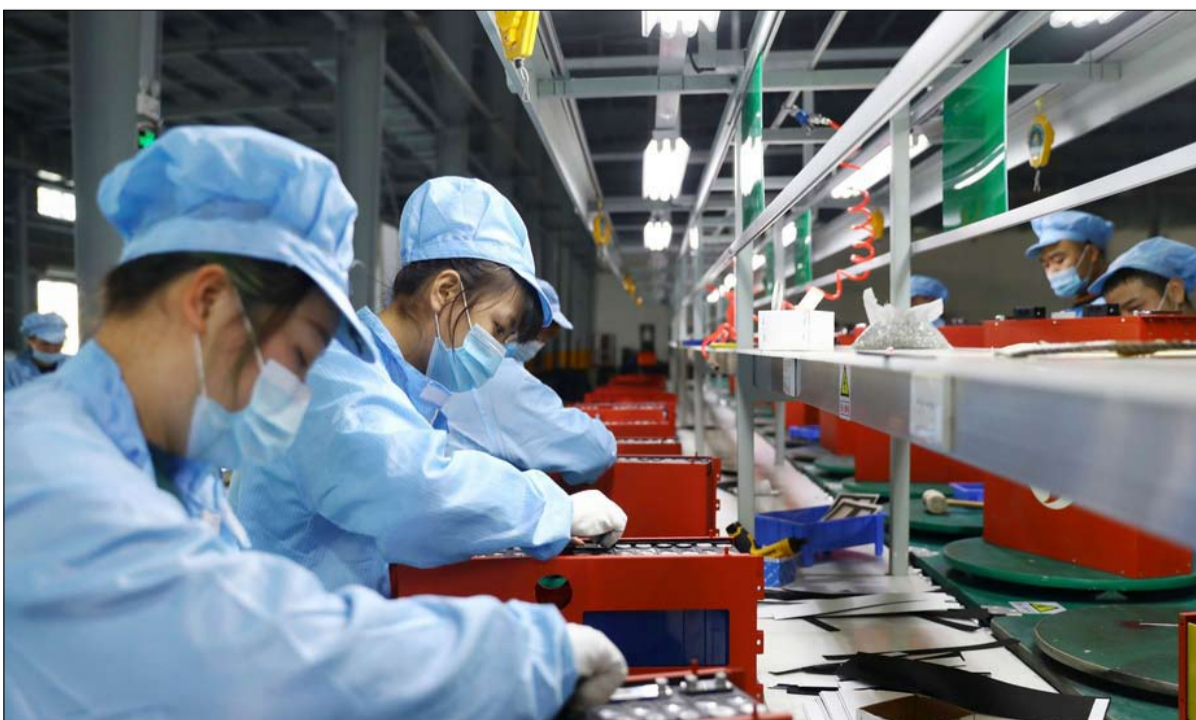
نحو التفوق التكنولوجي والاقتصادي

في "مسيرتها الطويلة" نحو الصدارة، من غير المرجح أن ينطلق الصينيون في أي مغامرات عسكرية خارجية