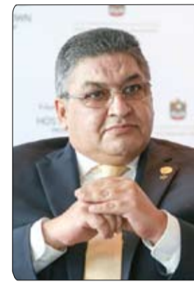
وتأتي إقامة هذه الدورات التدريبية على المنصة الافتراضية بسبب جائحة كورونا التي أوقفت جميع الأنشطة الرياضية في العالم ، إلا أن الأولمبياد الخاص الدولي واصل دوراته التدريبية ، خاصة وأنه مقبل على حدثين كبيرين الأول الأولمبياد العالمية الشتوية بقازان الروسية