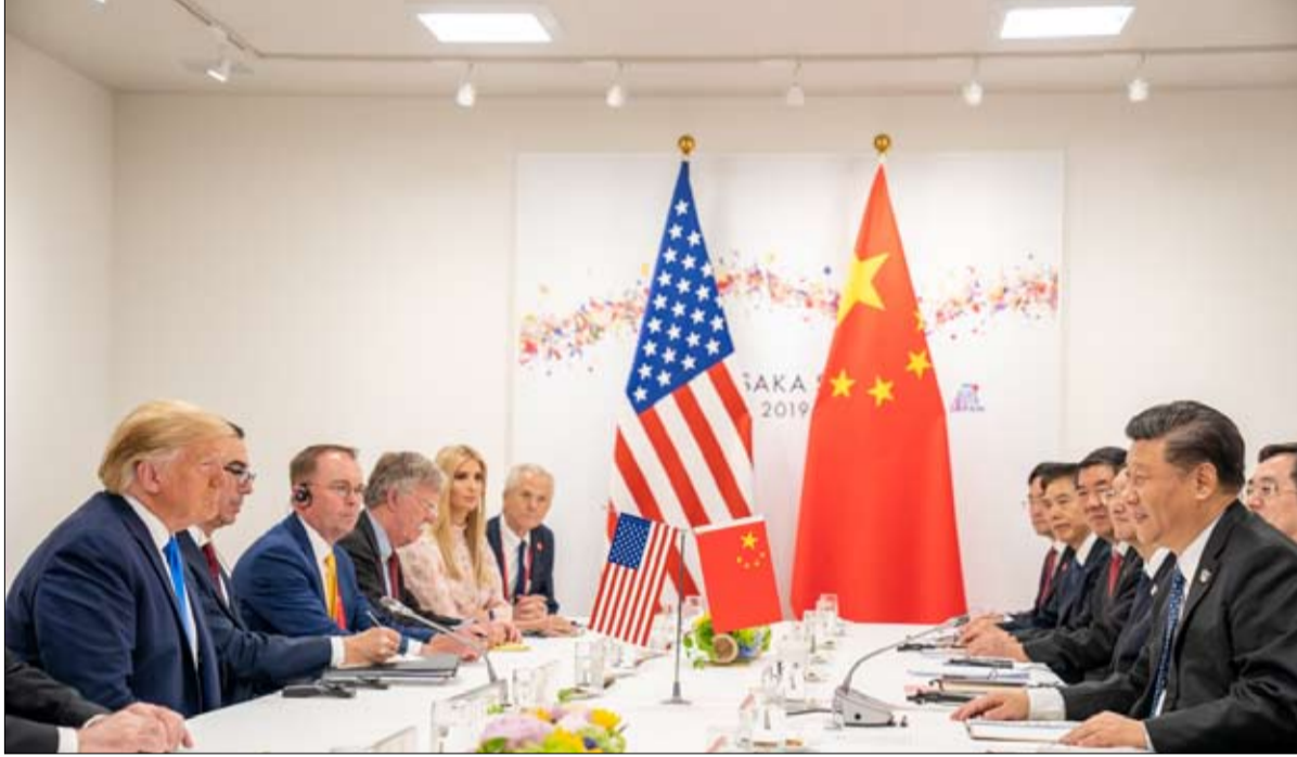
الصراع من أجل الزعامة العالمية