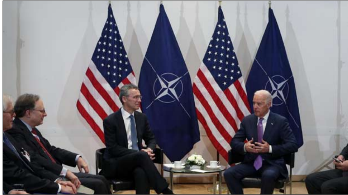
الصين... التحدي الكبير لبايدن

وبغض النظر عن ارتباط الدول بالتجارة الدولية، كمصدر للثروة، فإن هذا النهج الصيني سيعمّم بشكل متزايد المواقف القومية. في "مسيرتها الطويلة" باتجاه المرتبة الأولى، من غير المرجح أن ينطلق الصينيون في أي مغامرات عسكرية أجنبية؛ لقد استوعبوا دروس 70 عاماً من الجمهورية الإمبراطورية. فمع حربين مجانبتين في أفغانستان والعراق، تسببت الولايات المتحدة