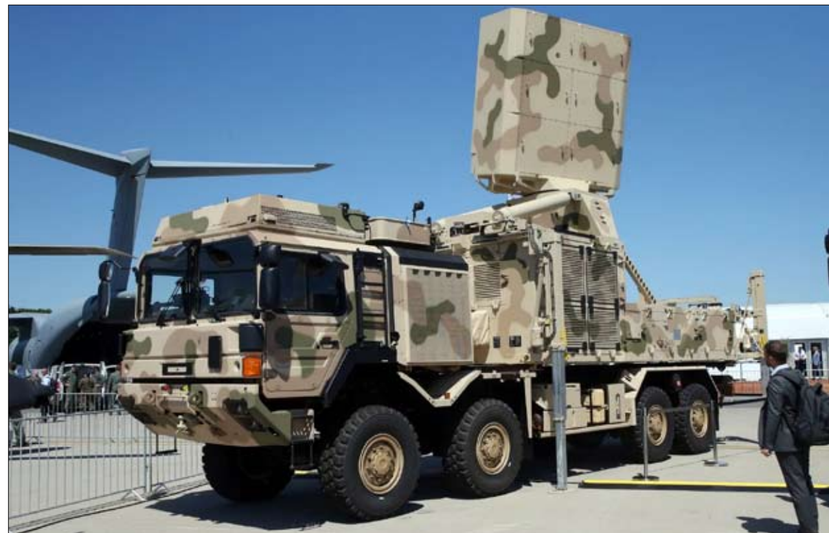
الأزمة الأوكرانية تختلف عن الأزمة الكوبية

كان بوتين قلقاً من خطر انضمام أوكرانيا إلى الناتو، وأبلغه مبعوثو بايدن أن ذلك لن يحدث إذا تراجع. كما عرضوا عليه حواراً مفتوحاً حول أي مخاوف أخرى قد تكون لدى بوتين بشأن التقارب المحتمل بين حكومة كييف والغرب. لذلك، هذا هو الفارق الأول بين كوبا عام 1962 وأوكرانيا عام 2022. كان خروتشوف يأمل في مخرج. فحالما اكتشفت الولايات المتحدة أنه ينصب صواريخ، أدرك أنه سيتعين عليه الاستسلام. في المقابل، يبدو من الواضح الآن، وبأثر رجعي، أن بوتين لم يكن مهتماً (ولا يزال غير مهتم) بالتراجع.