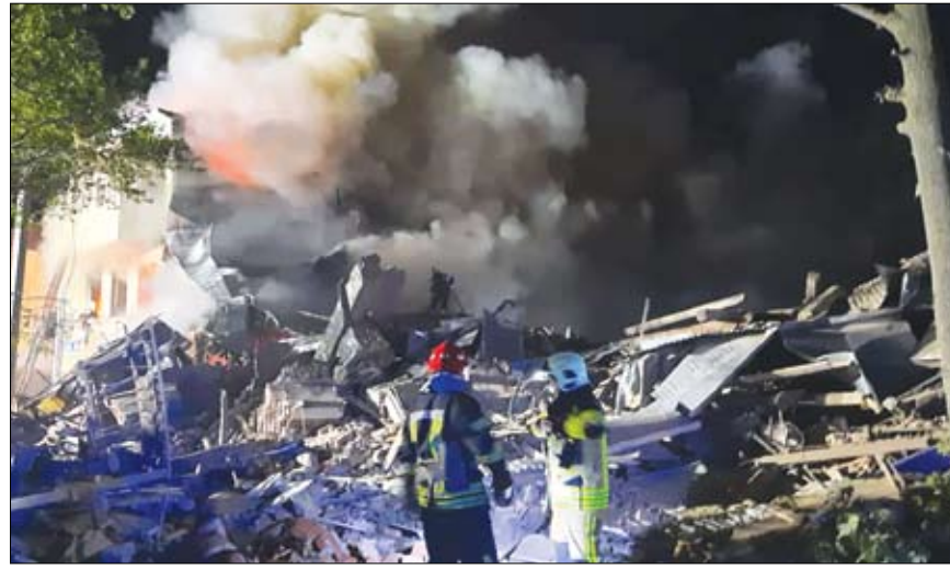
رجال إنقاذ أوكرانيون في أحد المواقع التي تعرضت للقصف أمس

وقال إيهور تيريكوف، رئيس بلدية خاركيف، إن الصواريخ أصابت منشأة صناعية في المدينة، مضيفاً أن رجال الإنقاذ لم يقيّموا حجم الأضرار بعد أو يتأكدوا من وقوع إصابات. من ناحية أخرى، قال أوليه سينيجويوف حاكم منطقة خاركيف، إن خمسة أشخاص أصيبوا، وتم توفير المعلومات