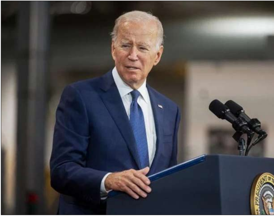
بايدن ومفردات تفادي الكارثة

لكل هذا، فإن احتمال وجود مخرج يبدو غير مرجح... ان الدروس المستفادة من أزمة الصواريخ تناسب بشكل أفضل زعيماً روسيا يفهم خطأه ويريد السلام.