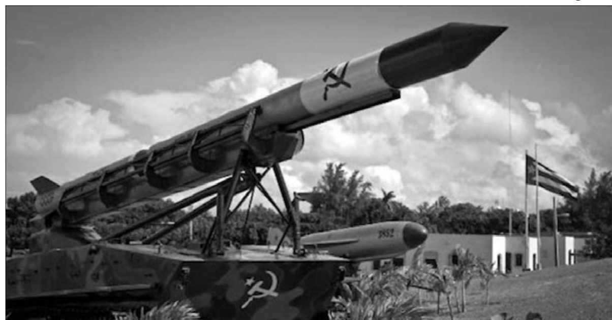
صواريخ سوفياتية في سيوداد ليبيرتا، مارياناو هاغانا