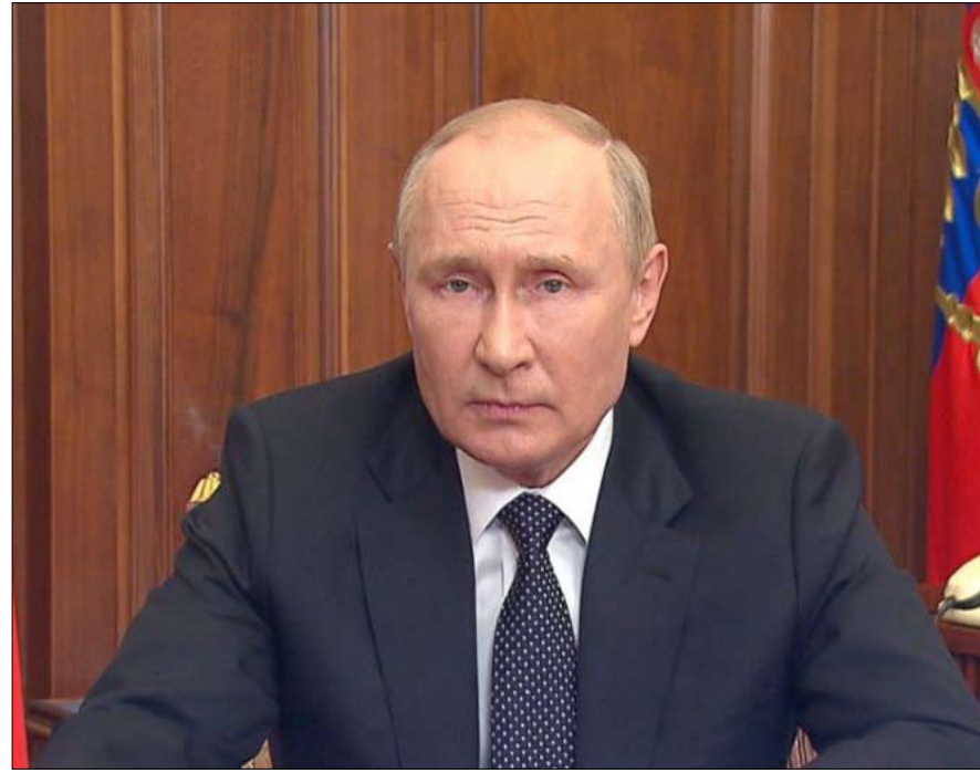
هل من مخرج لبوتين؟