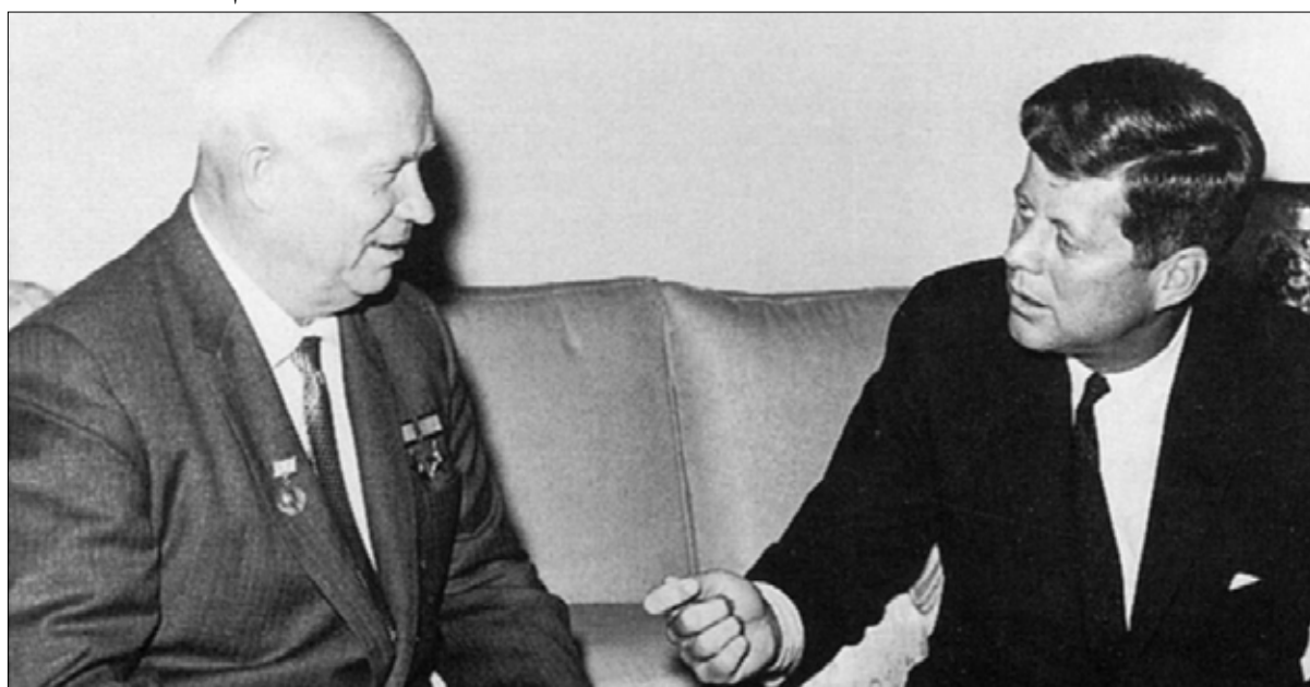
لقاء بين جون كينيدي ونيكيتا خروتشوف، 3 يونيو 1961 في فيينا