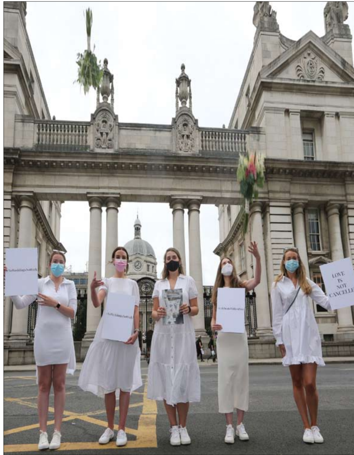
خمسة نساء يشاركن في مسيرة احتجاجية أمام المباني الحكومية في محاولة للسماح لما يصل إلى 100 ضيف بحضور حفلات الزفاف هذا العام في دبلن، أيرلندا.

وأضاف الدكتور وو: "تؤكد نتائجنا على أهمية الحفاظ على صحة الفم الجيدة ودورها في المساعدة في الحفاظ على الوظيفة الإدراكية".