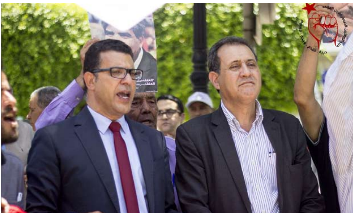
الوطن يرفض الوجود الامريكى بتونس