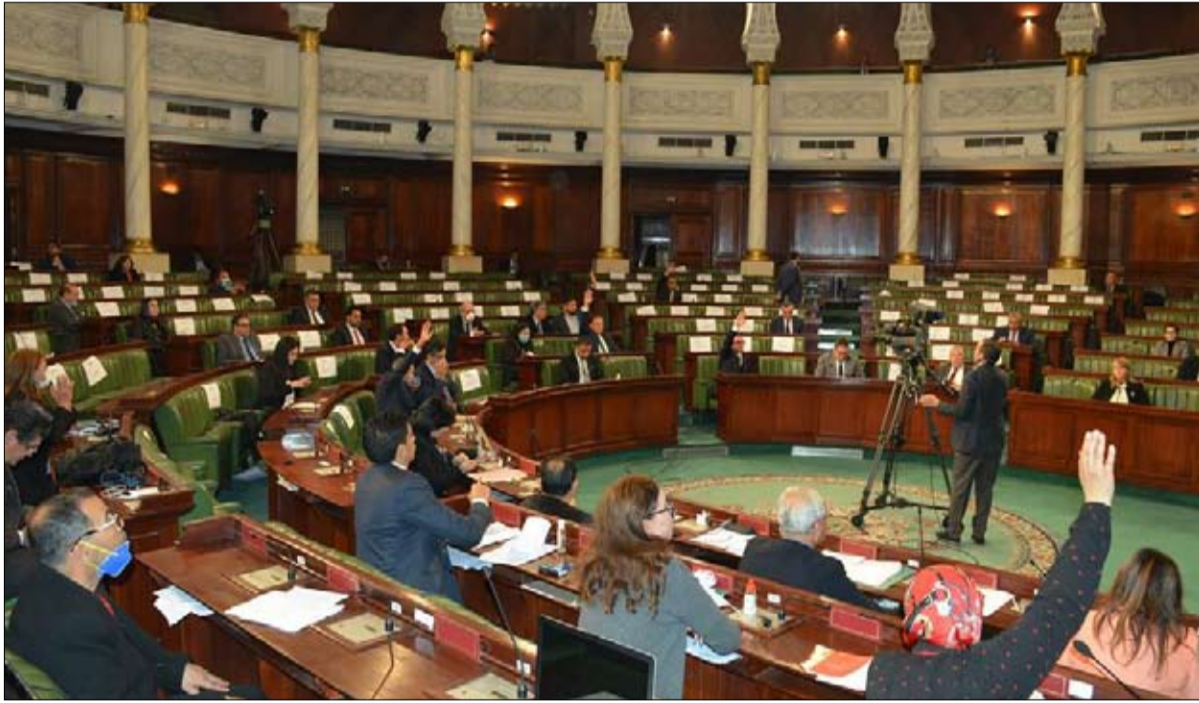
البرلمان.. جلسة ساخنة الاربعاء

وحزب العمال وحركة تونس الى الامام والحزب الاشتراكي والحزب الوطني الديمقراطي الاشتراكي وحزب القطب وحركة البحث) في 20 مايو بيانا مشتركا عبرت فيه عن "ادانتها" لتلاصق الهاتفي، الذي اجراه قبل يوم (19 مايو)، رئيس مجلس نواب الشعب، راشد الغنوشي، مع رئيس المجلس الرئاسي لحكومة الوفاق الليبية، فاضل السراج، معتبرة ذلك "تجاوزا لمؤسسات الدولة وتوريطا لها في النزاع الليبي الى جانب جماعة الإخوان المسلمين وحلفائها.