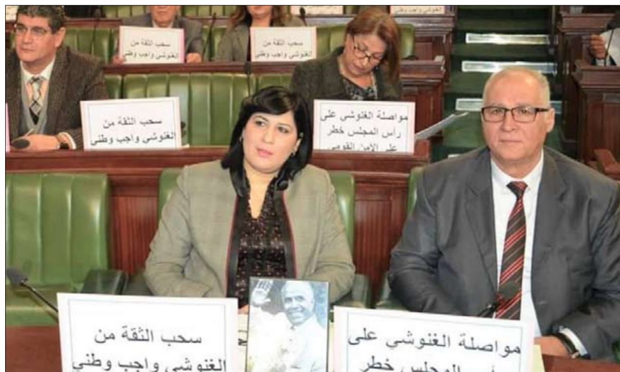
الدستوري الحر في مواجهة مفتوحة مع الغنوشي