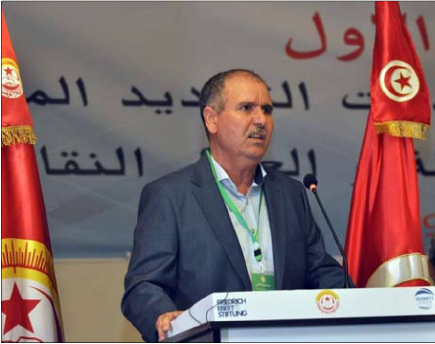
اتحاد الشغل لا للتدخل الاجنبي في ليبيا