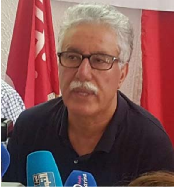
حزب العمال يرفض ويدين

حزب العمال: نرفض أي وجود عسكري أمريكي بتونس