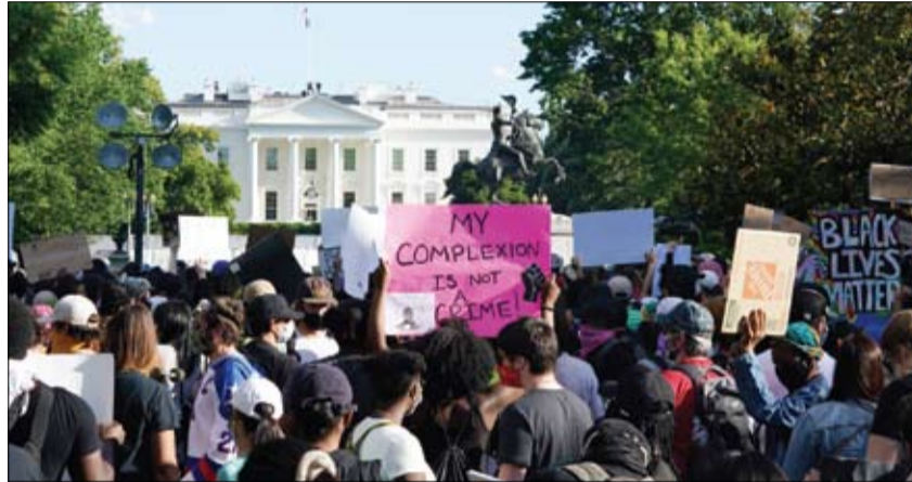
أمريكيون يتظاهرون أمام البيت الأبيض احتجاجا على قتل الشرطة لشاب أسود في حادث عنصري (ا ف ب)

صرح المتحدث الرسمي باسم قوات تحالف دعم الشرعية في اليمن العقيد الركن تركي المالكي، أن قوات التحالف تمكنت من اعتراض وإسقاط طائرتين بدون طيار (مسيرة) أطلقتها الميليشيا الحوثية الإرهابية المدعومة من إيران باتجاه الأعيان المدنية بمدينة (خميس مشيط). وكان المتحدث الرسمي باسم قوات التحالف تحالف دعم الشرعية في اليمن العقيد الركن تركي المالكي، أعلن في 27 من الشهر الماضي أن قوات التحالف تمكنت، من اعتراض وإسقاط طائرتين بدون طيار (مسيرة) أطلقتها الميليشيات الحوثية الإرهابية المدعومة من إيران باتجاه الأعيان المدنية بمدينة نجران. وأوضح العقيد المالكي استمرار الميليشيات الحوثية بانتهاك القانون الدولي الإنساني بإطلاق الطائرات بدون طيار واستهدافها للتعهد للمدنيين وكذلك التجمعات السكانية.