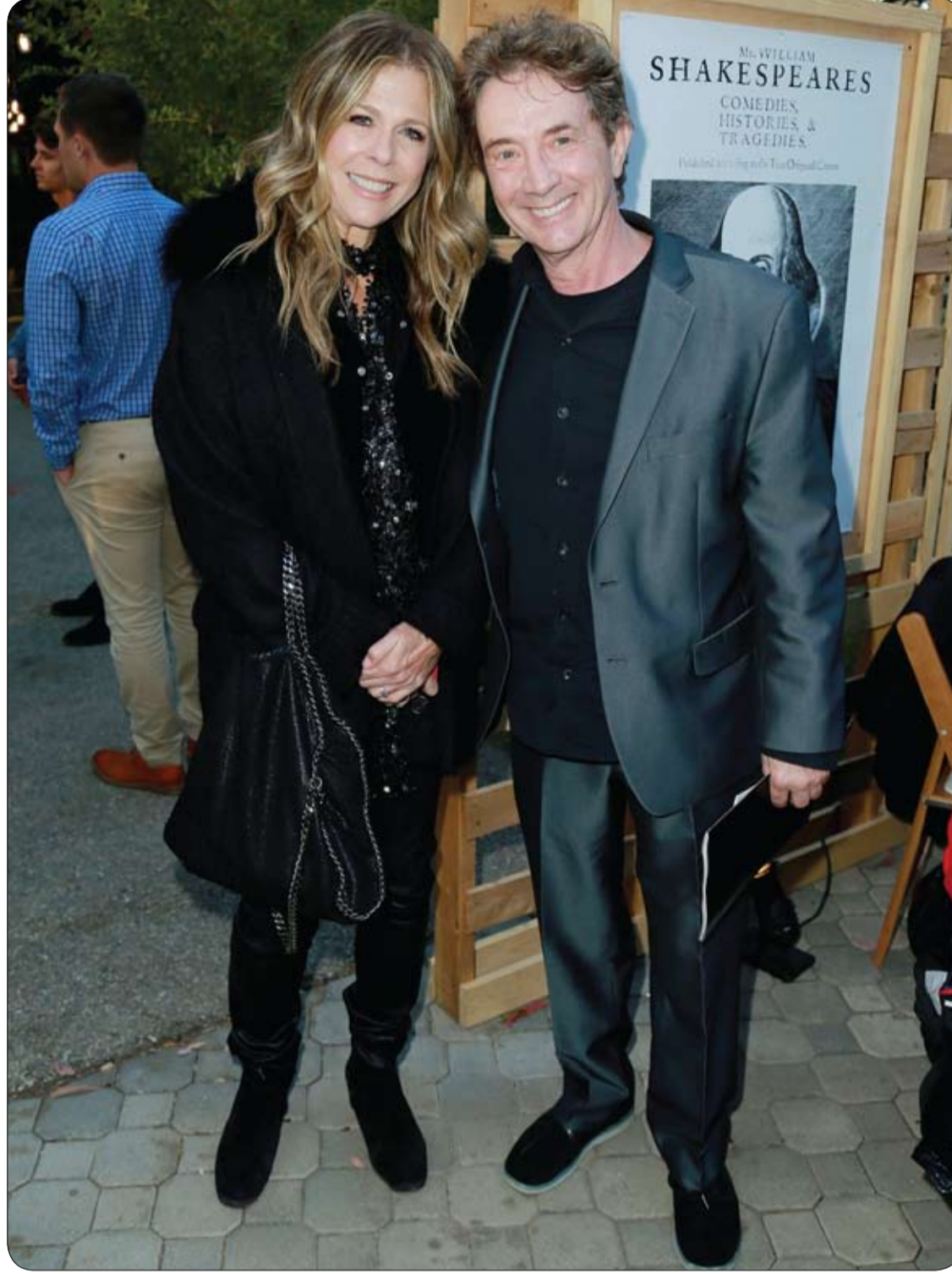
الممثلان ريتا ويلسون ومارتن شورث يحضران احتفال ليلة الافتتاح لمسرحية هنري الرابع لشكسبير في لوس أنجلوس.

توصلت دراسة طبية أجريت مؤخراً إلى أن الجري وكثرة الحركة مفيدة للأم الحامل ولجنينها، مشيرة إلى أن الفكرة القديمة الرائجة بأن الحركة الكثيرة تؤثر سلباً على الجنين غير صحيحة. وقالت الدراسة التي أجريت في بريطانيا، وفقاً لسكاي نيوز: إن الجري أثناء الحمل آمن على صحة الأم وجنينها. وبحسب أطباء وباحثين من كلية "كينجز كوليدج" في لندن، فإن الحمل لا يتأثر بممارسة الرياضات الخفيفة والجري المعتدل، كما أنه ينعكس إيجاباً على عملية الوضع. وذكرت صحيفة "ديلي ميل" البريطانية، أن الباحثين شخّصوا 6 عوامل يحترقن رياضة الجري، ووجدوا أن ممارسة الرياضة بانتظام قبل وأثناء الحمل قللت من مخاطر الولادة المبكرة، أو انخفاض وزن المولود. كما حدثت من التعب وآلام أسفل الظهر، وعروق السدوالي، وتورم الكاحلين. ويرى باحثون، أن الرياضات الفيدة للحوامل هي اليوجا، والهرولة يومياً لمدة 30 دقيقة، والسباحة. بينما يحذّر آخرون من ممارسة رياضة الوثب، والرياضات الجماعية، والقتالية ككرة السلة والكراتيه والتزلج والغطس؛ لأنها قد تؤدي لإجهاد عضلة القلب والرئتين للحامل ولجنينها، مما يهدد صحتها معاً. وكانت إحصائيات طبية حديثة أشارت، إلى أن ثلث الحوامل غير متأكدات من مدى سلامة ممارسة الأنشطة الرياضية أثناء الحمل، خاصة مع اختلاف الحالة الطبية لكل واحدة منهن.