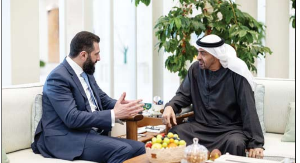
رئيس الدولة خلال مباحثاته مع الرئيس السوري