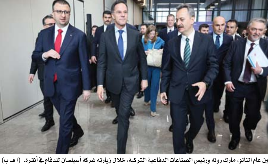
أمين عام الناتو، مارك روتة ورئيس الصناعات الدفاعية التركية، خلال زيارته شركة أسيلسان للدفاع في أنقرة.

أنقرة - أ ف ب: أكد الأمين العام لحلف شمال الأطلسي مارك روتة الأربعاء في أنقرة، أن الحلف سيقوم دائماً بما يلزم للدفاع عن تركيا، الدولة العضو التي استهدفت بأربعة صواريخ إيرانية خلال الشهر الماضي. وقال روتة إن إيران تثبت العرق والفوضى، ويظهر تأثير ذلك بشكل كبير في تركيا. خلال الأسابيع الأخيرة، نجح الناتو في اعتراض أربعة صواريخ قطع الدفاع التركي.