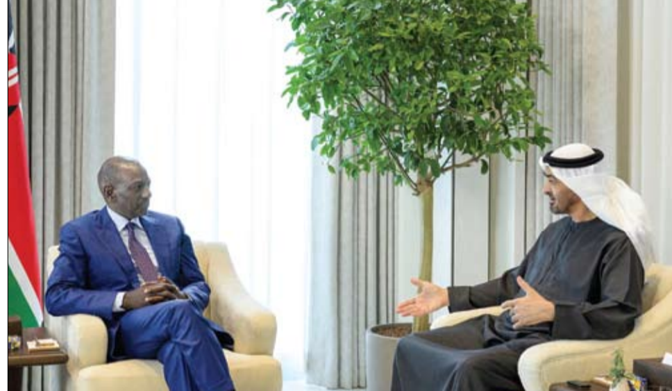
رئيس الدولة خلال مباحثاته مع رئيس كينيا

رئيس الدولة يتلقى اتصالاً هاتفياً من إيلون ماسك أبو ظبي - وام: تلقى صاحب السمو الشيخ محمد بن زايد آل نهيان رئيس الدولة حفظه الله، اتصالاً هاتفياً، من إيلون ماسك رائد الأعمال الأمريكي، بحثاً خلاله المستجدات في مجالات التكنولوجيا المتقدمة والذكاء الاصطناعي والفضاء، بجانب الفرص الواعدة التي تتيحها هذه القطاعات الحيوية ودورها في دعم مسيرة التنمية المستدامة وتحسين جودة الحياة. كما تطرق الاتصال إلى أهمية تسريع تبني الحلول المبتكرة وتعزيز الشراكات العالمية في مجالات الابتكار والتقنيات المستقبلية، إضافة إلى توسيع آفاق التعاون الدولي وتبادل الخبرات في تطوير الحلول التقنية المتقدمة، بما يعزز القدرة على مواكبة التحولات العالمية والاستفادة من الفرص التي تتيحها التقنيات الحديثة. من جانبه أشاد إيلون ماسك، بنهج دولة الإمارات وشراكتها الدولية الناجحة في مجال الاستثمار في الذكاء الاصطناعي، معرباً عن تمنياته للدولة مواصلة مسيرة التقدم والازدهار.