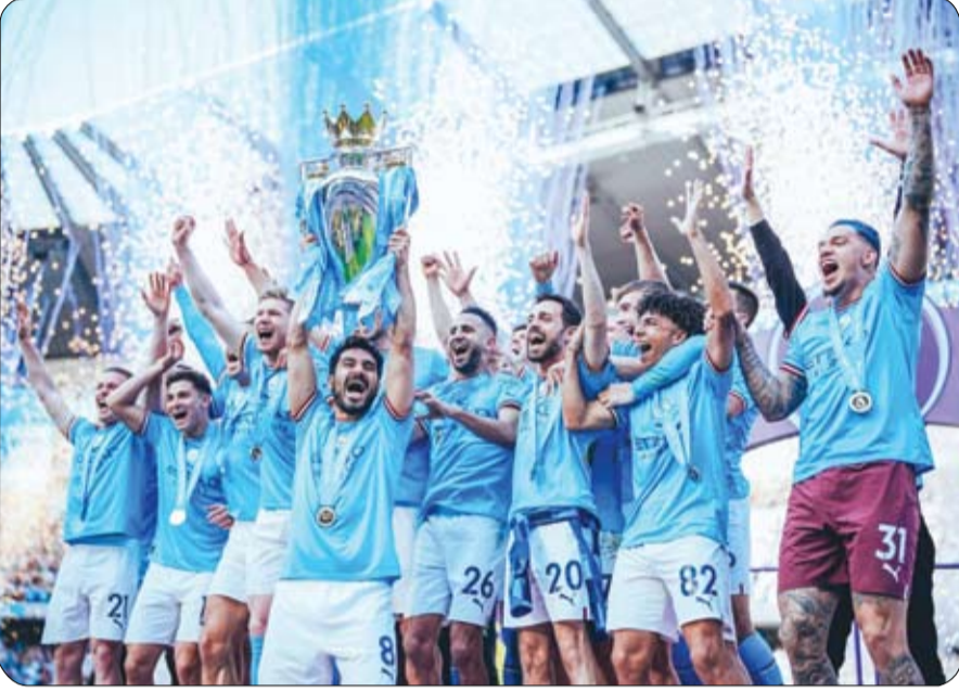
الأعلى قيمة بين أندية كرة القدم وأضاف: لا يقتصر هذا الإنجاز وحطم الأرقام القياسية داخل على مستوى العالم، قصة النجاح على تطور العلامة التجارية، وإنما يدل على ما حققه النادي والتطور التي شهدتها مانشستر سيتي على مدار السنوات الأخيرة. إجمالاً، كان أداء النادي متمسكاً بالاستدامة المالية.