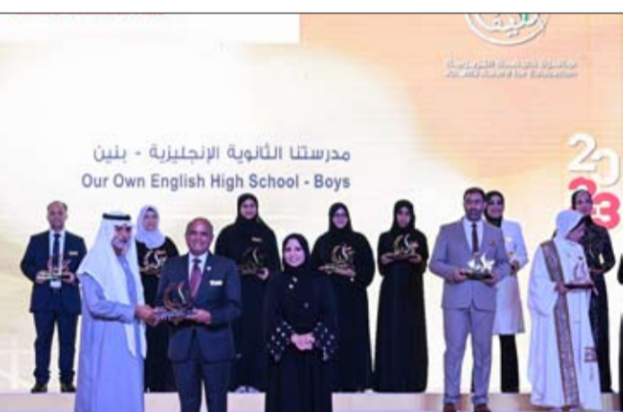
مدرستنا الثانوية الإنجليزية - بلين Our Own English High School - Boys