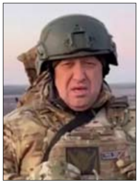
•• كيف-أ ف ب

وصف رئيس مجموعة فاغنر المسلحة يفغيني بريغوجين حصيلة الخسائر الأوكرانية التي أعلنتها روسيا بعد تأكيدها صد هجومين كبيرين في يومين، بأنها "تخيلات". وقال بريغوجين على تلغرام "إنها مجرد تخيلات". وأكدت وزارة الدفاع الروسية أنها صدت هجومين أوكرانيين واسعي النطاق الأحد والاثنين في جنوب منطقة دونباس وقتلت أكثر من 1500 جندي أوكراني ودمرت 28 دبابة. من جهتها، لم تقدم الحكومة الأوكرانية التي أعلنت