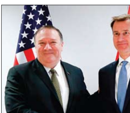
وزيرا خارجية أمريكا وبريطانيا في بروكسل

•• بروكسل-رويترز: قال وزير الخارجية البريطاني جيريمي هنت أمس إن إيران والولايات المتحدة قد تشعلان دون قصد صراعا في منطقة مضطربة بالفعل داعيا إلى فترة هدوء وذلك قبيل محادثات بين الاتحاد الأوروبي ووزير الخارجية الأمريكي مايك بومبيو. ويسعى الرئيس الأمريكي دونالد ترامب إلى عزل طهران بوقف صادراتها النفطية بعد الانسحاب من اتفاق نووي أبرم عام 2015 بهدف الحد من برنامج إيران النووي، وأرسل ترامب كذلك طائرات حربية أمريكية وحاملة طائرات إلى الشرق الأوسط. وقال وزير الخارجية البريطاني جيريمي هنت إن بريطانيا ستدعم أي إجراء أمريكي يهدف إلى الحد من برنامج إيران النووي، واستئناف النشاط النووي، داعيا إلى فترة هدوء كي يفهم الجميع أن الجانب الآخر يفكر. وذكر دبلوماسيون أن التوقيت والتفاصيل المحددة للاجتماع بومبيو لا تزال غير واضحة. وأرسل ترامب حاملة طائرات وقاذفات بي 52- إلى الشرق الأوسط في استعراض للقوة في مواجهة تهديدات للقوات الأمريكية في المنطقة. ورفضت بريطانيا وفرنسا وألمانيا، الدول الأوروبية الموقعة على الاتفاق النووي، الانسحاب من الاتفاق. وقالت وزارة الخارجية الأمريكية في بيان إن بومبيو أفشى توقفا مفرزا في موسكو ليذهب بدلا من ذلك إلى بروكسل، للبحث الأفعال والتصريحات الأخيرة التي تنطوي على تهديد، من جانب إيران.