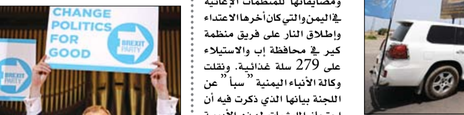
نايجل فرج عودة تترك الجميع

•• كوالالمبور-أ ف ب: أعلنت الشرطة الماليزية أمس الاثنين توقيف أربعة أشخاص يعتقد أنهم على ارتباط بتنظيم داعش الإرهابي كات بحوزتهم متفجرات وخططوا لهجوم أمان كيانهم لغير المسلمين. واعتقل المشتبه بهم وهم ماليزي قاد المجموعة وشخصان من أقلية الروهينغا البورمية واندونيسي في عمليات مهم جرت الأسبوع الماضي في محيط كوالالمبور وإقليم ترغانو. ووصفهم قائد الشرطة الماليزية عبد الحميد بدور بأنهم خلية من تنظيم داعش. وقال إنهم كانوا يخططون لاغتيال شخصيات عالية المستوى ومهاجمة أماكن عبادة هندوسية ومسيحية وبوذية في ماليزيا.