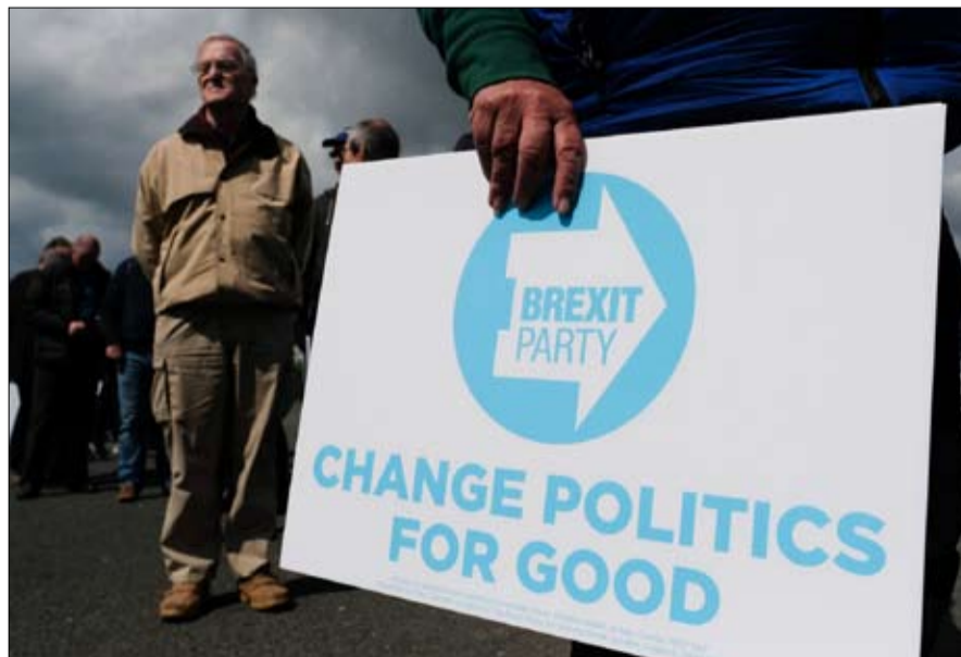
حزب البريكسيت الجديد.. اقبال كبير وفوز يتشكل

بالمنة من نوايا التصويت في الانتخابات الأوروبية، يتجاوز حزب العمال البريطاني 21 بالمئة، وحزب المحافظين 11 بالمئة "مجتمعين". والأكثر إثارة للقلق بالنسبة لتيريزا ماي وجيريمي كوربين، ما جاء في استطلاع آخر، كوم ريس، نُشر في سنداى تلغراف، لا يزال حزب البريكسيت "20 بالمئة" يتجاوز حزب المحافظين "19 بالمئة" الذي تدرج إلى المركز الثالث في حال إجراء انتخابات عامة. وسيحصل حزب العمال