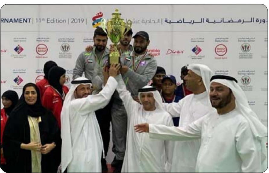
ورة الرمضانية الرياضية | الخلية عتمة | 11th Edition | 2019 |

عبر البطل كيفين رايتير عن سعادة كبيرة بتحقيق النصر الكبير لمؤسسة الفيلكتوري تيم وقال: "هذه بداية الموسم فقط ومازال أمامنا العديد من حوله الأول في السباق الثالث والنهائي. حيث أسفر هذا الفوز العظيم عن 4 ذهبيات خلال أولى جولات بطولة العالم للدراجات المائية. سيطر فريق الفيلكتوري على عرش الصدارة خلال جميع سباقات فئة محترفي واقف جي بي 1. ولم يتنازل أبداً عن صدارته، حيث تمركز البطل النمساوي كيفين رايتير متسابق الفيلكتوري تيم بالصدارة بعد تحقيقه المركز الأول في سباق أفضل زمن، والسباق الأول والثاني، وبعدها أكمل طريقه لعرض البطولة بعد