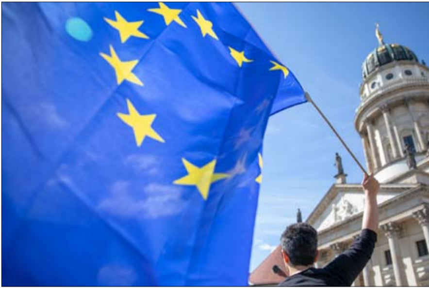
البريكسيت جرح بريطاني لم يندمل

بعد عقوبة الانتخابات المحلية الأخيرة، يدرك المحافظون والعمال أن النتائج الأوروبية قد تكون أسوأ