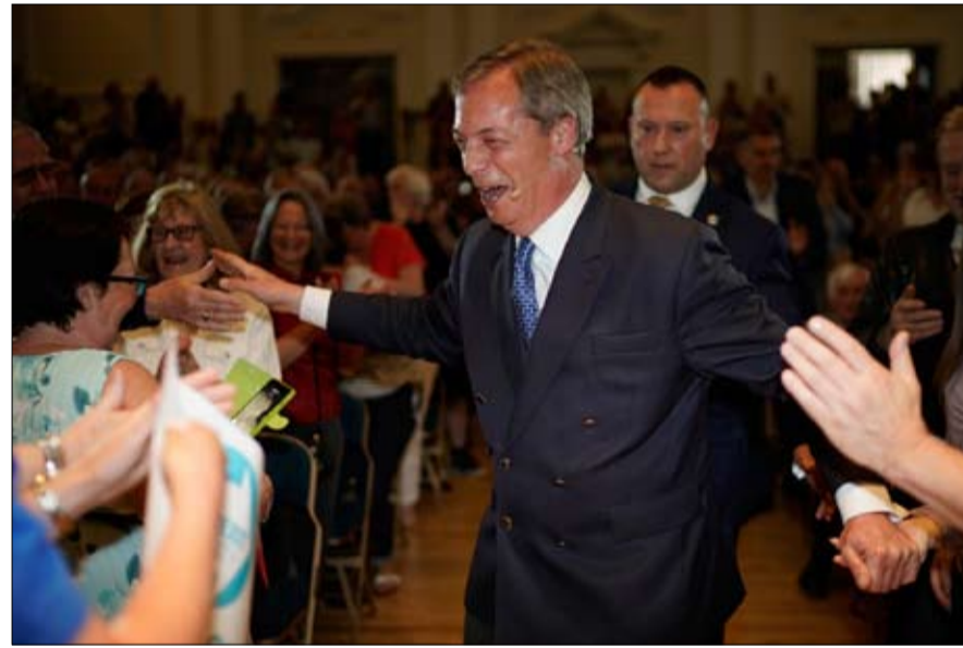
من اجل احداث زلزال انتخابي

فرج يدعو البريطانيين إلى إحداث زلزال انتخابي يوم 23 مايو