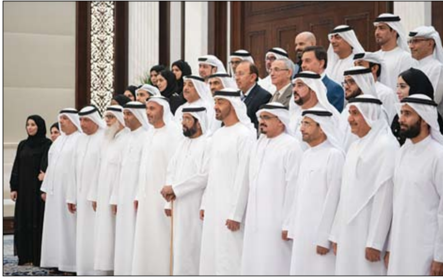
محمد بن زايد خلال استقباله وفدي وزارة الصحة ووقاية المجتمع ودائرة الصحة بأبوظبي (وام)

من جانبه أعرب صاحب السمو الشيخ محمد بن زايد آل نهيان عن تقديره لصاحب السمو الشيخ صباح الأحمد الجابر الصباح أمير دولة الكويت الشقيقة لما أبداه من مواقف أخوية تجاه دولة الإمارات وتضامن الكويت مع أشقائها إزاء ما تتعرض له المنطقة من تحديات وأمنها واستقرارها.