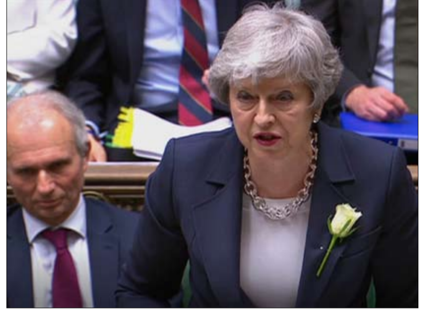
تيريزا ماي افق مظلم للمحافظين