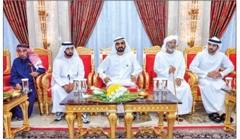
محمد بن راشد خلال استقباله جموع المهنيين بشهر رمضان

•• أبوظبي-وام: استقبل صاحب السمو الشيخ محمد بن زايد آل نهيان ولي عهد أبوظبي نائب القائد الأعلى للقوات المسلحة أمس في قصر الطينين وفدي وزارة الصحة ووقاية المجتمع ودائرة الصحة بأبوظبي المهنيين الذين قدموا التهنئة بحلول شهر رمضان المبارك. من جهة أخرى شهد صاحب السمو الشيخ محمد بن زايد آل نهيان ولي عهد أبوظبي نائب القائد الأعلى للقوات المسلحة بقصر سموه في الطينين أمس محاضرة بعنوان «علم الابتكار... قابلية التأقلم بشكل طبيعي» التي ألقاها الدكتور بو توتو. (التفاصيل ص 2)