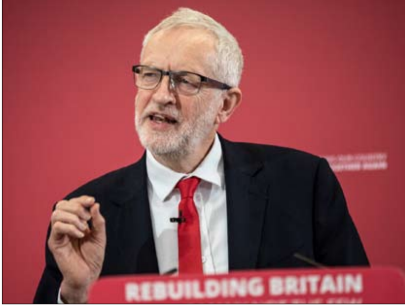
جيريمي كوربين الغموض سيد الموقف