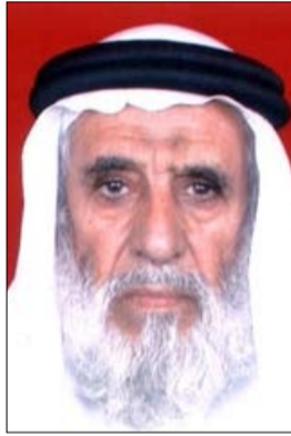
الشيخ مبارك بن قران بن راشد المنصور