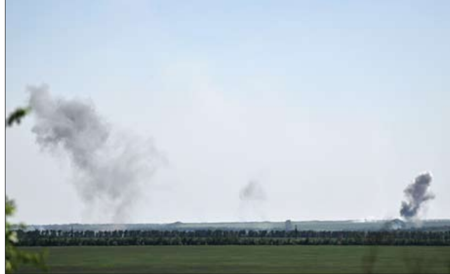
دخان يتصاعد بعد قصف منطقة أوشيريتين في منطقة دونيتسك، في أوكرانيا.

هجوم أوكراني بمسيرات على بيلغورود الروسية بوتين يأمر بالاستعداد لإجراء تدريبات على الأسلحة النووية موسكو - أف ب: قتل ستة أشخاص على الأقل وأصيب 35 آخرون صباح الاثنين في هجوم بطائرات مسيرة متفجرة في منطقة بيلغورود الروسية المحاذية لأوكرانيا والمستهدفة بانتظام بضربات من كييف، حسبما قال الحاكم فياتشيسلاف غلادكوف. وقال غلادكوف على تلفزيون هوجمت شاحتان صغيرتان كانتا تقلان موظفين نحو مكان عملهم وسيارة، من قبل الجيش الأوكراني بواسطة مسيرات انتحارية. وأضاف توب في ستة أشخاص وأصيب 35 شخصاً بينهم رجل في وضع صعب فيما الجرحى الآخرين أصيبوا بجروح خطيرة نوعاً ما بسبب الشظايا وتلقم مسعفون إلى مراكز طبية في المنطقة. نوه إلى أن طفلين يغانيان من جروح سطحية. وأشار إلى أن الهجوم حدث قرب قرية بيريزوفكا القريبة من الحدود الأوكرانية. إلى ذلك، أفادت وزارة الدفاع الروسية أمس الاثنين بأن الرئيس فلاديمير بوتين أوعز ببدء الاستعدادات لإجراء تدريبات