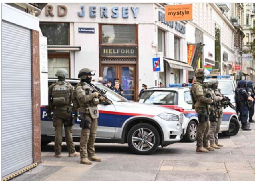
نقلت رويترز. وفي العالم العربي، أدان الأمين العام لمجلس التعاون لدول الخليج العربية، نايف الحجرف، الهجوم، معرباً عن "خالص تعازيه ومواساته لأهالي الضحايا والشعب النمساوي الصديق.."

النمساوي، وصفا فيها الهجوم بأنه "جريمة بشعة ومرعبة". من جانبه، شد الرئيس الأميركي دونالد ترامب على أنه "يجب على الهجمات الشريرة أن تتوقف"، مندداً بـ "العمل الإرهابي الشرير". وقال ترامب في تغريدة على تويتر: "نصلي من أجل سكان فيينا بعد عمل إرهابي شرير آخر في أوروبا. هذه الهجمات الشريرة ضد الأبرياء يجب أن تتوقف، وتابع: "الولايات المتحدة تقف إلى جانب النمسا وفرنسا وسائر أوروبا في الحرب ضد الإرهابيين، بمن فيهم الإرهابيون المتطرفون، ودان رئيس الوزراء الإسرائيلي بنيامين نتانياهو هجوم فيينا داعياً إلى توحيد الجهود لهزيمة الإرهاب، وقال في تغريدة على حسابه على تويتر "تدين إسرائيل الهجوم الوحشي في فيينا"، معرباً عن عن تضامنه مع النمسا بعد عمليات إطلاق النار التي وقعت مساء الاثنين في وسط العاصمة وأسفرت عن مقتل أربعة أشخاص. وأصدر الرئيس الفرنسي، إيمانويل ماكرون، الذي شهدت بلاده هجوماً دامين بسكين في باريس ونيس في الأسابيع الأخيرة، بياناً يعبر عن الصدمة والأسف. وقال "هذه أوروبا التي ننتمي إليها... لا بد أن يعرف أعداؤها مع من يتعاملون، لن نتراجع"، بحسب ما