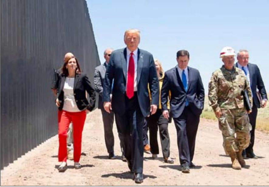
الجدار... وعد لم يتحقق

تصاعد التوتر بين البلدين وقصفت إيران بعشرات الصواريخ قواعد تضم جنوداً أمريكيين. بعد خمسة أيام من وفاة سليمان، أسقطت إيران طائرة من طراز بوينغ الدولية التابعة للخطوط الجوية الأوكرانية وعلى متنها 176 شخصاً.