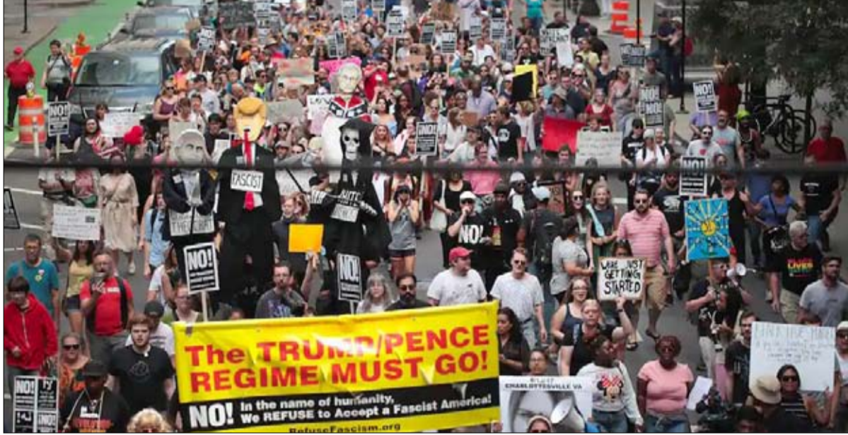
صمت امام العنصرية