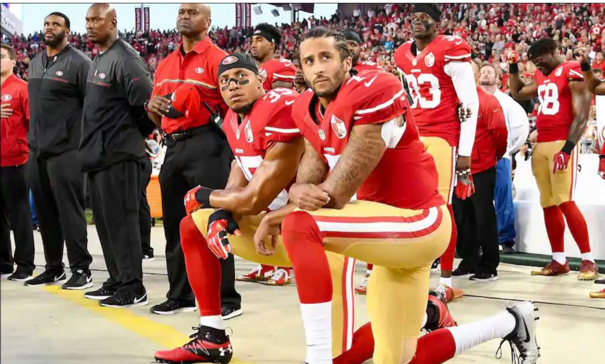
حركة لم يهضمها ترامب