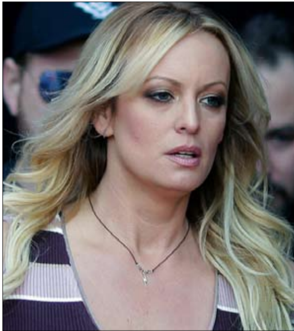
فضيحة ستورمي دانييلز

الولايات المتحدة والمكسيك وكندا. واحتفل الرئيس بالتوقيع واصفا إياها بأنها "الأهم في تاريخ الولايات المتحدة.