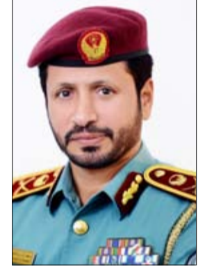
الريادية كنموذج يحتذى ورمز لقيم الإنسانية والخير والعطاء. وأضاف إننا نشعر بالفخر والاعتزاز

قال سعادة اللواء سيف الزري الشامسي قائد عام شرطة الشارقة إننا نحتفل اليوم بمناسبة وطنية عزيزة على قلوبنا جميعاً وهي يوم العلم والذي نعبر فيه عن فخرنا واعتزازنا بما حققته دولتنا من إنجازات في شتى المجالات ونؤكد فيه التزامنا بالعمل والسير على نهج قيادتنا الرشيدة لرد جزء من الجميل من خلال تمسكنا بهويتنا الوطنية وتجسد فيه العزم على مواصلة مسيرة البناء ليبقى علم دولتنا عالياً فخافاً يعكس مكانتها