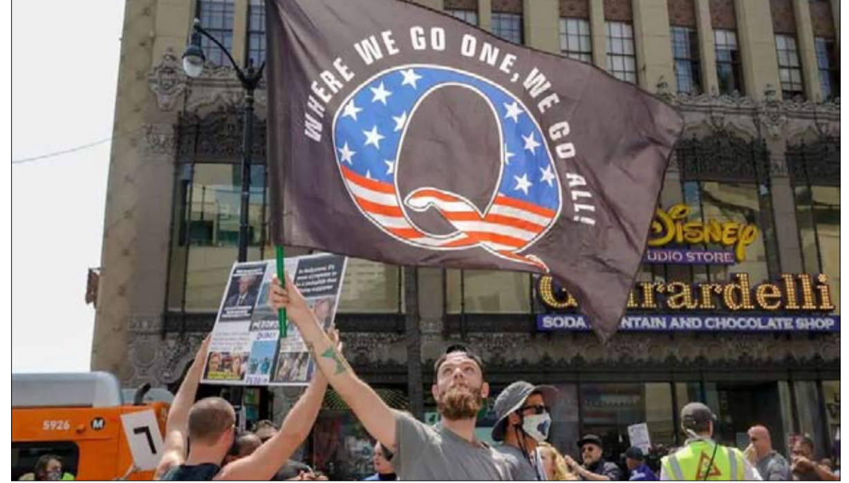
اتباع الحركة انصار ترامب