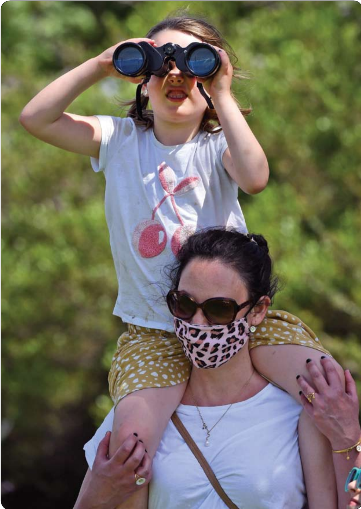
أم وطفلتها تشاهدان من بعيد سباق الخيل في كأس ملبورن المقام دون جماهيرهما تتنزهان في حديقة تطل على

يوفر فندق أمريكي تجربة فريدة من نوعها للزوار من خلال جناح يحتوي على غرفة سرية مخفية خلف مجموعة من رفوف الكتب. ويمكن العثور على فندق Bella Vista Bed and Breakfast Inn في ولاية كاليفورنيا، وتحيط به مزارع الكروم المنهلة، ويعد وجهة مثالية للراغبين بقضاء شهر العسل وإقامة حفلات الزفاف. ويبرز أحد أجنحة الفندق بفضل ميزة غريبة، حيث يتحوي جناح Monte Vista على مكتبة تضم العديد من الرفوف، وسيكتشف الضيوف العاشقين للقراءة أن أحد الكتب لا يحتوي على صفحات يمكن قراءتها، بل على مقبض باب ذهبي بدلاً من ذلك. وبعد أن تعثر على الكتاب الحاوي على المقبض، ستمكن من فتح خزانة الكتب، لتكشف عن درج يتجه للأسفل إلى غرفة قراءة سرية، مع خزنة كتب ممتدة من الأرض إلى السقف، وكرسي بذراعين لتسترخي وأنت تقرأ كتابك المفضلة، وناذرة ضخمة للاستمتاع بالمناظر الخلابة. وتمت مشاركة الجوهرة المخفية بواسطة مدونة السفر واللياقة البدنية Zanna van Dijk على تطبيق تيك توك، حيث شاركت مقطع فيديو مع توضيح قالت فيه "يحتوي هذا الفندق على أزوع غرفة مخبأة خلف خزنة كتب". يذكر أن أسعار الغرف في الفندق تبدأ من 200 دولار، مع ديكور مستوحى من هوليوود، والعديد من صور النجوم، وكل غرفة تأتي مصممة بمفهوم فيلم مختلف عن الأخرى، بحسب صحيفة ميرور البريطانية.