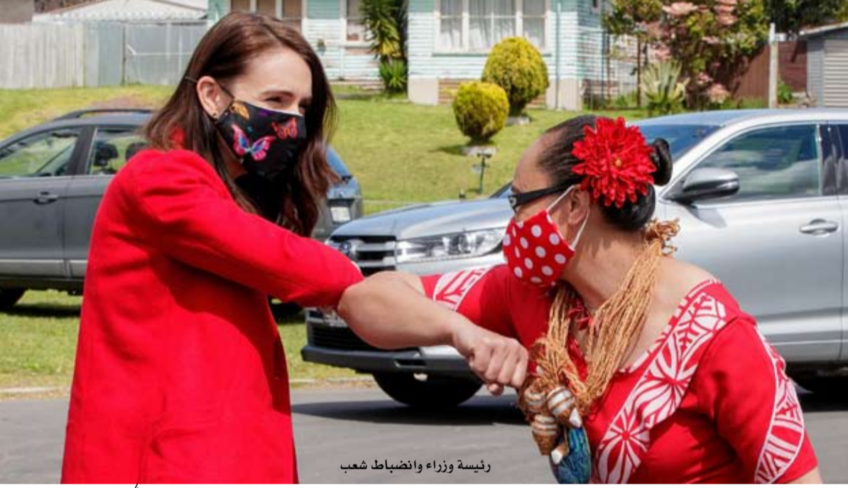
رئيسة وزراء وانضباط شعب