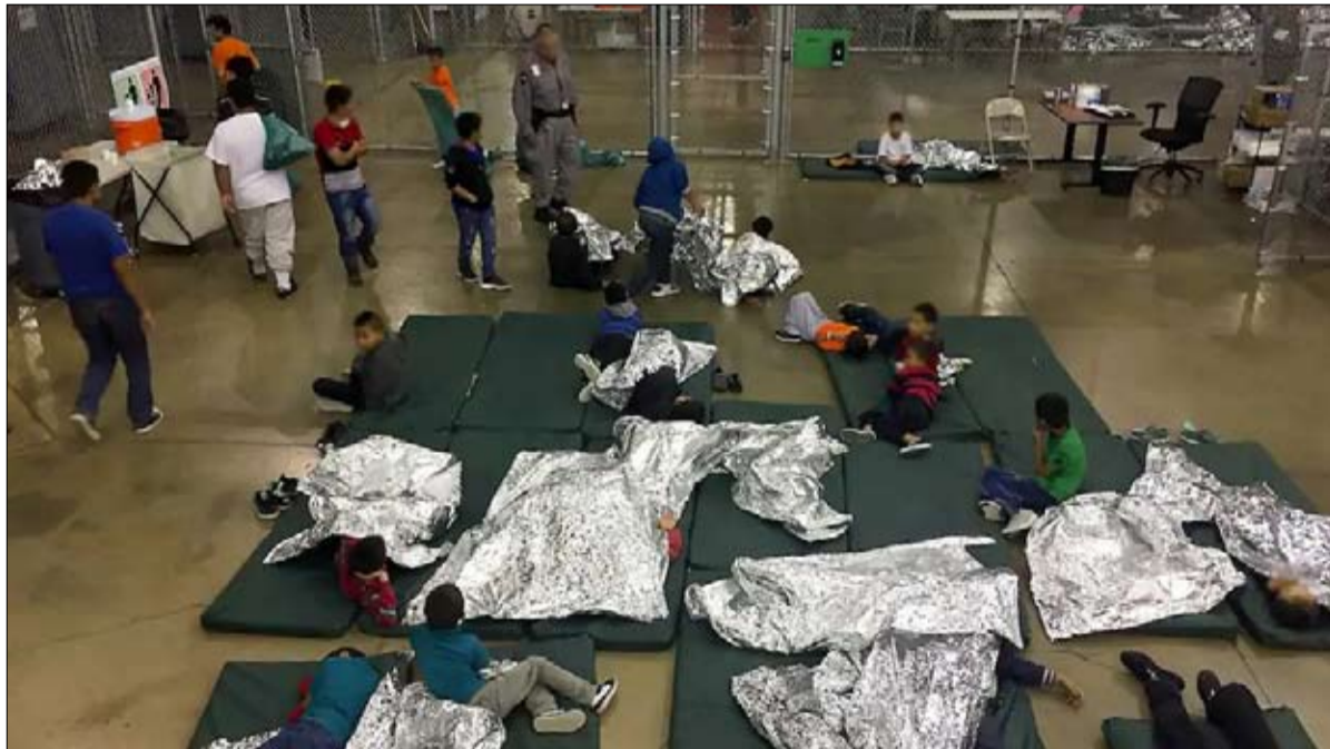
نتائج كارثية لقانون الهجرة

بعد أن وصفها في كثير من الأحيان بأنها "كارثة"، ووعد بـ "تمزيق" اتفاق التجارة مع كندا والمكسيك، فاز دونالد ترامب برهانه من خلال التوقيع على صفقة جديدة. وفسحت اتفاقية التجارة الحرة لأمريكا الشمالية الطريق لاتفاقية