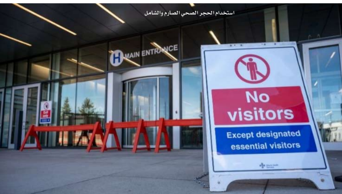
استخدام الحجر الصحي الصارم والشامل

بينما تغرق أوروبا في الموجة الثانية، تسجل نيوزيلندا نتائج تحسدها عليها أي دولة في القارة العجوز وتدفعها للخجل، 25 قتيلًا و6 حالات فقط من كوفيد-19 لا تزال نشطة مقابل 5 ملايين من السكان.