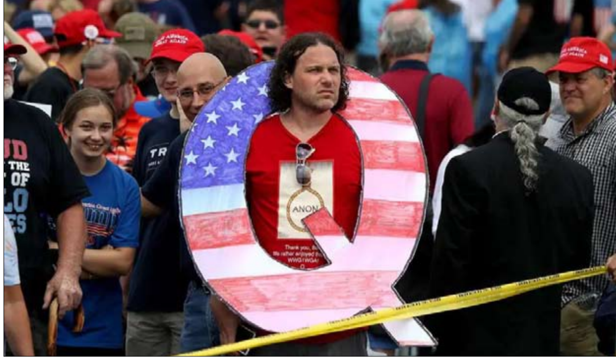
يعتقدون أن كيو قريب من الرئيس

أوقف أربعة أشخاص إضافيين في إطار التحقيق في الهجوم بسكين الذي نُفذ في كنيسة في نيس، في جنوب شرق فرنسا، الخميس الماضي وأدى إلى مقتل ثلاثة أشخاص، وفق ما أفاد مصدر قضائي. وأوضح المصدر لوكالة فرانس برس أن الرجال الأربعة أوقفوا في هال دواز في ضواحي باريس، ويشتهى بأن أحدهم ويبلغ من العمر 29 عاماً، كان على اتصال مع المهاجم التونسي إبراهيم العيسوي. وأضاف المصدر أن الثلاثة الآخرين الذين تتراوح أعمارهم بين 23 و45 عاماً كانوا موجودين في منزل الأول.