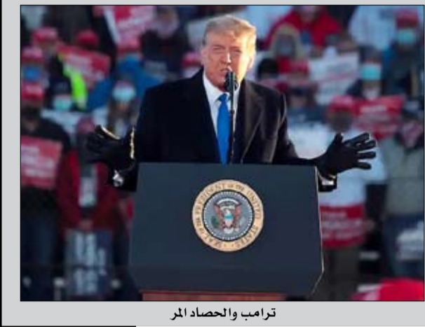
ترامب والحصاد المر

للولايات المتحدة، فيما يلي ترجمته: 2017 23 يناير الانسحاب من الشراكة العابرة للمحيط الهادئ بعد أيام من اعتمادها رسمياً. أعلن ترامب انسحاب الولايات المتحدة من اتفاقية الشراكة العابرة للمحيط الهادئ، والتي سبق أن عارضها بشدة خلال الحملة الانتخابية.