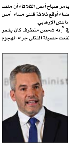
أعلن وزير الداخلية النمساوي كارل نيهايمر صباح أمس الثلاثاء أن منفذ هجوم فيينا الذي قتلته الشرطة بعد اعتداء أوقع ثلاثة قتلى مساء أمس الأول الاثنين كان من "أنصار" تنظيم داعش الإرهابي. وقال كارل نيهايمر خلال مؤتمر صحافي "إنه شخص متطرف كان يشعر بأنه قريب إلى تنظيم داعش"، فيما ارتفعت حصة القتل جراء الهجوم إلى ثلاثة هم رجلان وامرأة بحسب آخر معلومات صادرة عن الشرطة أفادت عن وفاة رجل ثان متأثراً بجراحه. وأوضح أن المحققين دخلوا إلى شقته بعد تفجير الباب بدون إعطاء المزيد من التفاصيل حول المهاجم. وتابع الوزير إن المهاجم "كان مدمجاً بالسلاح" مع بنديقية رشاشة وحزام متفجرات تبين أنه وهمي. وأشار الوزير الذي كان أعلن أن مشتبهاً فيه في الأقل لا يزال فاراً، إلى أنه ينطلق من مبدأ أنهم كانوا "عدة" أشخاص لكن دون تأكيد ذلك رسمياً. وقال إن المحققين يحاولون تحديد العدد "لأن النيران حصلت في مواقع مختلفة..". من جانب آخر سجلت آخر حصة للضحايا ارتفاعاً مع وفاة رجلين وامرأة بحسب آخر المعلومات التي قدمتها الشرطة. ووقعت عمليات إطلاق النار في وقت مبكر من مساء الاثنين، قبل ساعات صوبية من بدء تنفيذ إجراءات الإغلاق العام المرتبطة بكوفيد-19 التي اضطرت النمسا لإعادة فرضها في محاولة للسيطرة على الموجة الوبائية الثانية التي تمزق بها البلاد.