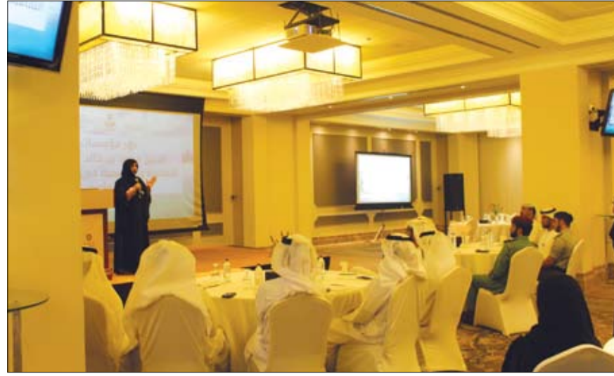
برعاية الشريحة د. شما بنت محمد بن خالد آل نهيان