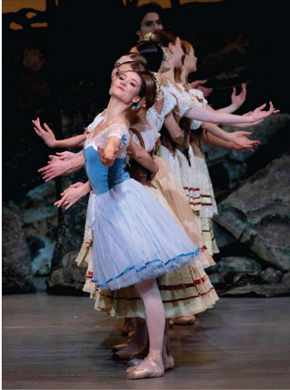
فنانون يؤديون رقصة الباليه الأوكرانية المتحدة خلال حفلهم الافتتاحي في مركز كينيدي في واشنطن