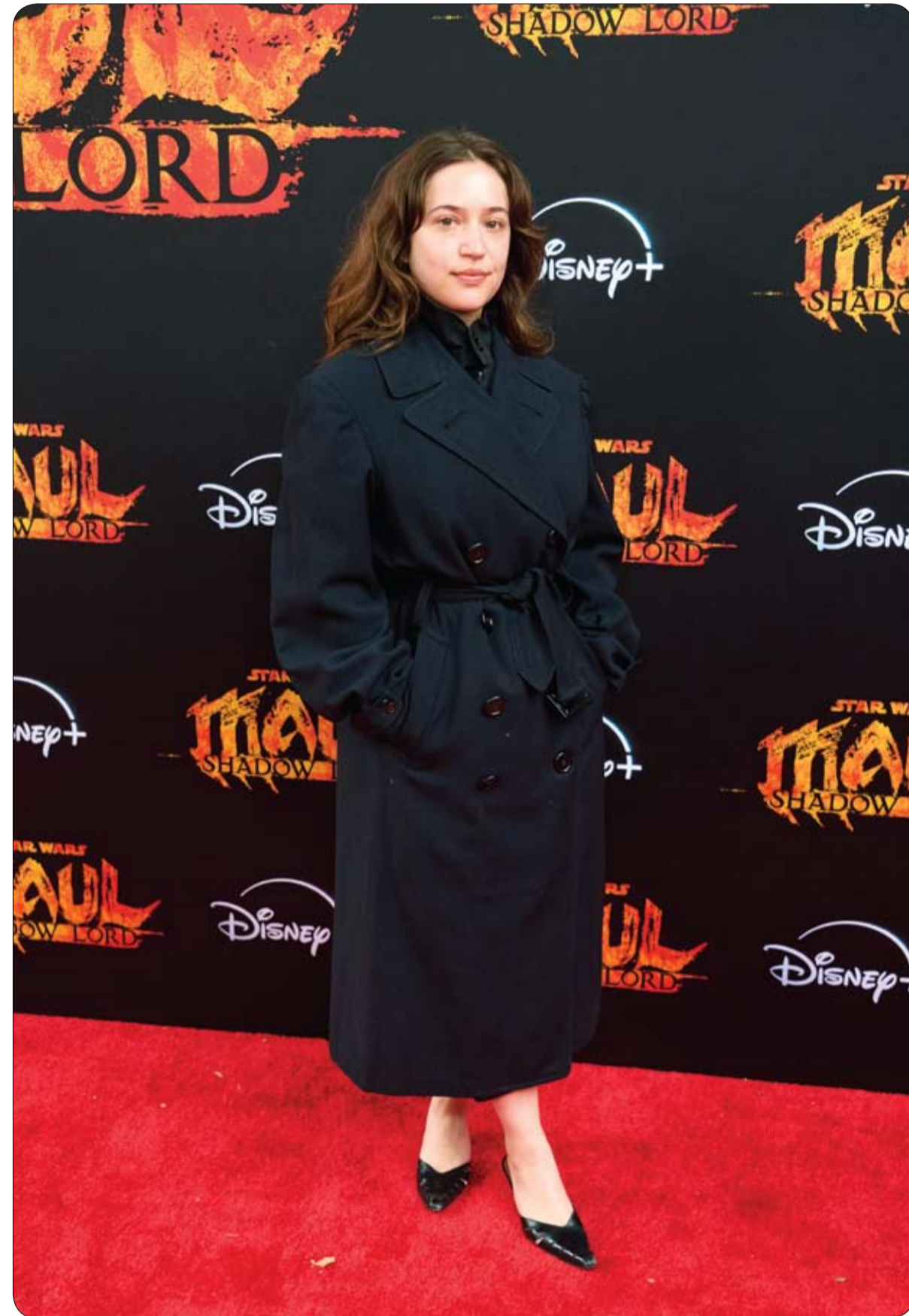
الممثلة الأمريكية جيديون أدلون لدى حضورها العرض الخاص للحلقة الأخيرة من سلسلة أفلام 'حرب النجوم: ماول - سيد الظلال' في كاليفورنيا.

أعلنت وسائل الإعلام الرسمية في ميانمار عن اكتشاف حجر ياقوت ضخم يزن 11.000 قيراط "ما يعادل 2.2 كيلوغرام"، وهو واحد من أكبر الأحجار الكريمة التي تم العثور عليها في الدولة المشهورة بإنتاج أعلى أنواع الياقوت في العالم. وظهر الرئيس "مين أونج هلاينغ" في الصور الرسمية وهو يتفحص الصخرة النادرة في مكتبة العاصمة نايبيداو. وبحسب تقرير نشره موقع "ساينس آيرت"، فقد تم استخراج هذا الحجر من منطقة "موجوك" التابعة لإقليم ماندالاي، وهي منطقة تاريخية تعرف بإنتاج ياقوت "دم الحمام" الفريد. ووصفت الحكومة الحجر بأنه نادر للغاية ويتمتع بجودة عالية، حيث يتميز بلون أحمر أرجواني مع درجات صفراء خفيفة؛ ما يمنحه درجة لونية ممتازة. وعلى الرغم من وجود حجر أكبر تم اكتشافه في المنطقة نفسها عام 1996 بوزن يتجاوز 21 ألف قيراط، إلا أن المسؤولين أكدوا أن الحجر الجديد قد يكون أكثر قيمة بفضل نقائه الطاق وجودة ألوانه. ولم يتم الإعلان عن قيمة تقديرية محددة للحجر حتى الآن، لكن من المعروف أن ياقوت "موجوك" يحطم أرقاماً قياسية في المزادات العالمية بأسعار تصل إلى ملايين الدولارات. ويأتي هذا الاكتشاف في وقت تشهد فيه ميانمار تحولات سياسية، حيث تولى "مين أونج هلاينغ" منصب الرئيس المدني مؤخراً بعد انتخابات جرت في ظل ظروف أمنية معقدة نتيجة الحرب الأهلية التي تلت انقلاب عام 2021.