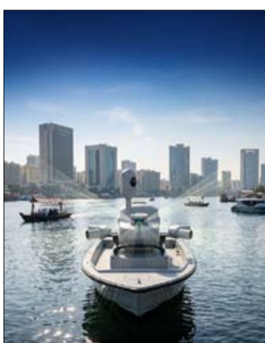
ثلاثية الأبعاد بجودة متقدمة، بالتعاون مع شركاء متخصصين، بما يفتح آفاقاً أوسع لتوظيف هذه