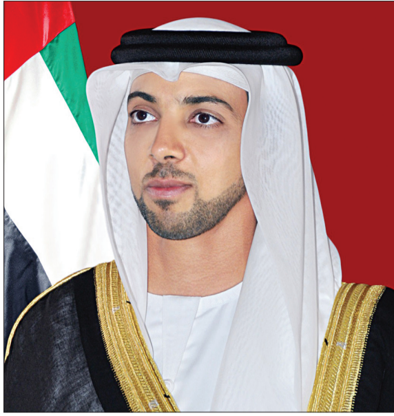
رئيس الدولة، نائب رئيس مجلس الوزراء، رئيس ديوان الرئاسة، في تنمية وتطوير قطاع زراعة النخيل وإنتاج وتصنيع وتسويق التمور على المستوى الوطني والإقليمي والدولي.