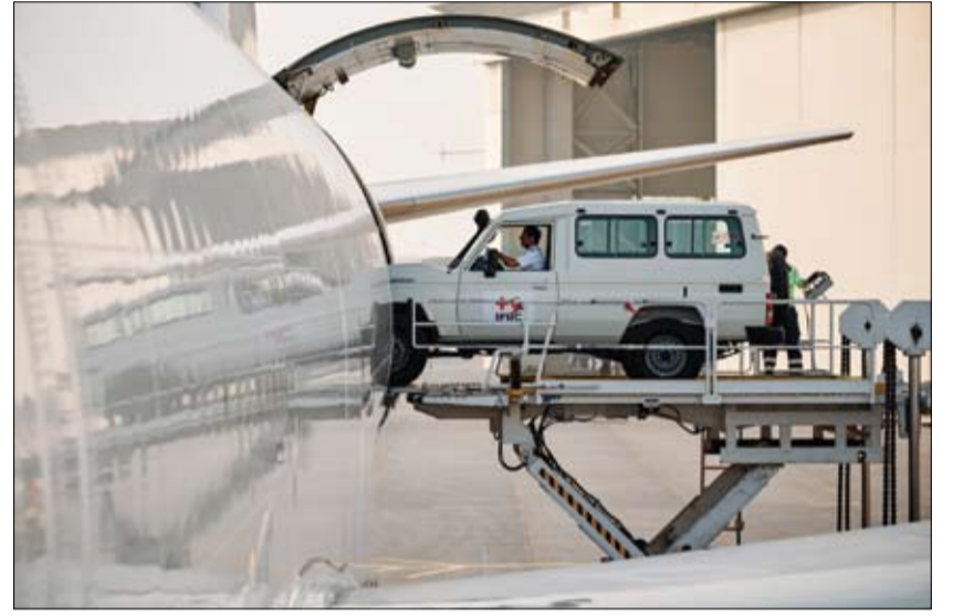
دبي الانسانية تسيّر شحنة جوية إغاثة ثالثة الى الكونغو الديمقراطية (وام)

•• أبو ظبي-وام: بحضور سمو الشيخ منصور بن زايد آل نهيان، نائب رئيس الدولة نائب رئيس مجلس الوزراء رئيس ديوان الرئاسة، وسمو الشيخ خالد بن محمد بن زايد آل نهيان، ولي عهد أبوظبي رئيس المجلس التنفيذي لإمارة أبوظبي، ترأس سمو الشيخ طحنون بن زايد آل نهيان، نائب حاكم إمارة أبوظبي، اجتماع مجلس الشؤون الاستثمارية، التابع للمجلس الأعلى للشؤون المالية والاقتصادية. وشهد الاجتماع مناقشة أحدث المستجدات والتوجهات الاقتصادية الإقليمية والعالمية، وما يرتبط بها من توقعات تختص بالتوجهات الاقتصادية، وما تخلقه التحديات من فرص استثمارية في مختلف القطاعات خلال المرحلة المقبلة. والتقى المجلس مع عدد من المسؤولين من القطاع الخاص، وبحث معهم سبل تعزيز الاستثمارات الأجنبية المباشرة، وبحث معهم سبل تعزيز التعاون الاقتصادي مع دول المنطقة، وبحث معهم سبل تعزيز التعاون الاقتصادي مع دول المنطقة، وبحث معهم سبل تعزيز التعاون الاقتصادي مع دول المنطقة. (التفاصيل ص2)