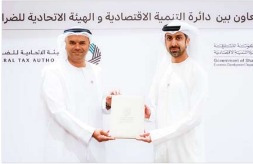
عاون بين دائرة التنمية الاقتصادية و الهيئة الاتحادية للشرائب

العمليات وتدعم هذه البيانات كذلك جهود الهيئة لتطوير نماذج الذكاء الاصطناعي المساعد، وذلك من خلال تزويدها ببيانات نوعية إضافية تعزز قدراتها التحليلية والتنبؤية وتساهم في تقديم خدمات رقمية استباقية وتحسين تجربة التعاملين. وقال إن اتفاقية التعاون المشترك بين الهيئة الاتحادية للشرائب ووزارة التنمية الاقتصادية في الشارقة تدعم جهود الهيئة لحوكمة منظومة تحويل قطاعات وخدمات وعمليات الحكومة لتطبيق نماذج الذكاء الاصطناعي المساعد التي تستهدف إحداث تحول