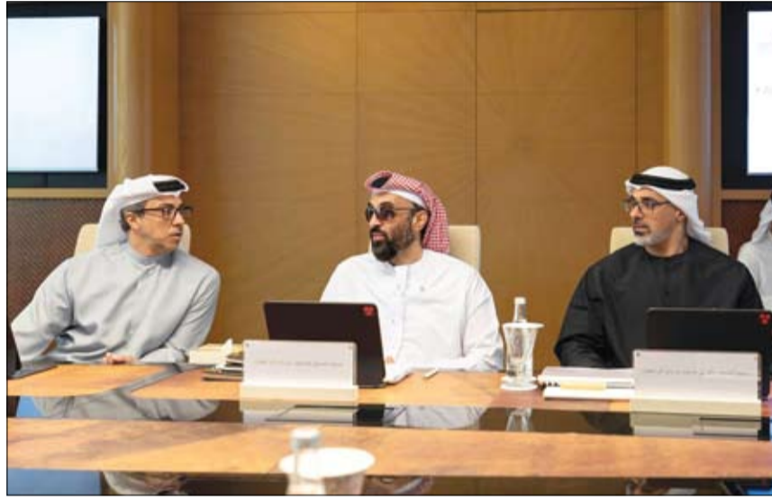
منصور بن زايد وخالد بن زايد خلال حضورهما اجتماع مجلس الشؤون الاستثمارية برئاسة طحنون بن زايد (وام)

الإمارات تتضامن مع قطر في انفجار مصنع بمنطقة رأس لفان الصناعية •• أبو ظبي-وام: أعربت دولة الإمارات عن تضامنها مع دولة قطر الشقيقة في الانفجار الذي وقع بأحد المصانع في منطقة رأس لفان الصناعية، وأسفر عن إصابة عدد من الأشخاص. وأعربت وزارة الخارجية، في بيان لها، عن وقوف دولة الإمارات إلى جانب حكومة دولة قطر وشعبها الشقيق في هذا الحادث المؤسف، متمنية الشفاء العاجل لجميع المصابين. الإمارات تُدين بشدة حادثة إطلاق النار في مدرسة وسط الفلبين •• أبو ظبي-وام: أدانت دولة الإمارات بشدة حادثة إطلاق النار التي وقعت في مدرسة بمدينة تاكلوبان في جمهورية الفلبين الصديقة، وأسفرت عن مقتل وإصابة عدد من الأشخاص. وأكدت وزارة الخارجية، في بيان لها، أن دولة الإمارات تعرب عن استنكارها الشديد لهذه الأعمال الإجرامية، وتؤكد رفضها الدائم لجميع أشكال العنف والتطرف التي تستهدف زعزعة الأمن والاستقرار. كما أعربت الوزارة عن خالص تعازيها ومواساتها لأهالي وذوي الضحايا، ولحكومة جمهورية الفلبين وشعبها الصديق، وتمنياتها بالشفاء العاجل لجميع المصابين.