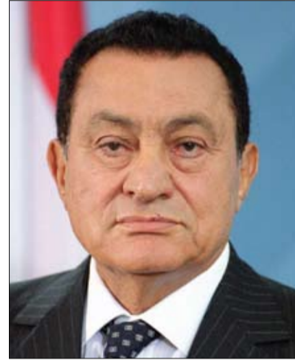
زايد آل نهيان ولي عهد أبوظبي نائب القائد الأعلى للقوات المسلحة برقيتي تعزية مماثلتين إلى فخامة الرئيس عبدالفتاح السيسي.