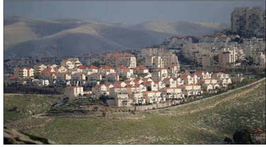
مستوطنات الاحتلال تبطل اراضي الضفة

قد أعلن عن هذه الخطط في العشرين من فبراير الجاري، وسط حملة انتخابية يسعى فيها لكسب أصوات الناخبين المؤيدين للمستوطنات، وفق ما ذكرت رويترز. وكان نتانياهو قد تعهد بضم المستوطنات الإسرائيلية في الضفة المحتلة وغور الأردن في إطار خطة السلام التي عرضها الرئيس الأمريكي دونالد ترمب الشهر الماضي، ورفضها الفلسطينيون وقالوا إنها متحيزة لإسرائيل.