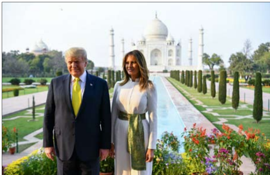
الثاني ترامب امام تاج محل