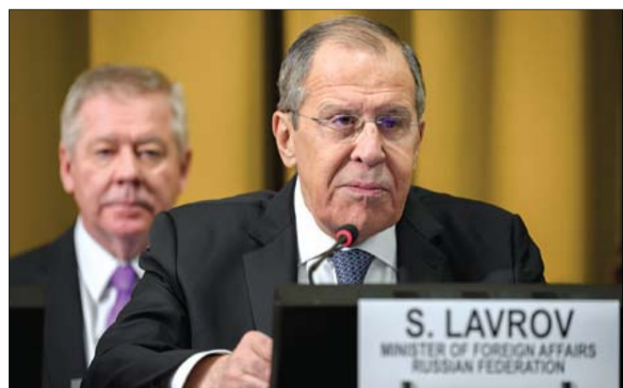
لافروف خلال كلمته في جنيف (ا ف ب)