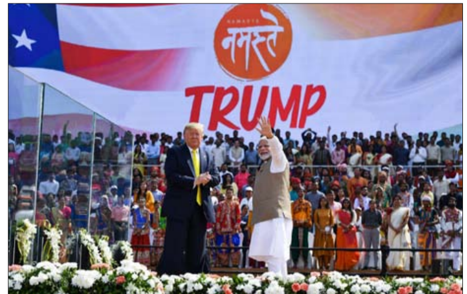
علاقة تفرضا الظروف