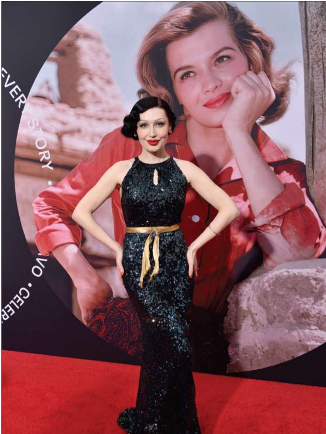
ستيفي كاي لدى حضورها مهرجان TCM للأفلام الكلاسيكية لعام 2023 في هوليوود ، كاليفورنيا.

وثبت بالفعل أن نقل جين BPIFB4 إلى الفئران يوقف تصلب الشرايين والسكري ومضاعفات أخرى، وفي المستقبل، يمكن استخدام التجارب السريرية لمعرفة ما إذا كان نفس النوع من التأثيرات الوقائية يحدث عند البشر أيضاً.