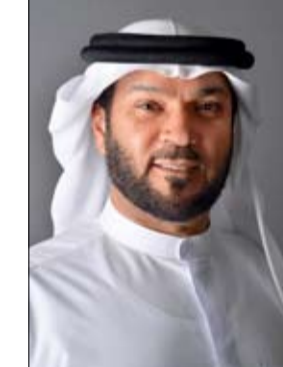
•• الشارقة - وام.

والتنوع الذي يزيد من استقراره ويجذب إليه شرائح أوسع من المستثمرين. وأشار مساعده إلى أن توجيهات صاحب السمو الشيخ الدكتور سلطان بن محمد القاسمي عضو المجلس الأعلى حاكم الشارقة محمد بن سلطان القاسمي ولي عهد ونائب حاكم الشارقة رئيس المجلس التنفيذي جعلت الإمارة وجهة مفضلة على مستوى المنطقة للمشاريع الريادية المبتكرة وزادت من مساهمة هذا القطاع الحيوي في الناتج المحلي للشارقة ولدولة الإمارات العربية المتحدة وأسهمت في الوقت ذاته في تعزيز مشاركة المواطنين والمواطنات في اقتصاد بلدهم وخدمة مجتمعهم. من جانبه أكد سعادة حمد علي عبد الله المحمود مدير مؤسسة الشارقة لدعم المشاريع الريادية "رؤاد" أن الربع الثاني من العام الجاري شهد تفاعلاً كبيراً من قبل رواد الأعمال مع المبادرات والمشاريع التي تنفذها المؤسسة وإقبالاً لافتاً على الحصول على خدماتها المختلفة