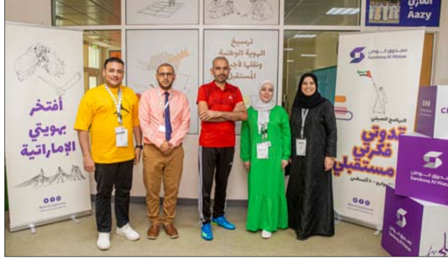
مع انطلاق الأسبوع الثاني من البرامج الصيفية لصندوق الوطن بأبوظبي والرئيس:

رحلات البرامج الصيفية لصندوق الوطن .. ترفيه ومعرفة واكتشاف وانطلقت الرحلات الثقافية والترفيهية التي تنظمها البرامج الصيفية لصندوق الوطن التي تتخطى 24 رحلة في كل من أبو ظبي والرئيس إلى عدد كبير من الوجهات الترفيهية والمعرفية والوطنية والتاريخية بمشاركة كافة المشاركين في الأنشطة، وتستمر هذه الرحلات حتى نهاية البرامج في 10 من أغسطس المقبل ومنهاكازانيا ياس مول، والأزيف والمكتبة الوطنية بأبوظبي، الأكواريوم أبوظبي، ومستشفى أبوظبي للصدر، والأزيف والمكتبة الوطنية، وقصر الوطن، ومتحف اللوفر، وبيت الحرفيين بأبوظبي، والقرية التراثية - الرويس، ومزرعة مدينة الفطنة - حديقة الحيوانات، والرويس مول - المدينة الترفيهية، ومركز الطاقة النووية في الظنة. وعبر طلاب المدارس عن سعادتهم بالباقة بهذه الرحلات، وحرصوا جميعا على المشاركة، وشهدت الرحلات التي انطلقت إلى الأزيف الوطني تفاعلا كبيرا من جانب الطلبة، كما كانت الرحلة على مدينة كزانيا من اللحظات التي سجلتها ذاكرة الطلبة وهواتهم أيضا، لما بها من أنشطة مذهلة.