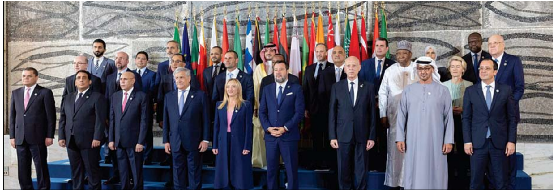
رئيس الدولة والقادة المشاركون في المؤتمر الدولي للتنمية والهجرة المنعقد في روما (وام)