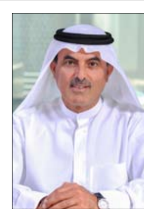
مركز دبي المالي العالمي، أولها، المركز العالي للشركات العائلية والثروات الخاصة في مركز دبي المالي العالمي، ومركز دبي للشركات العائلية تحت مظلة غرف دبي.

هذا القطاع، دشّن سمو الشيخ مكتوم بن محمد بن راشد آل مكتوم، النائب الأول لحاكم دبي نائب رئيس مجلس الوزراء وزير المالية، أعمال المركز، ليكون الوجهة المعنية بضمان استدامة ونمو الشركات العائلية في إمارة دبي، وتعزيز مساهمته الاقتصادية بما يخدم الخطط التنموية للإمارة. ويتيح المركز الدعم الفني والإداري للشركات العائلية، بما يضمن استدامتها وتحقيق التعاقب السلس بين الأجيال، وإعداد استراتيجية شاملة لدعم وتطوير تلك الشركات في دبي، علاوة على دوره في تطوير المهارات الإدارية للشركاء في الشركات العائلية ومؤسساتها وأعضائها وتعريفهم بالخدمات الحكومية المقدمة لهذه الشركات.