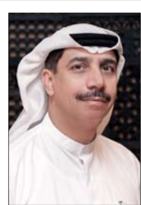
مركز الثروات العائلية على مستوى العالم