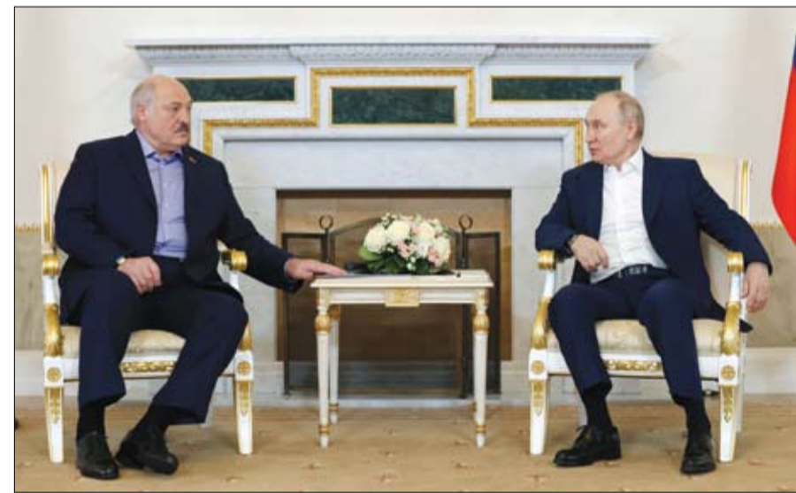
الرئيس الروسي ونظيره البيلاروسي خلال اجتماعهما في سانت بطرسبرغ

وأوردت البيان: قامت القوات المسلحة الأوكرانية بمحاولات فاشلة للعمليات الهجومية في اتجاهات دونيتسك وكراستي ليغان وجنوب دونيتسك وزابوريجيا. وأضاف بيان وزارة الدفاع: في