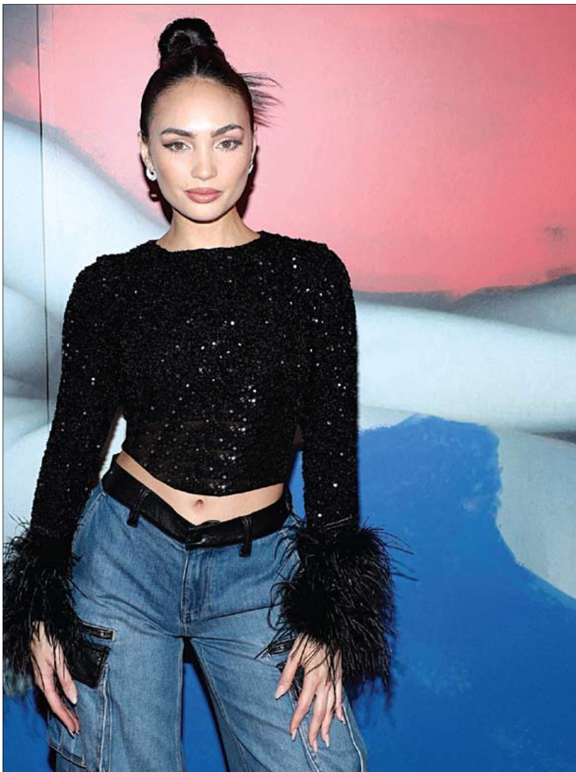
ريبوني جابريل خلال حضورها عرض أليس + أوليفيا الذي قدمته ستايسي بينديت لربيع 2024 في نيويورك. (ا ف ب)

وقالت جامادار: «الأمومة يمكن أن تكون صعبة حقاً، والنساء اللواتي يرعين في أن يصبحن منظمات بشكل كبير يشعرن بخيبة أمل في أنفسهن عندما يخطئن في الأمور. لذا فإن الأمومة قد تجعل النساء أكثر حساسية تجاه الذاكرة الثانوية أو هفوات التركيز التي ربما كان من الممكن أن يتم تجاهلها أو اعتبارها غير مهمة قبل إنجاب طفل».