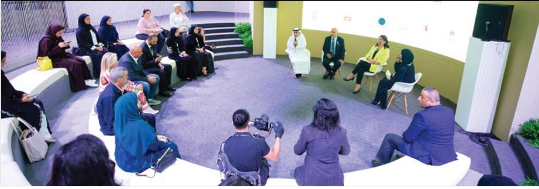
بمشاركة 23 فريقاً من 15 جامعة داخل وخارج الدولة