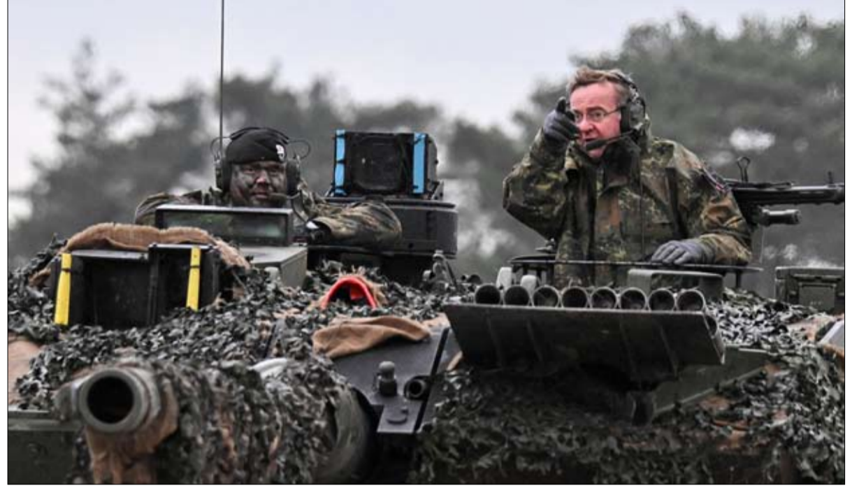
وزير الدفاع الألماني بوريس بيستوريوس على ظهر دبابة ليوبارد 2

في 9 يونيو، إن العصر الحالي يتطلب قبل كل شيء أن يكون لدينا متخصصون على درجة عالية من الكفاءة أكثر بكثير من المجندين. إن قضية زيادة عدد أفراد الجيش الألماني خطيرة للغاية ومن الجيد أن الوزير يريد تقديم مفهوم قابل للتطبيق بحلول نهاية الهيئة التشريعية.