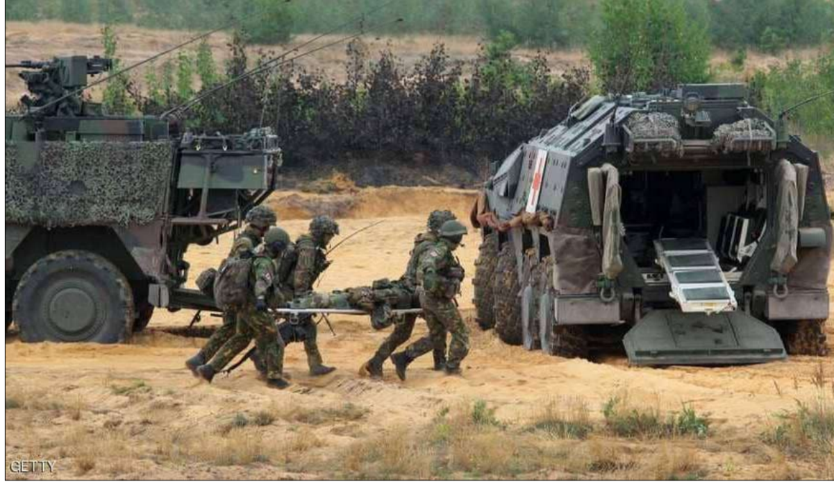
أكبر مناورة عسكرية للناو في ألمانيا

•• واشنطن-وكالات في محاولة لتوفير ملاذ آمن دائم لبعض النازحين الفارين من هول الحرب في قطاع غزة، يبدو أن إدارة الرئيس الأميركي جو بايدن تدرس إمكانية جلب بعض الفلسطينيين إلى الولايات المتحدة كلاجئين. هذا ما كشفتته وثائق حكومية داخلية. فقد أظهرت تلك الوثائق أن كبار المسؤولين في العديد من الوكالات الأميركية الاتحادية ناقشوا خلال الأسابيع الماضية التطبيق العملي لبعض الخيارات من أجل إعادة توطين فلسطينيين من غزة، تربطهم علاقات عائلية مع مواطنين أميركيين أو مقيمين دائمين، حسب ما أفادت شبكة «سي