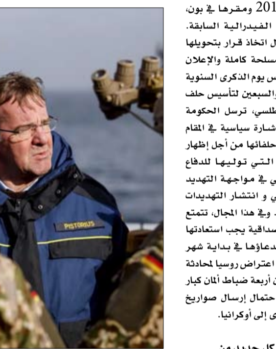
بوريس بيستوريوس وسط جنوده

بحاجة الجيش الألماني، والسؤال الآن هو إلى أي مدى وبأي وتيرة سيتم تنفيذ التغييرات، يوضح سونكي نيترز، أستاذ التاريخ العسكري في الجيش الألماني