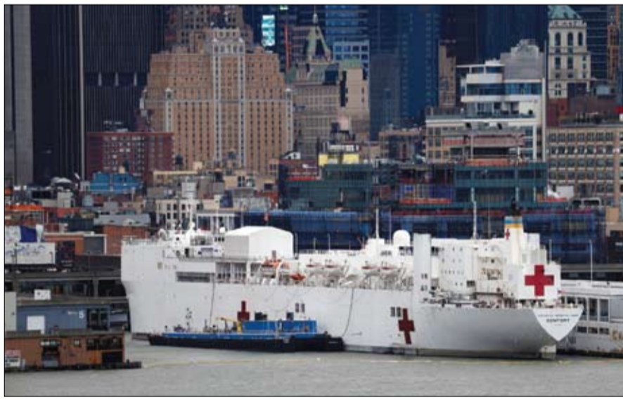
سفينة أمريكية تعمل كمستشفى على الرصيف في الساحل الغربي لمانهاتن