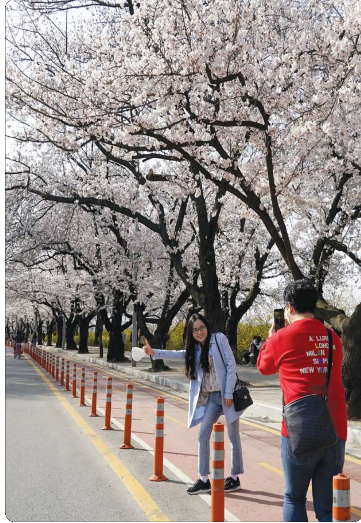
فتاة تقف لالتقاط صورة بالقرب من شارع على جانبيه أزهار الكرز، وسط إغلاق لتجنب انتشار فيروس كورونا في سيول، كوريا الجنوبية.

قال مصمم الأزياء الإيطالي الشهير جورجيو أرماني "أنا خائف كما الجميع" من فيروس كورونا المستجد، لكنه قرر مواجهة من خلال إنتاج بزات طبية في مصانعه الكرسية عادة للسلع الفاخرة. وفرض المصمم البالغ 85 عاماً والمولود في منطقة إيميليا رومانيا في وسط إيطاليا الشمالي، نفسه كأحد أبرز اللاعبين في أوساط الموضة في ميلانو، عاصمة منطقة لومبارديا. وسجل في هاتين المنطقتين أكبر عدد من الوفيات جراء وباء كوفيد-19. مع نحو عشرة آلاف وفاة أي 70% من مجمل الوفيات المسجلة رسمياً في إيطاليا.