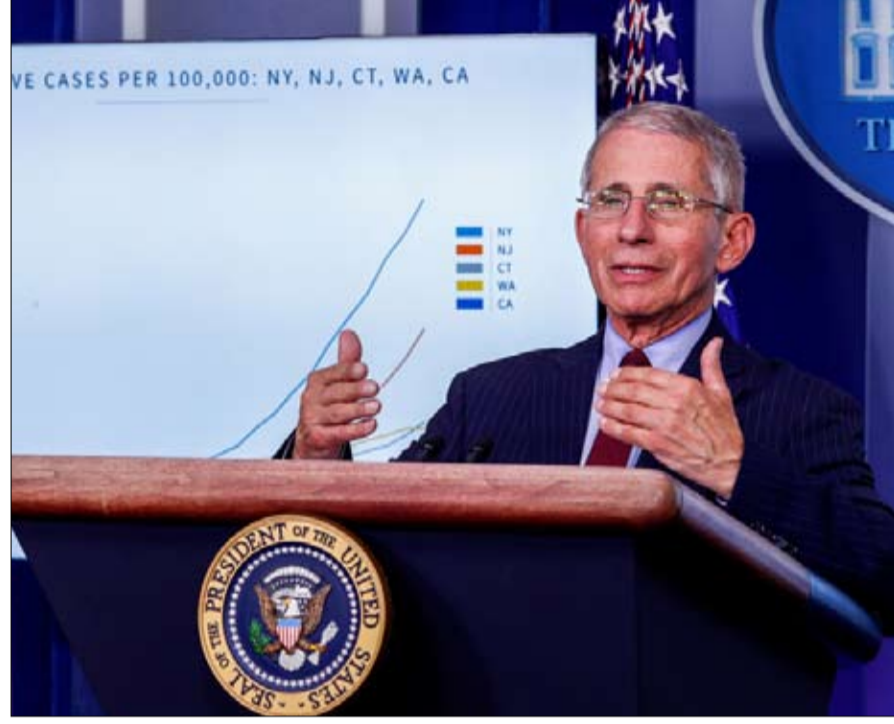
الدكتور فوشي نجم يجذب الرئيس

وهي ثلاث صفات على الأقل، تجعل من حضوره عاملاً مطمئناً وسط فوضى وعدم استعداد البيت الأبيض لوباء كوفيد 19 الذي يصيب البلاد - يوجد اليوم 215 ألف مصاب، وأكثر من 5 آلاف قتيل.