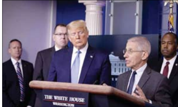
ترامب منزعج من نجومية الدكتور

•• برلين-وكالات: قال وزير الصحة الألماني ينس سبان، أمس، إن الأجهزة المسؤولة عن المشتريات في بلدان العالم تتنازع مع بعضها البعض للحصول على كمادات صينية الصنع بفعل زيادة الطلب العالمي. وخلال زيارة لشركة تسعى لمساعدة ألمانيا في الحصول على كمادات أساسية أثناء مكافحة جائحة كورونا قال الوزير إن هناك مجالاً لمزيد من التعاون الأوروبي في تصنيع كمادات واقية.