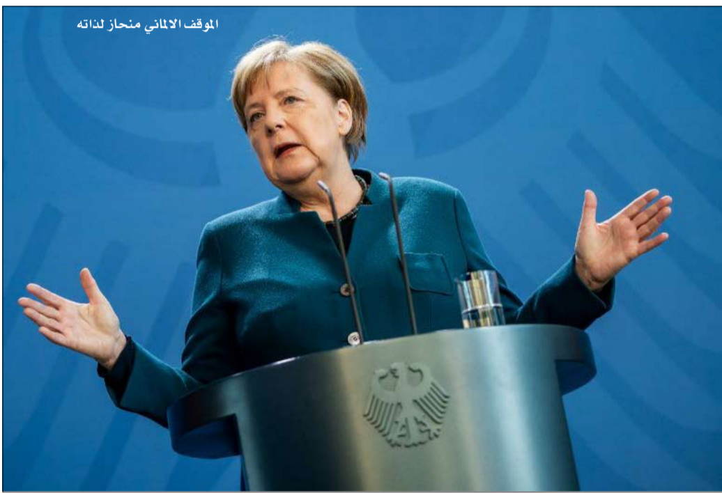
الموقف الألماني مناز لداثة

في مواجهة حجم الأزمة بسبب وباء فيروس كورونا، يبدو الحذر والتحفظ اللذين أبدتهما ألمانيا تجاه عمل مالي مشترك على المستوى الأوروبي غير لائق وليس في مكانه. ولا يهدد هذا الموقف بالانهيار النهائي لأوروبا، فقط، بل يتعارض مع مصالح ألمانيا نفسها. وتخاطر أنجيليا ميركل بأن يذكرها التاريخ ليس كتلك التي أنقذت أوروبا واهدت بلادها دوراً في التوجيه والتوجه..