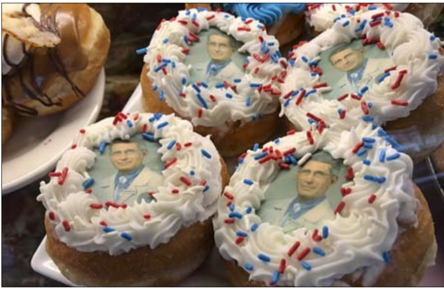
كعكة تكريماً لعطاء الدكتور

لئن كان أحد الموظفين الأعلى أجراً فإنه يبقى طبيبا قبل كل شيء