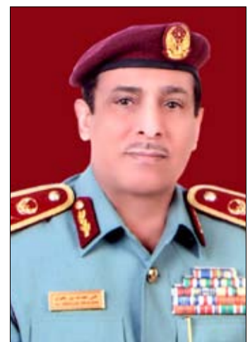
•• رأس الخيمة - الفجر

أكد اللواء علي عبد الله بن علوان النعيمي رئيس فريق الطوارئ والأزمات والكوارث المحلي - قائد عام شرطة رأس الخيمة، عبر لقائه وتواصله مع بعد مع فريق الطوارئ والأزمات والكوارث المحلي، بحضور كافة مدراء وممثلي المؤسسات الاتحادية والمحلية برأس الخيمة، وأعضاء الفريق، أهمية التوافق والتواصل بين جميع الجهات لتوحيد آليات العمل المشتركة وذلك التزاماً بالتوجيهات التي أصدرتها