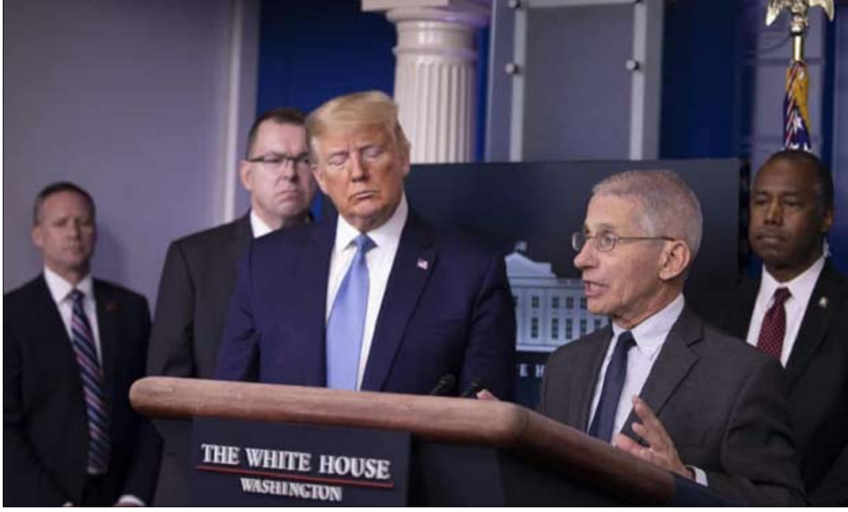
ترامب منزعج من نجومية الدكتور