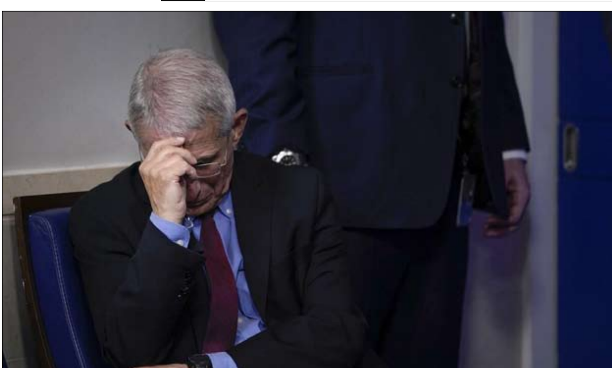
لقطة اثار حفيظة انصار ترامب

لقد ظهر مع ستيفن كاري، لاعب كرة السلة، في نقاش مباشر على إنستغرام، وحواره مارك زوكربيرغ على فيسبوك، ويمزج على قنوات يوتيوب الشعبية... باختصار، ان التقاعد ليس على جدول أعمال طبيب سيحتفل برابعه الـ 80 يوم 24 ديسمبر. "عندما أشعر بأنني لم أعد أملك الطاقة للقيام بهذه المهمة، مهما كان عمري، سأعادر وأكتب كتابي"، لخص في الختام.