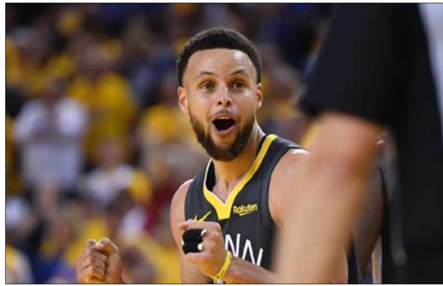
نجم كرة السلة ستيفن كاري ناقش الوباء مع فوشي

شتيمة... ويرر الدكتور فوشي ذلك بالقول إن علكة عقلت في حلقه.