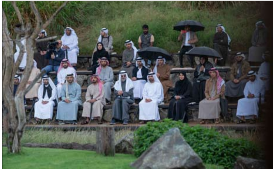
وتعرف سموه على الخطط المستقبلية لسفاري وما يضمه من بيئات جديدة ومرافق حديثة، والأنواع المختلفة من الحيوانات والطيور، وموريمي، ووادي النيجر. كما شاهد سموه العديد من الفعاليات والأنشطة الترفيهية التي ينظمها سفاري الشارقة لزواره، والتي تقدم من خلالها المعرفة حول أبرز الحيوانات، وما تتميز به وطرق تفاعلها مع البيئة من حولها.

ويتمتع على مساحة تبلغ ثمانية آلاف هكتار، ويضم 12 بيئة مختلفة تمنح الزوار تجربة مثالية لاستكشاف التضاريس الأفريقية والحيوانات والطيور. ويعكس سفاري الشارقة الرؤية الشارقة لصاحب السمو الشيخ الدكتور سلطان بن محمد القاسمي عضو المجلس الأعلى حاكم الشارقة، في الاهتمام بالبيئة ومختلف مكوناتها الطبيعية، والحرص على المحافظة عليها، ودعم تنوعها الحيوي والبيئي، بالإضافة إلى توفير المعرفة والثقافة حول البيئة ومكوناتها إلى كافة الفئات والشرائح، وتوفير تجربة سياحية معرفية ترفيهية