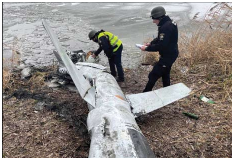
ضباط الشرطة يتفقدون صاروخ كروز روسيا أسقطه الدفاع الجوي الأوكراني في منطقة كييف.

هذا وأعلنت السلطات الموالية لروسيا في دونيتسك أن القوات الروسية دخلت مدينة أوغليدار في المحور الجنوبي للمقاطعة التي انضمت إلى روسيا مؤخراً، فيما كشف مسؤول آخر عن صعوبات في السيطرة عليها وشبهها بمعارك ماريوبول. فقد أعلن مستشار القائم بأعمال رئيس جمهورية دونيتسك، إيغور كيمافوكسكي، أن القوات الروسية دخلت أوغليدار.