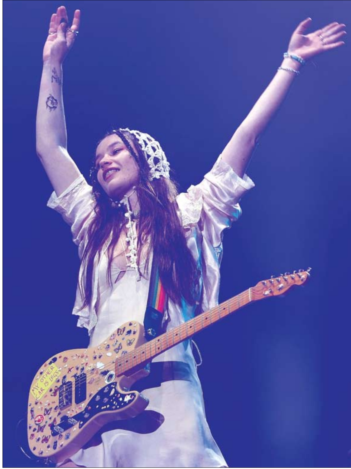
ريان تيسدال، من فرقة الروك البريطانية ويت ليج، يؤدي عرضا خلال مهرجان The Town الموسيقي في ساو باولو، البرازيل.