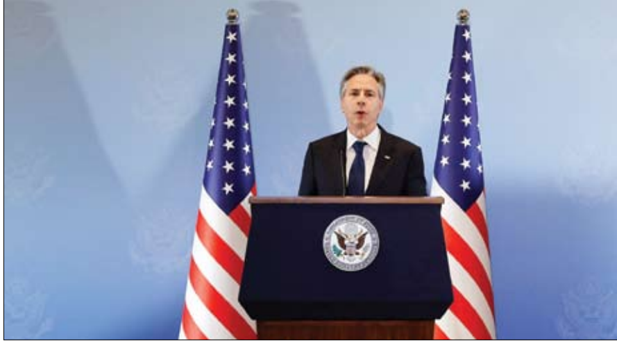
وزير الخارجية الأمريكي خلال مؤتمر صحفي في تل أبيب

على صعيد آخر أكد وزير الخارجية الأمريكي أنتوني بلينكن الجمعة أن إقامة دولة فلسطينية ستضمن تحقيق الأمن لإسرائيل.