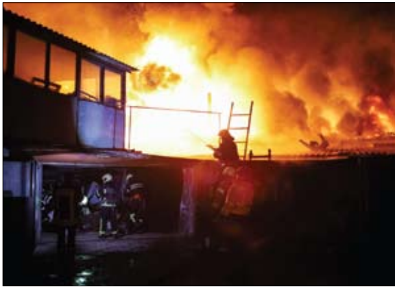
أفراد الطوارئ يخدمون حريقاً بعد ضربة روسية في خاركييف

وأضافت أن ما لا يقل عن 132 فلسطينياً، من بينهم 41 طفلاً، قتلوا في الضفة الغربية، 124 منهم على يد القوات الإسرائيلية ونحو ثمانية على يد المستوطنين. كما قتل جنديان إسرائيليين.