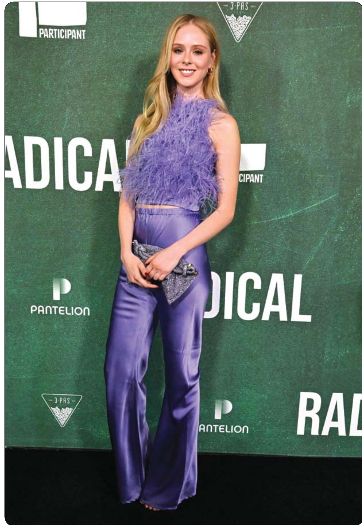
التمثلة الأمريكية لوريتو بيرالتا لدى حضورها العرض الأول لفيلم Radical في لوس أنجلوس.

كشفت دراسة جديدة أن استخدام الهواتف المحمولة قد يكون مرتبطاً بانخفاض تركيز الحيوانات النوية وإجمالي عددها. ووفق "إندبندنت"، لم تجد الدراسة أي ارتباط بين استخدام الأجهزة وانخفاض حركة الحيوانات النوية وتشكلها. وقام باحثون من جامعة جنيف (UNIGE) بتحليل بيانات 2886 رجلاً سويسرياً تتراوح أعمارهم بين 18 و 22 عاماً، تم تجنيدهم بين عامي 2005 و 2018 في ستة مراكز تجنيد عسكرية. وأفاد باحثون أن تركيز الحيوانات النوية كان أعلى في مجموعة الرجال الذين لم يستخدموا هواتفهم أكثر من مرة واحدة في الأسبوع (56.5 مليون لكل مليمتر)، مقارنة بالرجال الذين استخدموا هواتفهم أكثر من 20 مرة في اليوم (44.5 مليون لكل مليمتر).