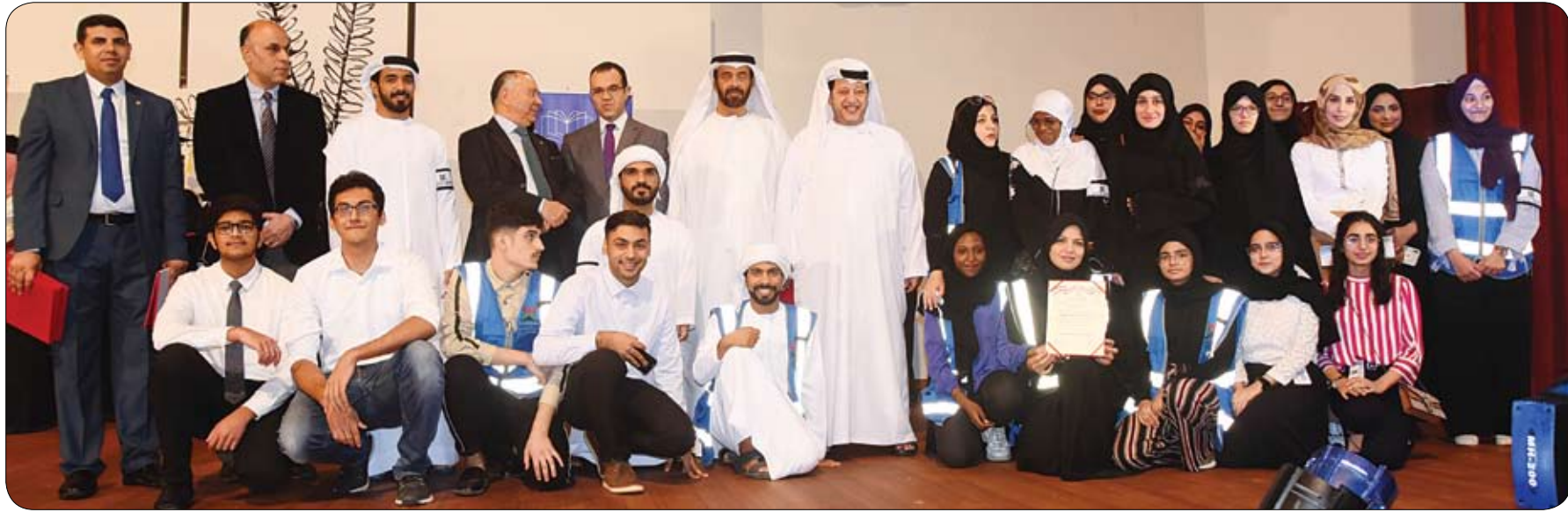
تزامنا مع عام التسامح