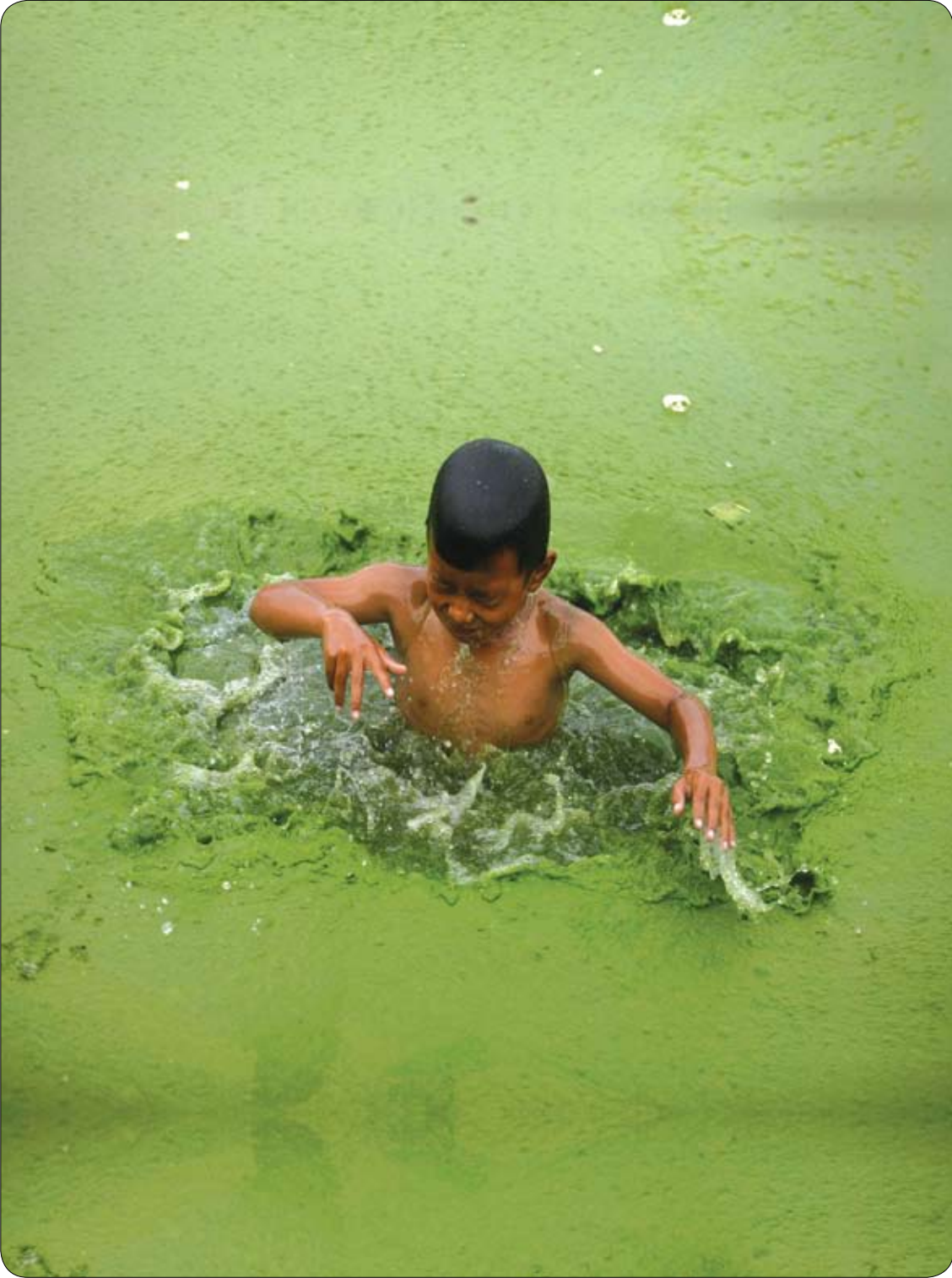
صبي يغوص في بركة مغطاة بالطحالب في باكتابور، نيبال.

نصح التقرير مرضي حساسية القمح بضرورة تناول الاسماك لانها غنية بالعديد من العناصر التي يحتاجها الجسم نتيجة لحرماته من القمح، وايضا عليه تناول اللحوم .