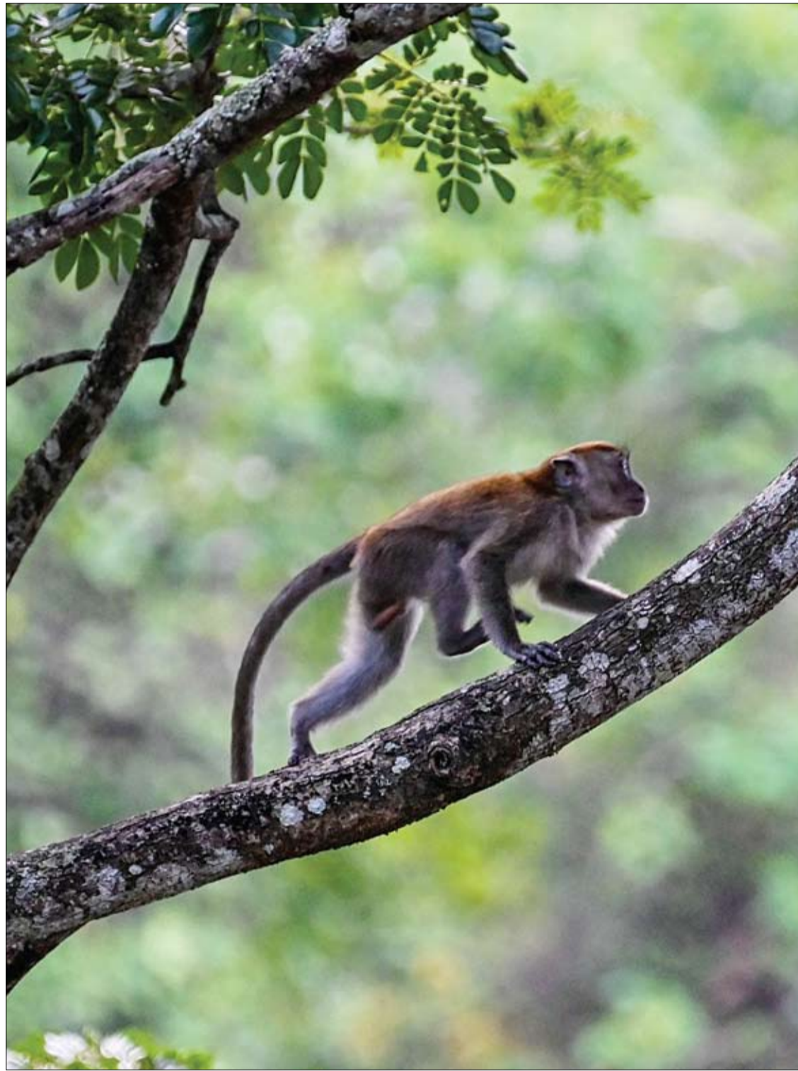
قرد المكاك طويل الذيل يتسلق غصن شجرة في Japakeh في مقاطعة آتشيه الإندونيسية