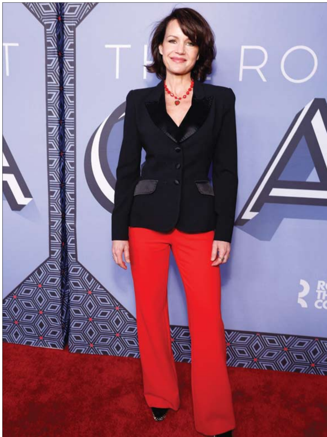
كارلا جوجينو لدى حضورها حفل The Roundabout في مدينة نيويورك

ونشرت النتائج في مجلة Nanotechnology Nature.