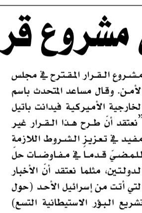
الائتلاف نتياهو، فيتلحق بوزير الأمنيين فان

سلطته وحده، في حين أكد سموتريتش لرئيس الوزراء أن إخلاء المستوطنات بالضفة الغربية هو إجراء مدني ومن صلاحياته. وأضاف التقرير العبري: "هذا الخلاف حول موضوع الصلاحيات يؤدي إلى شكوى ومطالبات من جانب سموتريتش تجاه نتياهو، متابعا أن رئيس الوزراء يفهم أنه يجب تهدئة هذا القطع، في إشارة إلى إمكانية انهيار ائتلافه بسبب ذلك.