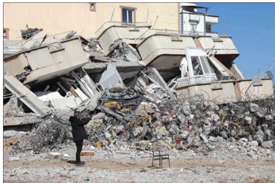
رجل تركي يلتقط صورة بهاتفه أمام المباني المتضررة من الزلزال في غازي عنتاب

تم إنقاذ ناجيتين أخيرين من تحت الأنقاض في تركيا، بعد مرور أكثر من عشرة أيام على وقوع الزلزال المدمر، لكن عمليات الإنقاذ هذه أصبحت نادرة بما ينسج المجال للحرز والغضب مع تلاشي الأمل في العثور على مزيد من الناجين. وقالت محطة تي.آر.تي خبر أنه تم إنقاذ فتاة عمرها 17 عاماً في إقليم كهرمان مرعش في جنوب شرق تركيا، بعد 248 ساعة من وقوع الزلزال الذي بلغت قوته 7.8 درجة، ووقع في جنح الليل في السادس من فبراير (شباط). وقالت السلطات إن عدد من قتلتا في أسوأ زلزال يضرب تركيا في تاريخها الحديث ارتفع إلى 40 ألف قتيل وفي سوريا، التي أضافت الزلزال فيها للأزمة الإنسانية بسبب الحرب الدائرة منذ أكثر من 11 عاماً، بلغ عدد القتلى المسجل حتى الآن 5800 وهو عدد لم يطرأ عليه تغيير يذكر في الأيام الماضية. وتكتف وكالات الإغاثة الدولية جهودها مساعدة الملايين الذين