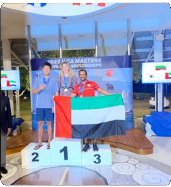
وأضاف قائلاً: "لقد أثبتت هذه النتائج استعداد منتخب الإمارات وجاهزيته العالية للمشاركة في المحافل الدولية وتحقيق نتائج رائعة ومراكز متقدمة تفخر بها جميعاً".