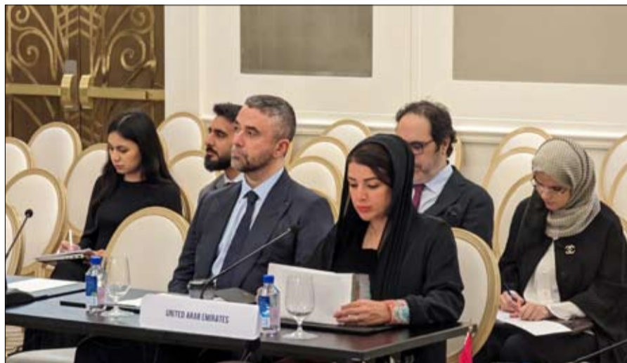
قد التقت على هامش الزيارة الجماعة الكاريبية والمدير العام وفد من وزارة الخارجية والتعاون أيضا بعدد من قادة منظمة منظمة التجارة العالمية، بحضور الدولي.

العزير، من خلال هذه الأنشطة والبرامج والجوائز، التي تسهم في تنشئة أبناء وبنات الوطن، على الإبداع والابتكار والمبادرة، وحب الخير لأنفسهم ولوطنهم، ولعلمهم، في الحاضر والمستقبل، على السواء لتكون الإمارات بلد التنمية والتقدم والأزدهار. وتمنى للمؤسسات بالزيد من النجاح والتوفيق في خدمة الوطن، بظل القيادة الحكيمة، لصاحب السمو الشيخ محمد بن زايد آل نهيان، رئيس الدولة، حفظه الله وريعه، وهو الذي يبذل كل الجهد، من أجل تنمية الإنسان، وتعزيز روح الالتزام والإنجاز لديه، في إطار تسيير فيه الإمارات بقيادته، نحو مجتمع يقوم على العلم والعرفه، ويحظى بالرخاء والسلام، وهنا جميع الفائزين.