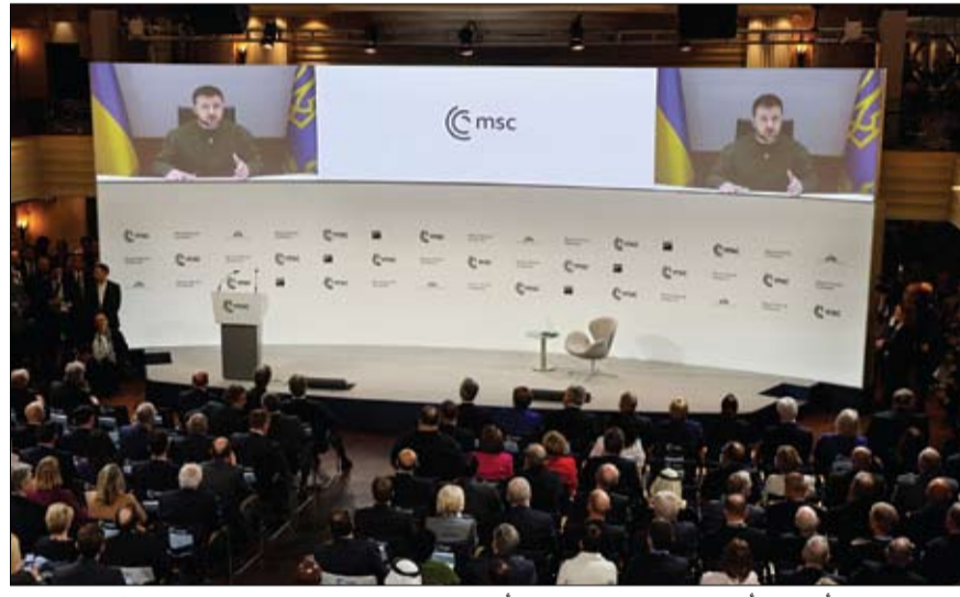
الرئيس الأوكراني أمام قادة مؤتمر ميونيخ للأمن مطالباً بسرعة إمداد بلاده بالمقاتلات

شدد الرئيس الأوكراني فولوديمير زيلينسكي على أن تأخير إرسال الأسلحة لبلاده خطأ كبير. وقال زيلينسكي في مداخلة عبر الفيديو أمام مؤتمر ميونيخ للأمن في ألمانيا الجمعة: نحن بحاجة إلى تسريع تسليم الأسلحة لأوكرانيا ولا بديل لذلك، مضيفاً أن أوكرانيا بحاجة إلى طائرات مقاتلة في أسرع وقت. كما أضاف أن الكرملين جلب الدمار إلى أوروبا، مؤكداً أن أوكرانيا يجب أن تكون عضواً في الاتحاد الأوروبي وحلف الناتو. كذلك تابع: لا مساومة على تحرير كل أراضي أوكرانيا من الاحتلال الروسي، حسب تعبيره، لافتاً إلى أنه يتفق على قدرة بلاده على تحقيق النصر ضد الرئيس الروسي فلاديمير بوتين ومؤيديه. من جانبه، قال المستشار الألماني أولاف شولتس إن بوتين لن ينجح وأوكرانيا ستنتصر، مشدداً على أن أوروبا موحدة الآن أكثر من أي وقت مضى.