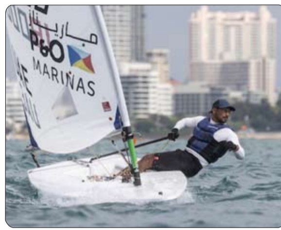
ثلاث مرات متتالية. وبهذه المناسبة أعرب الشيخ أحمد بن حمدان آل نهيان، رئيس اتحاد الإمارات للشراع والتجديف

الحديث عن فخره الكبير بهذا الإنجاز الذي يأتي امتداداً لترسيخاً لفوز العام الماضي وقال "أهدى هذا الفوز لقيادتنا الرشيدة لدعمها اللامحدود لمختلف الرياضات بشكل عام ورياضة الشراع الحديث بشكل خاص، وما كنا لنحقق هذا الفوز لولا هذا الدعم والتواصل والتفكير على إعداده لاعبين محترفين يحققون نتائج مبهرة في مختلف المحافل الرياضية الدولية". وأضاف "أشعر بالفخر الكبير والسعادة الغامرة لرفع علم دولة الإمارات العربية المتحدة خفاقاً عالمياً في هذه البطولة العالمية للمرة الثانية على التوالي، الأمر الذي يدفعنا لمواصلة جهودنا