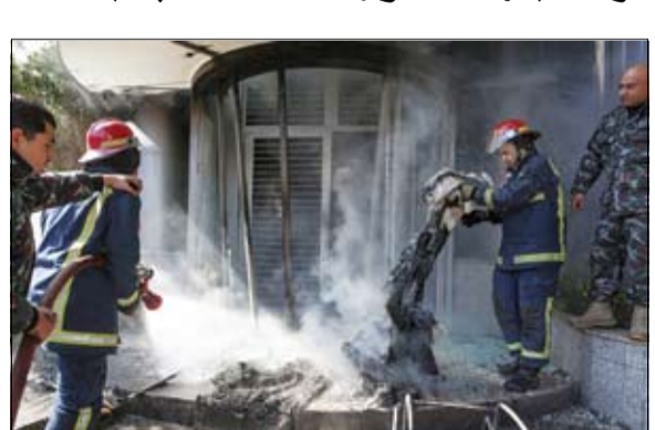
رجال الإطفاء يخمدون حريقاً في بنك BBAC في بيروت

يتجه نواب البرلمان الفنلندي إلى التصديق على مساعي انضمام بلادهم لحلف شمال الأطلسي (ناتو)، رغم عدم الحصول على موافقة تركيا والمجر بعد، بحسب وكالة بلومبرغ للأخبار. وبعد 9 أشهر من التقدم يطلب للانضمام للحلف، تريد فنلندا التي يصل عدد سكانها إلى 5.5 مليون نسمة أن تبعت برسالة للدولتين، مفادها أن الوقت قد حان لاستكمال توسيع التحالف العسكري الغربي. ويبلغ طول حدود بين فنلندا وروسيا 1300 كيلومتر. وقال جوسي هالا-أهو، رئيس لجنة الشؤون الخارجية بالبرلمان الفنلندي، إنه سوف يتم إحالة مشروع قانون في هذا الشأن لجلسة عامة بعدما أنهت اللجنة مناقشته.