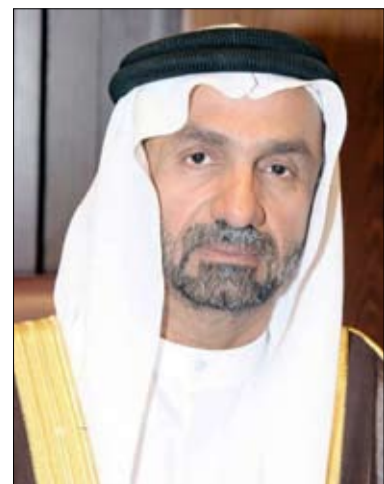
•• أبو ظبي-وام:

أشاد المجلس العالمي للتسامح والسلام بمخرجات اجتماع المجلس الوزاري لجامعة الدول العربية في دورته الـ 160، الذي انعقد الأربعاء الماضي في مقر الجامعة العربية بالقاهرة. وأثنى على دور مجلس جامعة الدول العربية في ترسيخ قيم التسامح على المستوى الدولي ومكافحة كافة أشكال الكراهية، والذي تجلى في اجتماع الدورة الـ 160 والذي أذان من خلاله كافة أشكال التحريض على الكراهية