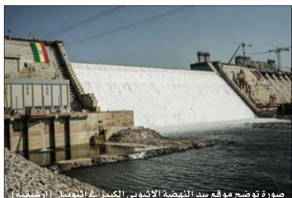
صورة توضح موقع سد النهضة الإثيوبي الكبير في الجيوبا