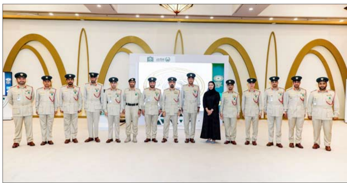
الاهتمام في مسابقة طيران الإمارات من خلال طالبتين وطالب، وغيرها من الإنجازات الأخرى .