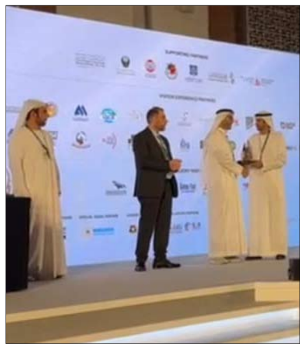
•• أبو ظبي-الغد:

وتبنت قدرة الشركات الوطنية على المنافسة العالمية في هذا المجال. وأضاف: "نحرص دائماً على المشاركة في هذا المعرض العالمي المتميز للمساهمة في الترويج السياحي التراثي لإمارة أبو ظبي والإمارات على مستوى المنطقة والعالم، جنباً إلى جنب مع تعزيز مفهوم النوعية والإبداع بنفوس الرماية والصيد التي ترتبط بعاداتنا وتقاليدنا الأصيلة، وتعتبر جزءاً لا يتجزأ من تراث الإمارات والهوية الوطنية لأبناء مجتمعنا". واختتم: "نتوجه بالشكر والتقدير إلى شيوخنا الكرام وكافة الأفراد الذين تفضلوا بزيارة جناح تسليح