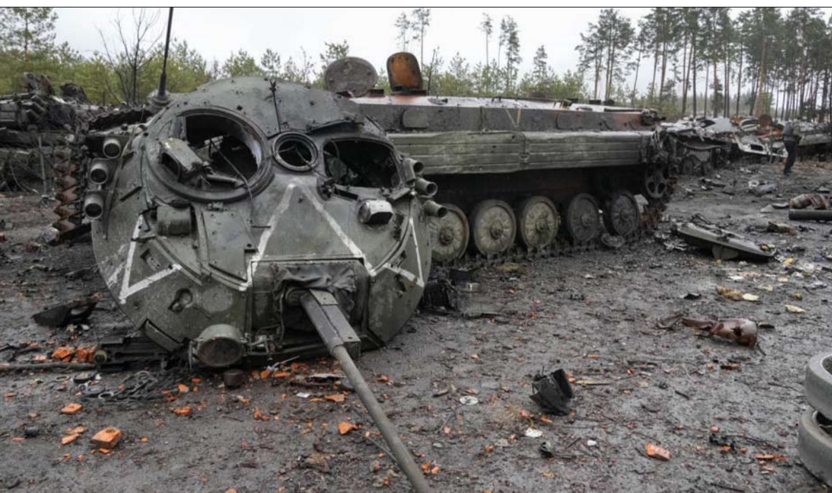
تلادا خسرت اوكرانيا 20% من أسلحتها في الاسابيع الاولى من الهجوم المضاد

خلافات بين المدنيين والعسكريين؟ تتمسك إدارة بايدين بخطف دعمها القوي لكيف، على الرغم من الاحتمال المكن لاستمرار الحرب لعام ثالث من الصراع. إن الانتخابات الرئاسية الأمريكية في نوفمبر 2024 تقترب بالفعل وتتسبب في توتر مفهوم. ومن المتوقع أن يؤدي فصل الشتاء إلى إبطاء أو وقف التقدم الأوكراني جنوباً، على الرغم من التقدم الأخير حول هريتي ريبوتين وفيريوف وعبور خط الدفاع الروسي الأول. إن خطر نشوب صراع أوكورديون طويل، مع دفعات في كلا الاتجاهين، يبدو مرتفعاً. ولا يستبعد بعض الخبراء فرضية شن هجوم روسي واسع النطاق على منطقة خاركيف، التي استولت عليها قوات كييف في عام 2022 و تقول دارا ماسيكوت، الخبيرة في مركز أبحاث راند، والقريب من دوائر الدفاع "يواجه الأوكرانيون حالياً واحدة من أكثر الشبكات الدفاعية تعقيداً التي شهدناها منذ عقود. ولا يتمتع الجيش الأمريكي بخبرة كبيرة في التعامل مع هذا الأمر، دون التفوق الجوي". في 22 أغسطس، دعا مستشار الأمن القومي جيك سوليفان المعلقين إلى "مستوى معين من التواضع" في تقييم العمليات الأوكرانية. في الواقع، ليس لدى الجيش الأمريكي خبرة حديثة في مسرح العمليات، مع خنادق ودفاعات مُحززة، تم حفرها من قبل جيش نظامي معارض. إن نموذج مكافحة التمرد إذاً كان بوسعنا أن نتحدث عن نموذج، نظراً للتنازع الطويلة الأمد المطبق في أفغانستان والعراق لا يجدي نفعاً هنا. ومع إصراره على "ديناميكية"