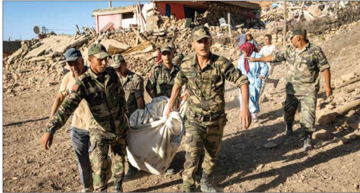
القوات المسلحة الملكية المغربية تقوم بإجلاء جثة من منزل دمره الزلزال في قرية تافغت جنوب غرب

كما أكد أن عددا من القرى الواقعة في محيط مركز الزلزال اختفت نهائياً. إلا أنه شد على عزم السلطات العمل على إعادة إعمار المناطق المدمرة.