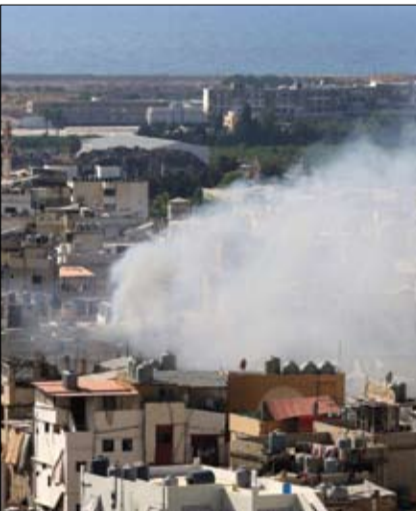
الدخان يتصاعد فوق مباني مخيم عين الحلوة

وقعت اشتباكات بشكل متقطع في مخيم عين الحلوة للاجئين الفلسطينيين في مدينة صيدا جنوبي لبنان، رغم الإعلان عن اتفاق لوقف إطلاق النار مساء السبت. وذكرت الوكالة الوطنية للإعلام أمس الأحد أن الوضع الأمني متوتر في مخيم عين الحلوة، وظلت الاشتباكات حتى منتصف الليل متقطعة حيث توقفت مدة أربع ساعات لتستأنف عند الرابعة فجراً وما زالت بوتيرة تخف حينا وتتصاعد أحيانا، رغم كل الجهود والاتصالات التي أجريت على أعلى المستويات واللقاءات التي عقدت حتى ساعة متأخرة من الليل، بإشراف سفير فلسطين أشرف دبور وحضوره. ووفق الوكالة، تدور الاشتباكات عند نقطة المحور الغربي للمخيم حي حطين جبل الحليب، ويسمع دوي القذائف التي تخطت حدود المخيم لتتطاول أماكن الجوار حاصدة المزيد من الخسائر البشرية والمادية، مشيرة إلى نسبة نزوح أكبر للأهالي من المخيم في اتجاه أماكن آمنة في مدينة صيدا. وكشف موقع النشر اللبناني أمس عن اشتداد وتيرة