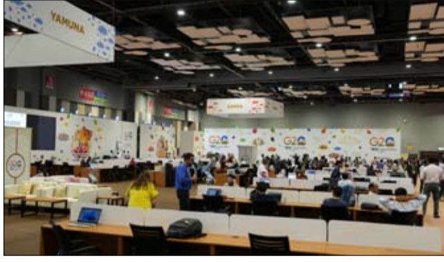
استضافتها مؤتمر COP28، وأضاف باوان: "نتوقع أن تحقق دولة الإمارات مزيداً من النجاحات والإنجازات في هذا الحدث العالمي الضخم، بما يسهم في تعزيز العمل على خفض الانبعاثات، والتكيف مع تداعيات تغير المناخ."

الشرق الأوسط وشمال أفريقيا، تطلق مبادرة استراتيجية لتحقيق الحياد المناخي بحلول 2050. وقال تريستن نايلور، أستاذ السياسة الدولية والتاريخ بجامعة كامبريدج، أن دولة الإمارات تشهد خلال العام الجاري حدثاً مهماً وخطياً مع استضافتها مؤتمر COP28، لمعالجة قضايا التغير المناخي، وتباع نايلور: "ستتجه الأنظار خلال الأشهر القادمة نحو دولة الإمارات العربية المتحدة لرؤية ما سيسفر عنه الحدث من أجل التوصل إلى اتفاق لمعالجة تغيرات المناخ وإقناع العالم من تداعياتها. من جانبها، قالت بيثي سيلبي كبير المحررين في صحيفة نيو إنديان إكسبريس، إن دولة الإمارات تعمل بشكل مستمر على تحقيق التوازن بين التنمية واستدامة البيئة، وهو ما نتوقع أن تراه بشكل ملحوظ خلال فعاليات مؤتمر الأطراف COP28، الذي سيعقد في