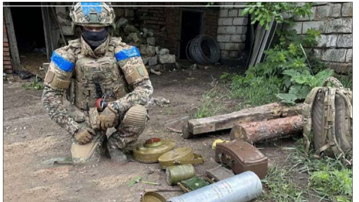
الألغام الروسية تعيق هجوم كييف المضاد

لم تعد مناسبة. "إن الساعات الجيدة قدبرت إدارة بايدين منذ البداية أن طائرات F-16 هذه لن تغير توازن القوة بشكل جذري، وبالتالي لن يكون رصيدها حاسماً. إن الإجماع شبه العام بين المسؤولين والخبراء الأمريكيين هو أن الرئيس الروسي فلاديمير بوتين ليس مستعداً على الإطلاق للتفاوض، فهو يعتمد على استفاد التعبئة بين الحلفاء وعلى مرونة روسيا في مواجهة العقوبات، على الرغم من الصدمة التضخمية القادمة بلا شك. وتؤكد إحدى المصادر: "نحن بحاجة إلى المزيد من أدوات الضغط على بوتين" فهو الذي يريد أمد الحرب الأوكرانية. وهو الذي يطيل أمد هذه الحرب ويعلم أنه يريد احتلال المزيد من الأراضي الأوكرانية. لن تنتهي الحرب بأيجابية لأن أحداً في واشنطن أو أوروبا يريد ذلك. والاعتقاد بهذا هو السداجة الغربية، وعلى هذا فإن الدعوات النادرة إلى عملية دبلوماسية مع موسكو، حتى ولو بهدف التوصل إلى هدنة بسيطة من دون معاهدة سلام، كما فعل الباحث سامويل شاراب، تبدو في غير محلها، حيث تعتبر الأوكرانيين في المقام الأول مجرد إضافات في مسألتهم الخاصة. وفي مقال نشر في 31 أغسطس في مجلة فورين أفيرز بعنوان "كيف يمكن لأوكرانيا أن تفوز في حرب طويلة"، دعا الجنرال الأسترالي السابق ميك رايان الخبير في مركز الدراسات الاستراتيجية والدولية الأميركية عادة. إن مقالات F-16، التي التزمت عدة دول بتقديمها إلى كييف، الترويج وهولندا والدنمارك، لن تدخل