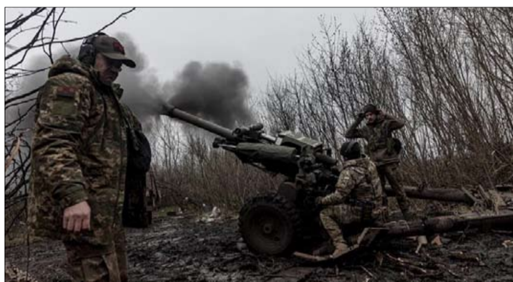
هجوم اوكراني مضاد بدون جدوى في منطقة دونباس

مثل هذا الصراع، رفض جيك سوليفان الحديث عن طريق مسدود. وأشار المستشار إلى أن المناورات الحالية هي "قرارات سيادية" لأوكرانيا، مستبعداً بالتالي فكرة وجود شكل من أشكال الإنتاج المشترك، الذي من شأنه أن يربط إدارة بايدين بخيار عمليات إعادة الغزو الجماعية. 7- وفضل التأكيد على استدامة الالتزام الأمريكي، على الرغم من المقاومة المتزايدة في الكونجرس، وخاصة بين المسؤولين المنتخبين الترامبيين في مجلس النواب. وأضاف: "على الرغم من وجود أصوات متنافرة على الجانب الآخر، فإننا نعتقد أنه، لا تزال هناك قاعدة دعم قوية من الحزبين لسياستنا في أوكرانيا ودعم أوكرانيا والدفاع عنها". في الوقت الحاضر، خصصت الولايات المتحدة أكثر من 43 مليار دولار لأوكرانيا في شكل مساعدات عسكرية ومعدات وذخائر. وفي أوائل أغسطس، طلبت إدارة بايدين مبلغاً إضافياً قدره 13 مليار دولار من الكونجرس، كجزء من حزمة إنفاق طارئة أوسع بقيمة 40 مليار دولار. في اليوم التالي لتدخل جيك سوليفان، نشرت صحيفة نيويورك تايمز مقالا نقدياً جديداً. وقد أوضح أن الأوكرانيين نشروا قواتهم ومعداتهم بعيداً بين الشرق وخاصة في "بخومت، التي مُحيت من الخارطة، لكن مكانها الرمزي لا يزال محل نزاع - والجنوب بدلاً من التركيز على جبهة واحدة. ضباط أمريكيون ربما كانوا شغومهم على التركيز على هدفهم الرئيسي، وهو التقدم نحو مدينة ميليتوبول لتقطع الجسر البري بين