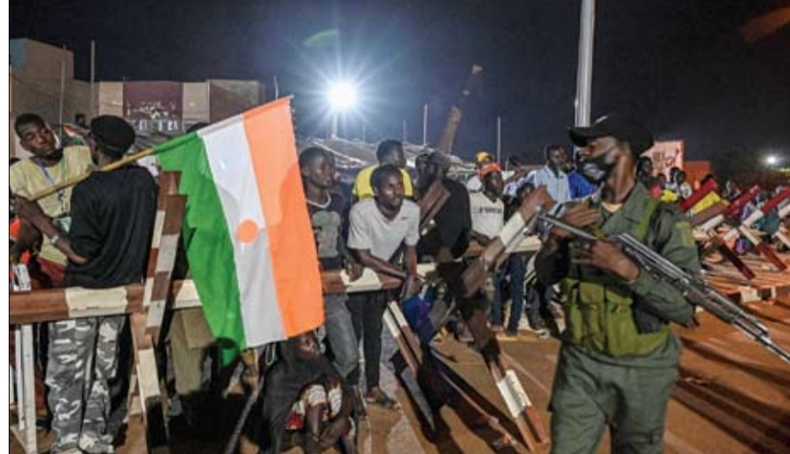
نيجريون يواصلون التظاهر مطالبين برحيل القوات الفرنسية

إم، وواحدة من طراز دورنييه 328، في إطار تعزيزات في ساحل العاج، مضافاً قاتلاً إن فرنسا تواصل نشر قواتها في عدد من بلدان إكواس (الجماعة الاقتصادية لدول غرب إفريقيا) في إطار نشر قواتها في عدد من دول غرب إفريقيا، استعداداً لشنّ عدوان على البلاد. وأضاف قاتلاً إن فرنسا تواصل نشر قواتها في عدد من بلدان إكواس (الجماعة الاقتصادية لدول غرب إفريقيا) في إطار نشر قواتها في عدد من دول غرب إفريقيا، استعداداً لشنّ عدوان على البلاد. كما أوضح أنه تم منذ الأول من سبتمبر نشر طائرتي نقل عسكريتين من طراز إيه 400