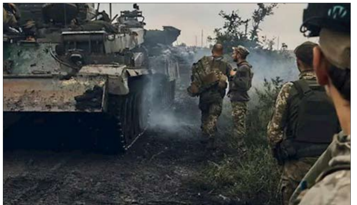
بعد فشل الهجوم المضاد خيانت قليلة أمام أوكرانيا والغرب