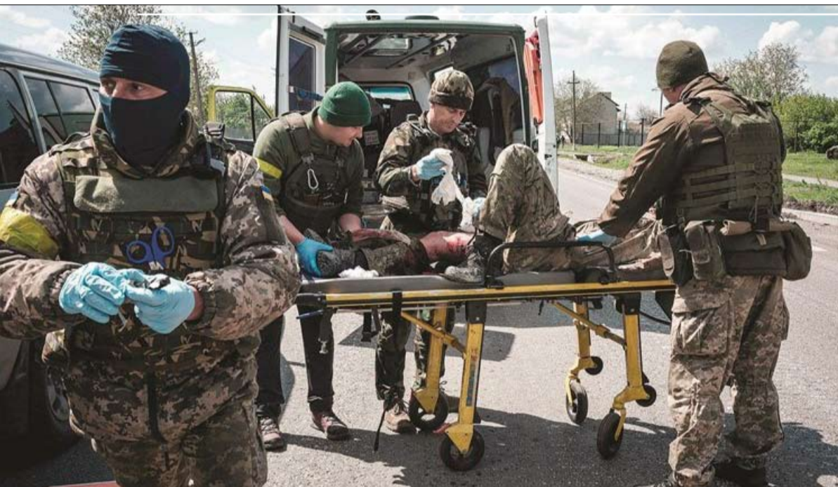
ارتفاع خسائر الجيش الأوكراني منذ بدء الهجوم المضاد

× ترجمة: خيرة الشيباني عن صحيفة "لوموند"