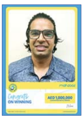
سجوبات محفوظ رقم 126

على أنظمة الرعاية الصحية الأمريكية كفاءة التشغيل وتحقيق التوفير في التكاليف والابتكار والحفاظ على المواهب وتعزيز التنافسية.. من جهته، قال السيد عمر الأمين، عضو