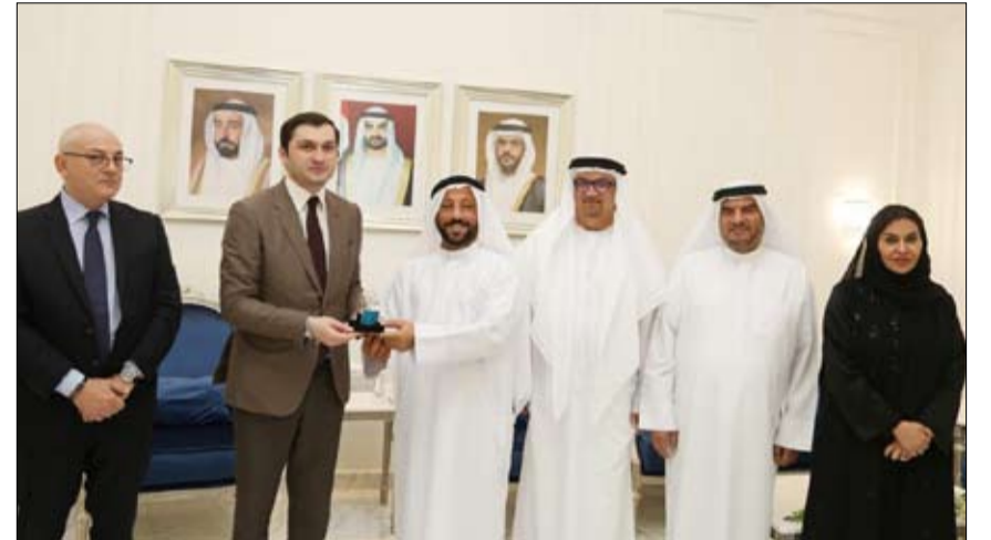
خلال استقباليها لوفد رفيع المستوى