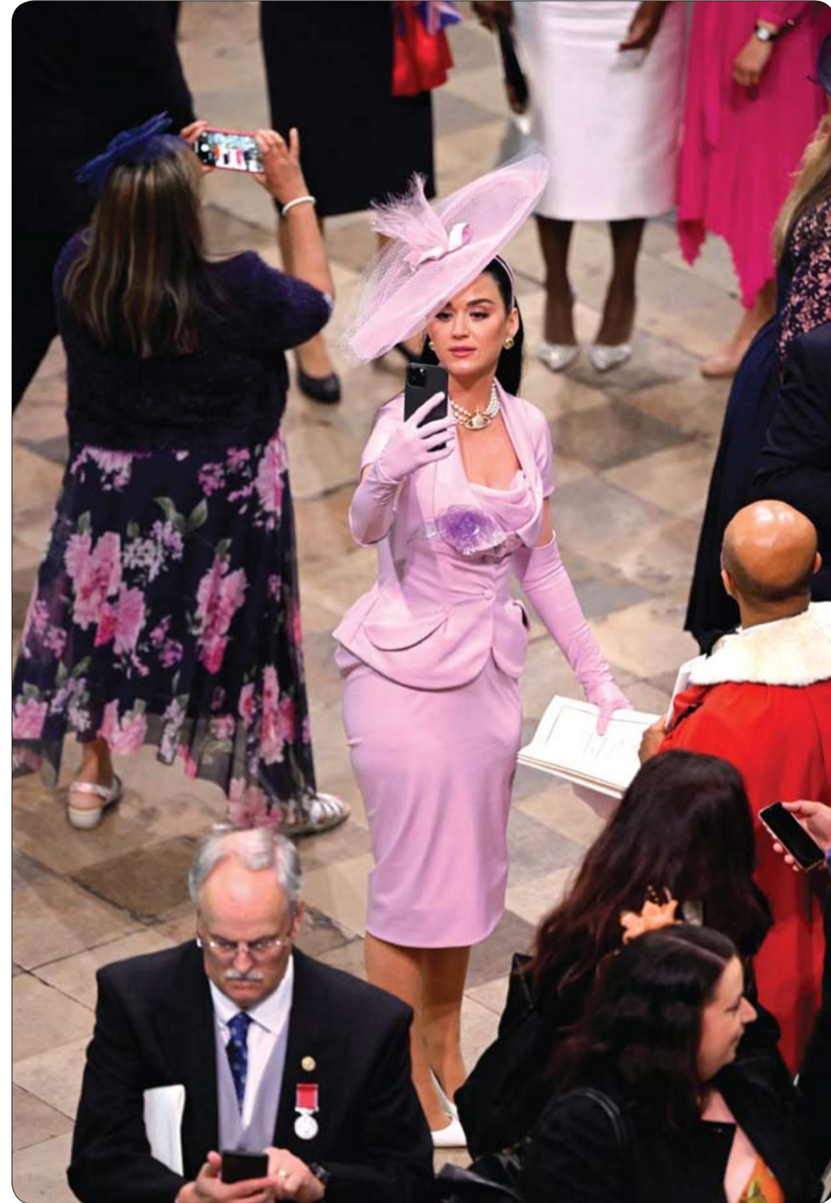
كاتي بيرى تلتقط صور سيلفي أثناء ترويج الملك تشارلز الثالث والملكة كاميليا في لندن.

يذكر أن ديانا تعد إحدى أهم الشخصيات الرائعة التي تركت بصمتها في تاريخ المملكة المتحدة، حيث ساهمت في تأسيس مشروعات خيرية لدعم الأطفال والمرضى، وتعزيز حقوق المرأة والسلام العالمي، وبذلك تظل ذكراها خالدة في قلوب الناس حول العالم.