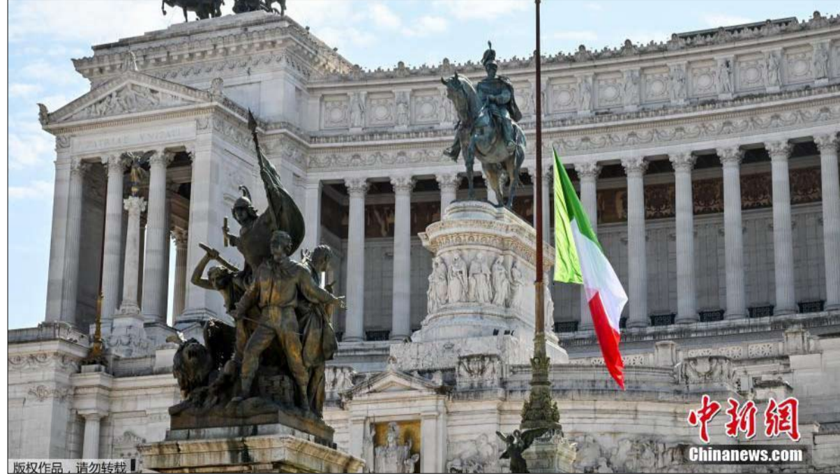
تنكيس الاعلام في إيطاليا

خمس سنوات على اغتيال شقيقه. في 1999 قضى نجل جون كينيدي وزوجته وشقيقتها في حادث تحطم طائرة صغيرة كان يقودها قبالة سواحل ماساتشوستس. وتوفيت سورشا كينيدي هيل حفيدة روبرت كينيدي بجرعة زائدة من المخدرات على ما يبدو العام الماضي عن 22 عاماً. وتوفي ديفيد أحد أبناء روبرت كينيدي عن 28 عاماً جراء جرعة زائدة من الكوكايين في أحد فنادق فلوريدا العام 1984. وتوفي مايكل أحد أبناء روبرت كينيدي في حادث تزلج في كولورادو عام 1997.