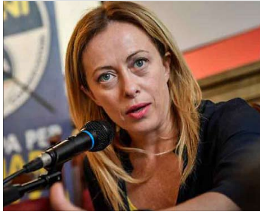
اليمن المتطرف يستثمر في الفاجعة

مرتعبون من أزمة السيارات وعلامات الركود في أواخر عام 2019... وماذا ستقول اليوم؟ وقد قررت الحكومة أن تضع جانباً طوطم توازن الميزانية حتى تتمكن من مساعدة العائلات والصناعات! إن أنجيلا ميركل في نهاية ولايتها، ولن تسعى للحصول على ولاية أخرى، وأملنا أن تبقى في التاريخ باعتبارها السيدة التي أنقذت أوروبا، وتبنت شعار توماس مان (أريد ألمانيا أوروبية وليس أوروبا الألمانية) ولا سيما القادة التي ساهمت في دهنه. ولكن، لماذا إذن "التيين" للحظة؟ ينسى الكثيرون السيرة الذاتية، والتكوين السياسي والثقافي للشخص، فضلاً عن الحالة الذهنية لـ "موتي" الكبيرة، الأم الخائفة التي تدير الدولة مثل ربة منزل شوابية" بحكمة (قالت أنجيلا)، إنه حذر تعود على تقييم الخيارات قبل اتخاذ المبادرة، وبناء حلول وسط شاق، واتخاذ القرار في النهاية، وفي بعض الأحيان مناقضة ومفاجئة للجميع. فضلاً عن أنها ليست المرة الأولى؛ لهذا يتق شعبيها بها... لقد أظهرت ذلك في الأسابيع الأخيرة، بانتظارها أكثر من اللازم، قبل أن تقتنع بأن الوفاء سيؤثر فعلاً على ألمانيا.