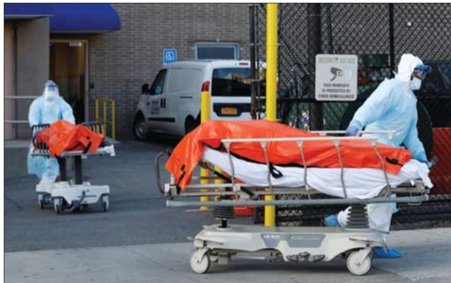
نقل جثامين المتوفين إلى شاحنة لاجل في مدينة نيويورك

وقال كومو "جزء مني يرغب في أن تكون وصلنا الذروة -فقطياً- العمل، لكن هناك جزء آخر مني يقول من الجيد أننا لم نبلغ الذروة لأننا غير مستعدين لها بعد" سجلت ولاية نيويورك السبت عدداً قياسياً بلغ 630 وفاة بالفيروس خلال 24 ساعة تضاف إلى الحصيلة المسجلة قبل يوم وإصابة 2935 وفاة. أما مدينة نيويورك فقد سجلت 63 ألف و306 حالة مؤكدة بالفيروس و2624 وفاة.