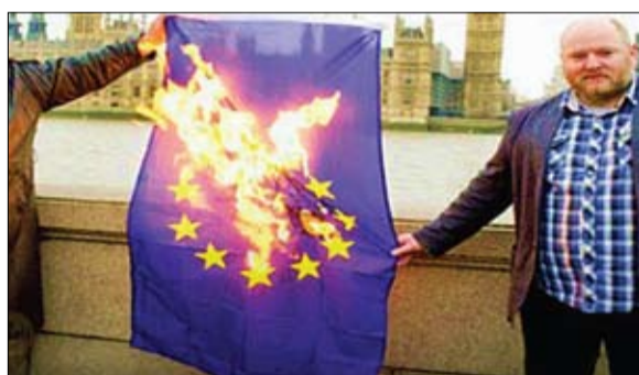
إيطاليون يحرقون العلم الأوروبي لتعاضد الاتحاد الأوروبي عن مساعدتهم