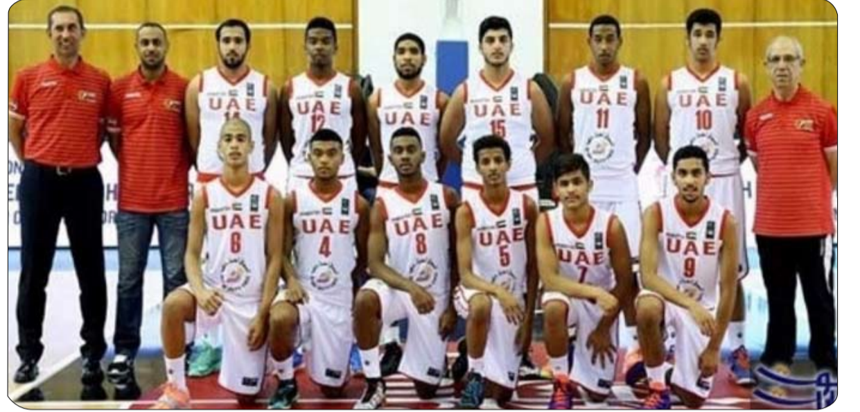
اتحاد السلة يعتمد التحول الرقمي الكامل في كافة الممارسات والأنشطة