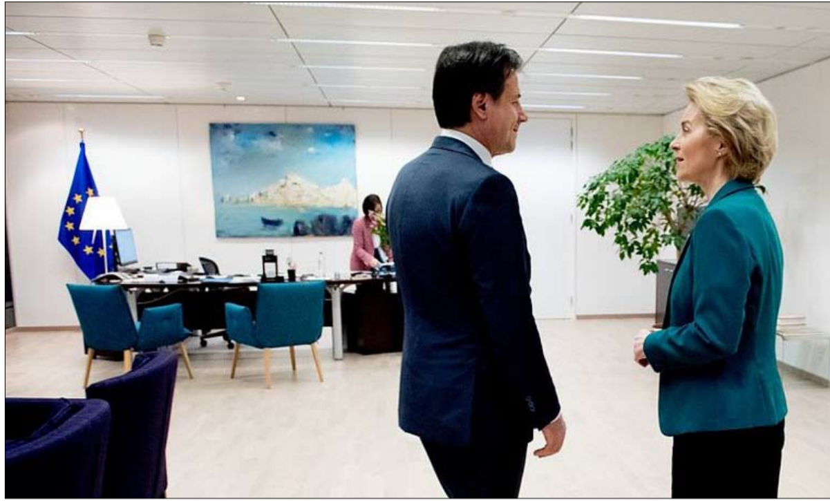
التضامن الأوروبي في اسوا لحظات