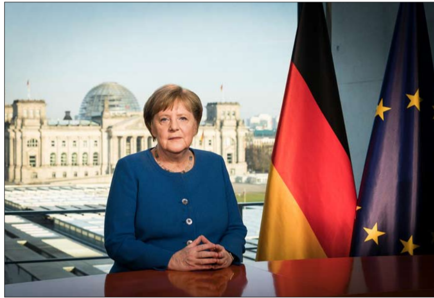
صرامة ميركل والمحنة الإيطالية

يجب أن نعتبر أن الألمان، بحكم طبيعتهم، وبسبب التاريخ الحديث، حساسون لأقل ترنج لاقتصادهم... إنهم أصلاً