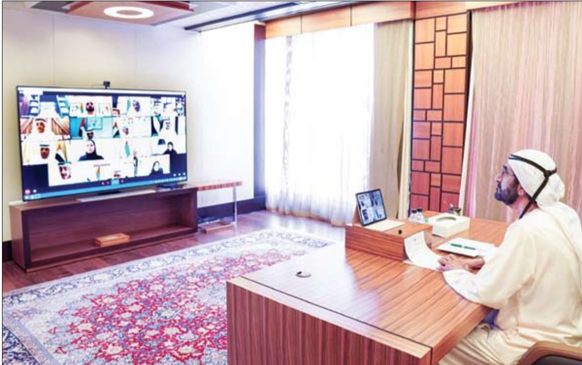
محمد بن راشد خلال ترؤسه اجتماع مجلس الوزراء عن بعد، (أوم)

أكد صاحب السمو الشيخ محمد بن راشد آل مكتوم نائب رئيس الدولة رئيس مجلس الوزراء حاكم دبي رعاه الله، أن دولة الإمارات ماضية في تحقيق تطوراتها ومشاريعها الوطنية وفق ما تم التخطيط له، واستمرار العمل لتوفير أرقى سبل جودة الحياة لسكانها ومواطنيها، من خلال الخدمات والمبادرات النوعية وذات القيمة المضافة في مختلف القطاعات، بهدف إحداث تأثير إيجابي وحقيقي في الحياة اليومية للمواطن. جاء ذلك خلال ترؤس سموه صباح أمس اجتماع مجلس الوزراء والذي عقد بتقنية الاتصال المرئي عن بعد، حيث قال سموه: فخورون بالبرونة والجاهزية التي تتعامل بها حكومة الإمارات مع التطورات.. خدماتنا مستمرة وعلى مدار الساعة.