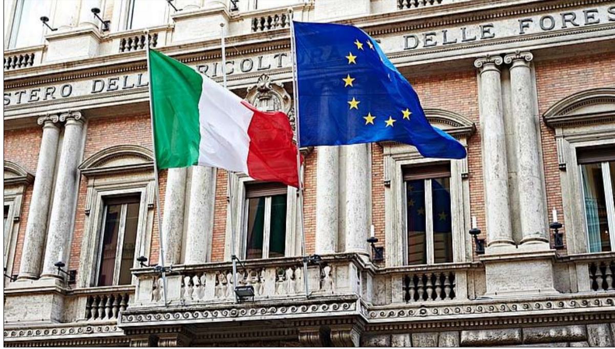
حرق العلم الأوروبي في إيطاليا

هناك خطر كبير من أن تتسع الجبهة المعادية لأوروبا في ألمانيا، وهي أخطر من الشعبوية الإيطالية