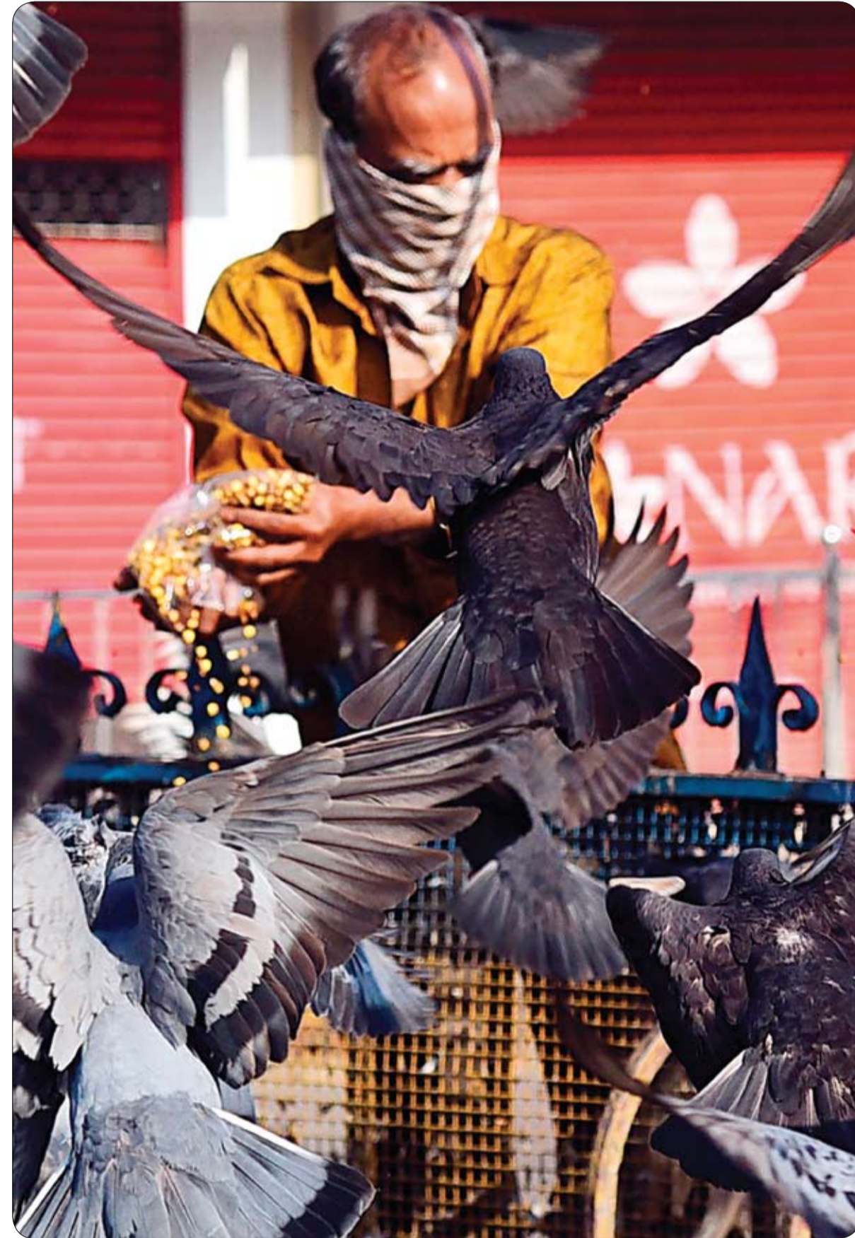
رجل يرتدي قناع وجه يعطّم الحمام أثناء الإغلاق الذي تفرضه الحكومة الهندية كإجراء وقائي ضد انتشار فيروس كورونا.

وجه الرئيس الأمريكي، دونالد ترامب، توبيخاً لإحدى المراسلات خلال طرحها سؤالاً أثناء المؤتمر الصحفي اليومي لجلسة الأزمة بشأن فيروس كورونا في البيت الأبيض. وأظهر مقطع فيديو لمراسلة شبكة سي بي إس نيوز الأمريكية، ويجيا جيانغ، وهي تطرح على ترامب أن "جاري كوشتر تحدثت أن فكرة المخزون الفيديرالي كان من المفترض أن يكون مخزوناً. ليس من المفترض أن تكون مخزونات الولايات التي تستخدمها بعد ذلك، كم سألته: ماذا يعني كوشتر بالضبط بذلك؟" بي إس بالقول: "مستكث. كلمة كوشتر (لدينا) تعني الولايات المتحدة"، لتوجه المراسلة حديثها إلى ترامب مجدداً "ماذا تفعل الحكومة مع المخزون الفيديرالي؟" وقال ترامب: "إنه سؤال بسيط. وتحويلين جعله يبدو سيئاً للغاية. يجب عليك أن تخجلي من نفسك. أنت تعرفين ذلك، يجب أن تخجلي. إنه سؤال بسيط، قال لنا المخزون الفيديرالي واحتياجات الولايات" ثم عاد ترامب ورد مجدداً: "لنا" يعني لليد. (ولدينا) تعني الولايات لأنها جزء من البلاد. لا تجعل الأمر يبدو سيئاً، كما اتهمها بطرح سؤال "بئيرة سيئة وأصر على أنه قدم إجابة مثالية".