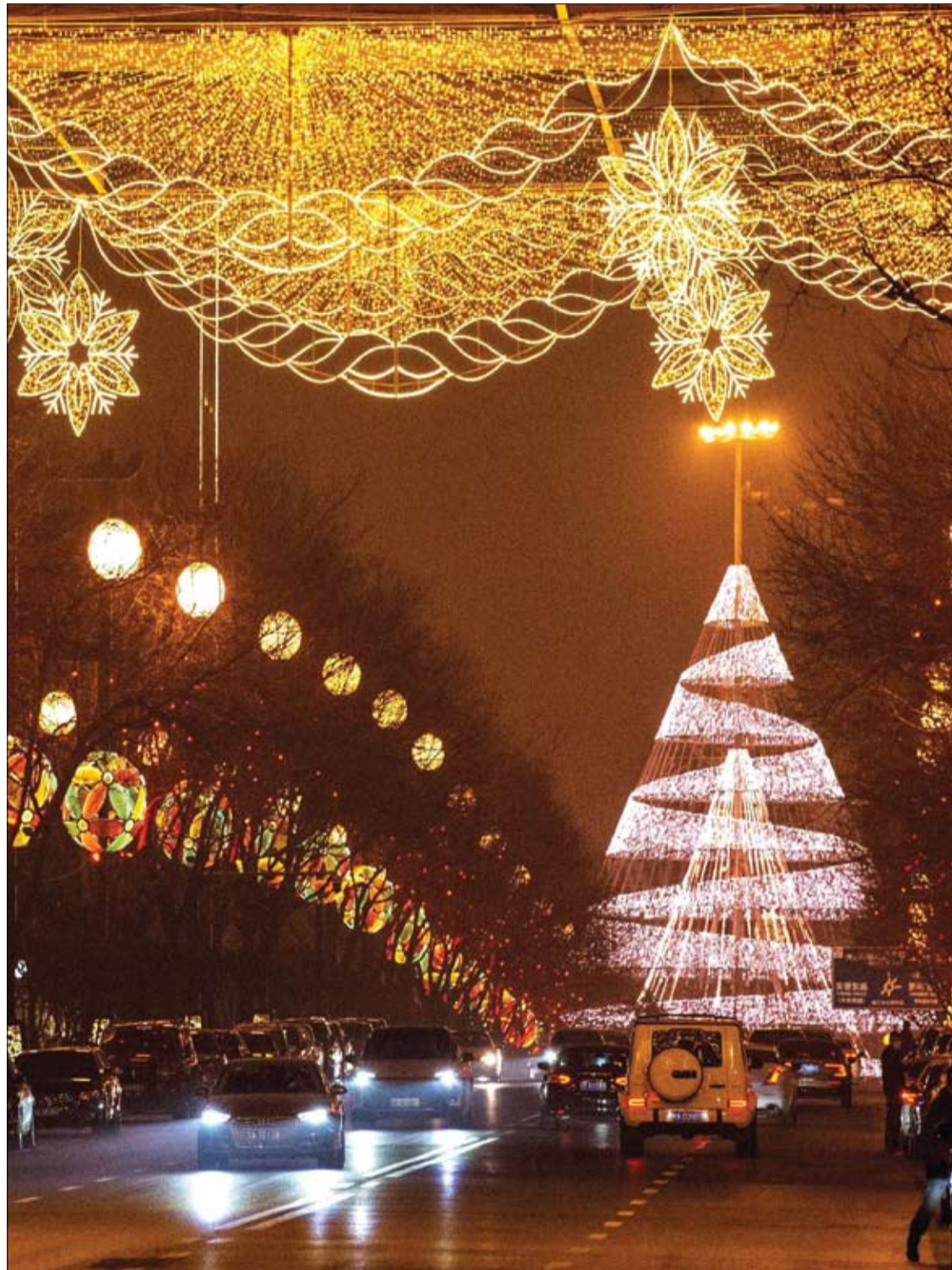
زخارف وزينة في مدينة شيان بمقاطعة شنشي شمال الصين مع اقتراب السنة القمرية الجديدة عام الثور.

ويقترح المؤلفون أن الأبحاث المستقبلية يمكن أن تختبر العلاقة بين القهوة وأمراض الكبد مع مزيد من التحكم في كمية القهوة المستهلكة. ويقترحون أيضا التحقق من صحة النتائج في مجموعات أكثر تنوعا من الناس.