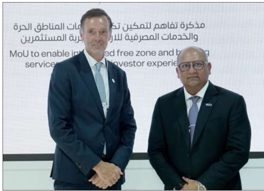
مذكرة تفاهم لتمكين خدمات المناطق الحرة والخدمات المصرفية للراغبين في تجربة المستثمرين MoU to enable integrated free zone and banking services for investor experience

أسرع مراكز السفر والتجارة نمواً في العالم، وشكلت فعالية «اصنع في الإمارات»، منصة مثالية لتبسيط الضوء على هذه القدرات الهائلة، وربط الجيل الجديد من الشركات الصناعية والتجارية بالفرص التي توفرها في أبوظبي. وشملت أبرز الإعلانات خلال فعالية «اصنع في الإمارات 2026»، اتفاقية مع «Wio Bank»، تهدف إلى تعزيز التعاون لتسهيل وتسريع فتح الحسابات المصرفية لشركات المنطقة الحرة، من خلال عمليات تسجيل مشتركة ومزايا تسويقية متبادلة، إلى جانب اعتماد Wio، كشريك مصرفي مفضل لعملاء المنطقة الحرة لطائرات أبوظبي، ومدكرة تفاهم مع مركز أبوظبي للأغذية لتطوير مركز موحد لتجميع العمليات اللوجستية والتجارية، بما يساهم في تسهيل حركة المنتجات الغذائية عبر المنطقة وخارجها، وبناء سلاسل إمداد غذائية أكثر ترابطاً وموثوقية وقابلة للتوسع. وتسهم مشاركة المنطقة الحرة لطائرات أبوظبي في فعالية «اصنع في الإمارات 2026»، في تعزيز حضور وجهاتها أمام المستثمرين الصناعيين وشركات سلاسل الإمداد في أبوظبي والأسواق الإقليمية والعالمية.