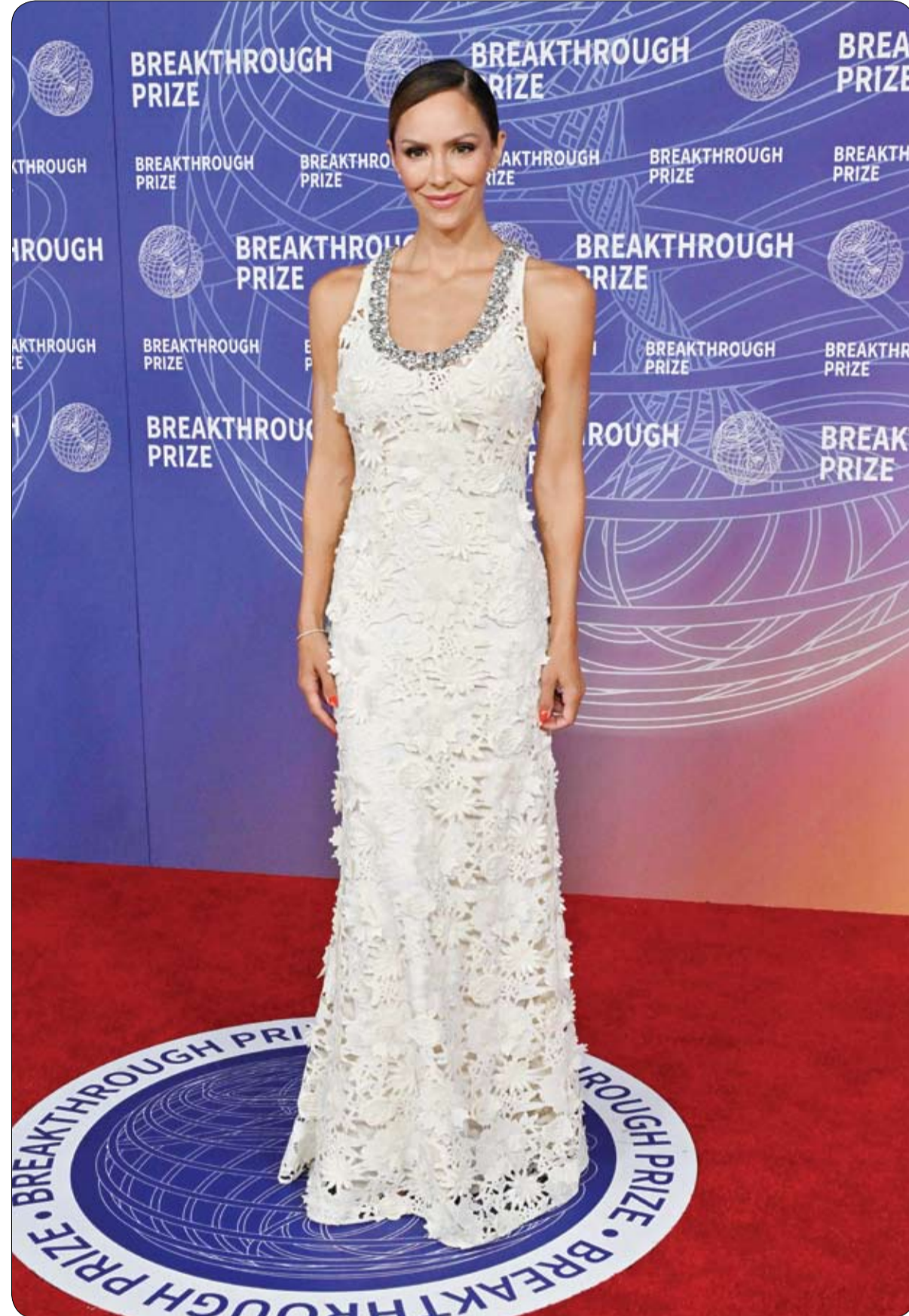
الممثلة الأمريكية كاثرين ماكفي لدى حضورها حفل توزيع جوائز بريكترو الثاني عشر في باركر هانغار في سانتا مونيكا، كاليفورنيا، ١٠

لجأت سيدة أمريكية متزوجة من عراقي إلى سفارة بلادها في بغداد بعد تعرضها للضرب على يد زوجها، وفقاً لما نقلته قناة "الشرقية" العراقية عن مصادر أجنبية. وقالت المصادر إن السيدة تحمل الجنسية الأمريكية وقد طلبت من السفارة الأمريكية في بغداد توفير الحماية لها بعد تعرضها لاعتداء من قبل زوجها العراقي. وأشارت أنها ألقى هربت من بيت زوجها في بغداد وبرفقها ابنتها البالغة من العمر 9 أشهر ولجأت لسفارة بعد تعرضها لاعتداء جسدي وضرب مبرح.