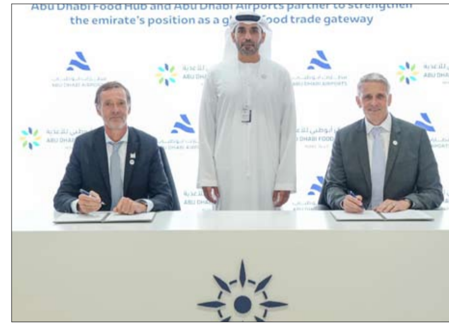
Abu Dhabi Food Hub and Abu Dhabi Airports partner to strengthen the emirate's position as a global food trade gateway

سجلت الإمارة زيادة قياسية بنسبة 36% في التجارة غير النفطية خلال العام الماضي 2025، وذلك بعد نمو الناتج المحلي غير النفطي بنسبة 6.8% خلال الأشهر التسعة الأولى من العام نفسه، مع تحقيق قطاع النقل والتخزين نمواً بنسبة 13.8% في الربع الثالث وحده. وشهد النصف الأول من العام ارتفاعاً يقارب 50% في تأسيس