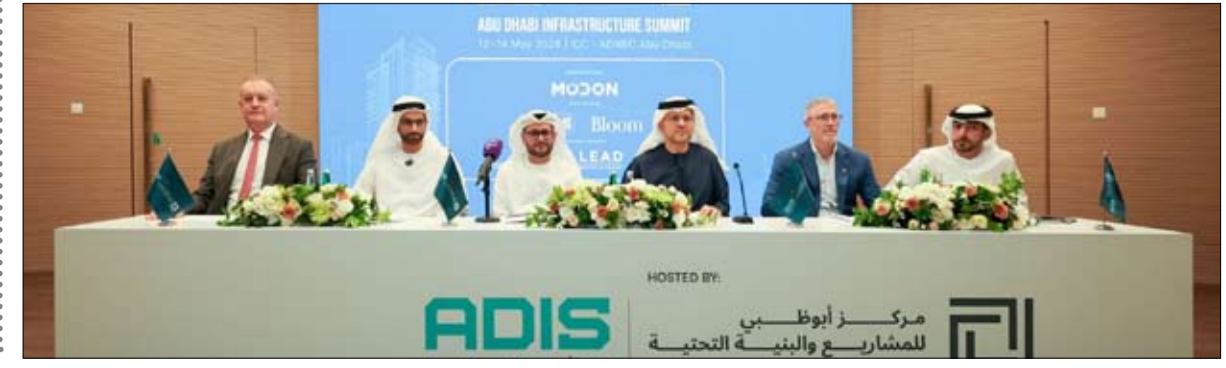
ADIS MOON LEAD

أعلن مركز أبوظبي للمشاريع والبنية التحتية البرنامج الرسمي للنسخة الثانية من قمة أبوظبي للبنية التحتية، أديس 2026، التي تنطلق من 12 إلى 14 مايو الجاري في مركز أبوظبي الوطني للمعارض «أدنيك». وتعد القمة هذا العام تحت شعار «التطور الحضري: رؤية جديدة للمدن، ومفهوم جديد لحياتنا»، حيث تغطي أجندتها مختلف مراحل تطوير المدن، بدءاً من الرؤية الحكومية العليا، وصولاً إلى الأنظمة الفنية والتجارية الداعمة لتنفيذ المشاريع على نطاق واسع. وجاء الإعلان عن برنامج القمة خلال مؤتمر صحفي، عقد أمس الأول، في مقر دائرة البلديات والنقل. ومن المتوقع أن تستقطب القمة أكثر من 7 آلاف متخصص وقائد قطاع، إلى جانب أكثر من 100 متحد و75 جهة عارضة تمثل مختلف حلقات سلسلة القيمة في قطاع البنية التحتية، وذلك بدعم شبكة واسعة من الشركاء من القطاعين الحكومي والخاص، فيما يشرف مركز أبوظبي للمشاريع