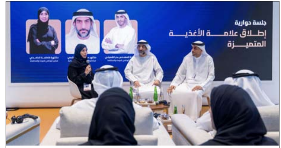
جلسة حوارية إطلاق علامة الأغذية المتميزة

•• أبوظبي-وام: أطلق مجلس أبوظبي للجودة والمطابقة، بالتعاون مع هيئة أبوظبي للزراعة والسلامة الغذائية، علامة الأغذية المتميزة Premium Mark، لمنتجات لحوم الدجاج المبردة المنتجة محلياً، خلال مشاركته في معرض «اصنع في الإمارات 2026»، ضمن إستراتيجية الحياة الصحية الهادفة إلى تعزيز جودة المنتجات الغذائية ورفع تنافسية القطاع الغذائي في أبوظبي ودولة الإمارات. يأتي إطلاق العلامة ضمن برنامج متكامل لتطوير منظومة مطابقة متقدمة لمنتجات لحوم الدجاج المبردة،