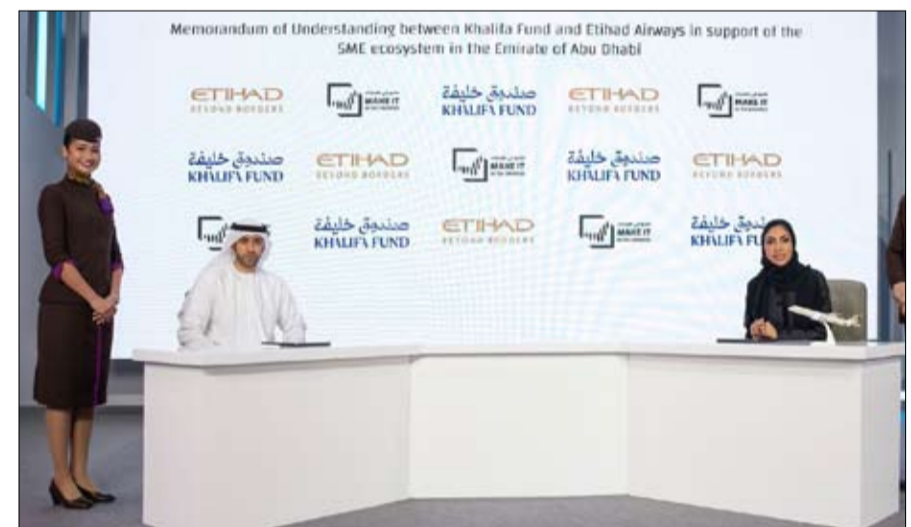
Memorandum of Understanding between Khalifa Fund and Etihad Airways in support of the SME ecosystem in the Emirate of Abu Dhabi

اللوجستية المحلية ويدعم التوسع العالمي لها. في عام 2025، تعاملت شركة الاتحاد للشحن مع بضائع بقيمة تزيد عن 120 مليار درهم، رابطة بذلك الصناعة الإماراتية بسلاسل الإمداد العالمية عبر قطاعات تشمل التكنولوجيا والأدوية والمواد سريعة التلف. ووقعت الاتحاد للطيران اتفاقيتين إضافيتين، تجدد الأولى منها مشاركة الاتحاد في برنامج القيمة