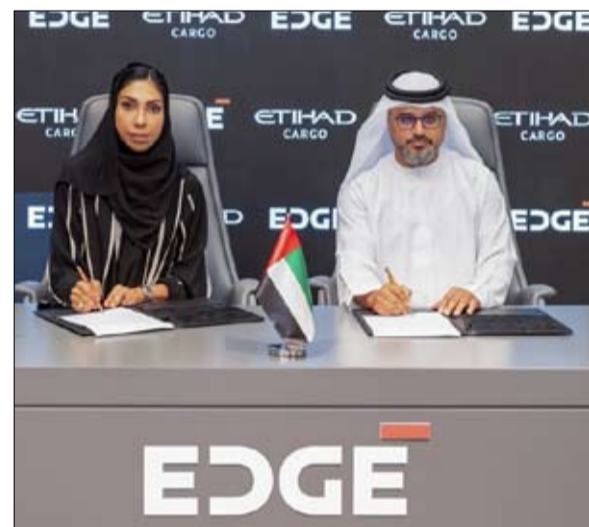
EDGE ETIHAD CARGO

الإمداد لشركة الاتحاد للطيران، والوفاء بمعايير صناعة الطيران. وتعزز الاتفاقيات مساهمة الاتحاد للطيران في البنية الصناعية والاقتصادية لدولة الإمارات، فمن خلال برنامجها الوطني للمحتوى المحلي، خصصت الاتحاد للطيران 8.3 مليار درهم للموردن المحليين على شهادة القيمة المحلية المضافة في عام 2025، ما أتاح التعاون مع أكثر