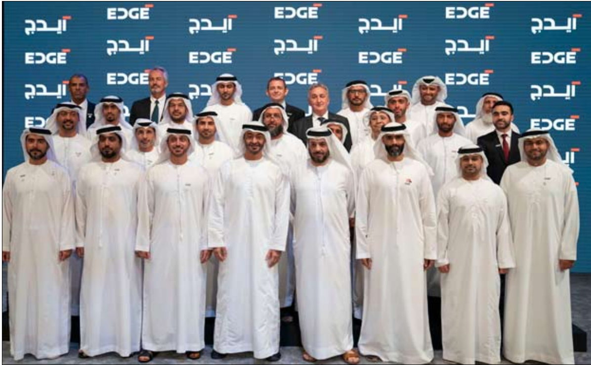
شهد إطلاق مجموعة التكنولوجيا المتقدمة «إيدج»