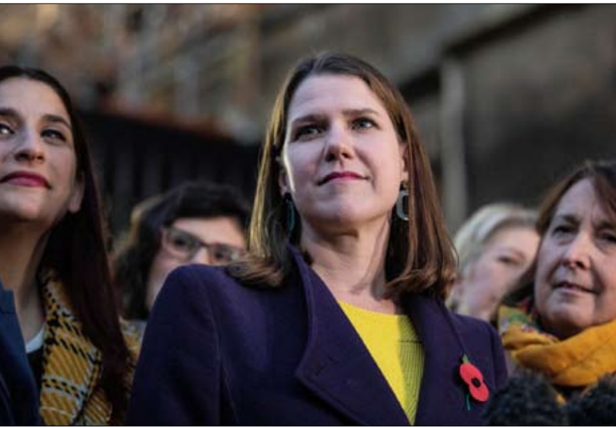
زعيمه الليبراليين الديمقراطيين جو سوينسون