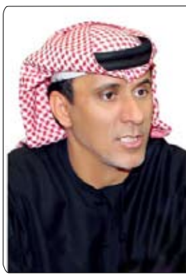
البطولة "أمس" وهي المرة الأولى التي يشارك فيها ناشئونا

في منافسات فئة الشباب تمهيدا لتصعيدهم للفئة الأعلى. وشمن سعادة محمد بن ثعلوب الدرعي، رئيس اتحاد الصراعة والجودو تفوق منتخبنا الوطني لفئة الشباب والناشئين في البطولة العربية للجودو والكاتا التي استضافها الاتحاد الأردني للجودو بإشراف الاتحاد العربي للجودو، والتي شهدت تألق منتخبنا الوطني للجودو وللشباب العربي، الذي واصل تألقه بعد بطولتي آسيا والخليج لضييف إنجازا