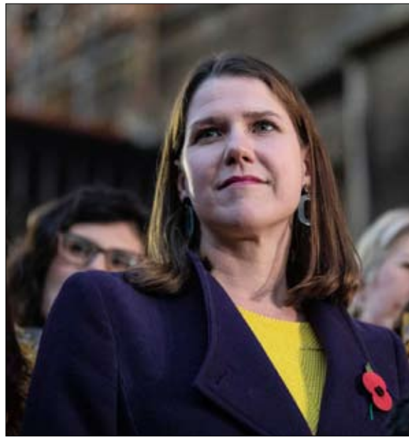
زعيم حزب العمل جيريمي كوربين