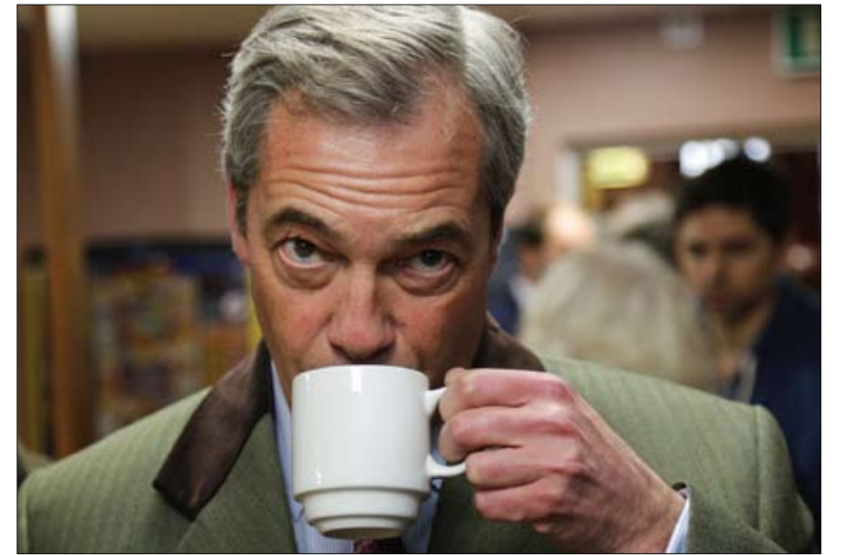
فارج... النائب الأوروبي وزعيم حزب البريكسيت

ويرفضه حزب المحافظين بشكل قاطع، ويدعم فكرة أن استفتاء عام 2014 كان "حداً فريداً، يتم تنظيمه مرة واحدة في كل جيل".