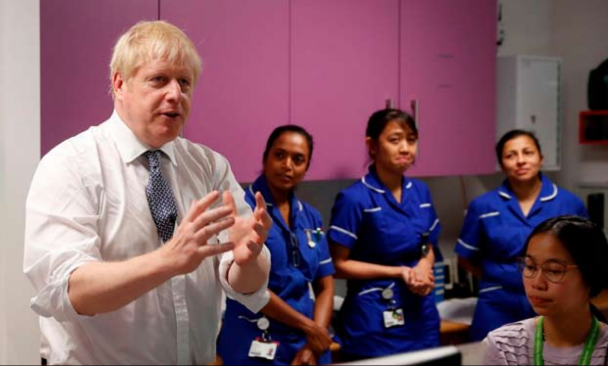
رئيس الوزراء البريطاني بوريس جونسون