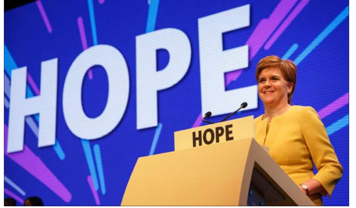
رئيسة وزراء اسكتلندا وزعيمة القوميون نيكولا ستورجيون