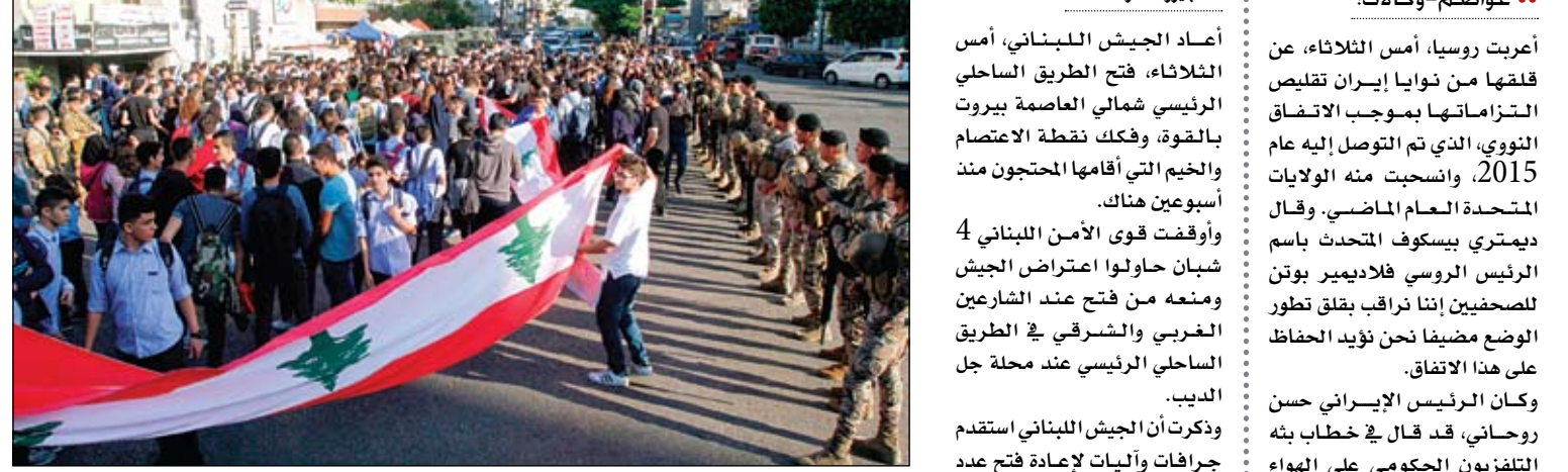
طلاب لبنانيون يتظاهرون في مدينة صيدا

الدين العام وإقرار قانون يحقق العدالة الضريبية. أما المهمة الثانية فتتمثل بإجراء انتخابات نيابية مبكرة تنتج سلطة تمثل الشعب. والمهمة الثالثة القيام بحملة جديده المناهضة الفساد، من ضمنها إقرار قوانين استقلالية القضاء واستعادة الأموال العامة المنهوبة. ليسان، وحددت المجموعة، وهي إحدى الجهات المنظمة للاحتجاجات التي انطلقت في منتصف أكتوبر الماضي، المطالب بتشكيل حكومة مصغرة، من خارج قوى السلطة. وقالت إن الحكومة المصغرة عليها أن تقوم بثلاث مهام محددة هي: الأولى إدارة الأزمة المالية وتخفيف عبء