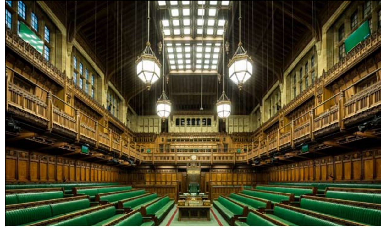
لن ستكون الأغلبية في وستمنستر

يمكن أن يكلف خطاب بوريس جونسون المؤيد بشدة للبريكسيت عشرة نواب للمحافظين في اسكتلندا