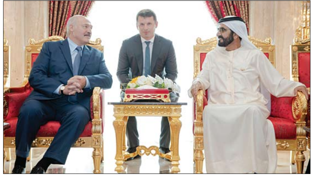
محمد بن راشد خلال استقباله رئيس بيلاروسيا (وام)

الرياض-وام: التقى صاحب السمو الشيخ محمد بن زايد آل نهيان ولي عهد أبوظبي نائب القائد الأعلى للقوات المسلحة، أمس صاحب السمو الملكي الأمير محمد بن سلمان بن عبد العزيز آل سعود ولي العهد نائب رئيس مجلس الوزراء وزير دفاع المملكة العربية السعودية الشقيقة، وبحث الجانبان - خلال اللقاء الذي جرى في الديوان الملكي بالرياض - العلاقات الأخوية بين دولة الإمارات العربية المتحدة والمملكة العربية السعودية على المستويات كافة إضافة إلى تطورات ملف اليمن والسبل الكفيلة بمساعدة الشعب اليمني الشقيق لتحقيق تطلعاته المشروعة في التنمية والسلام. (التفاصيل ص2)