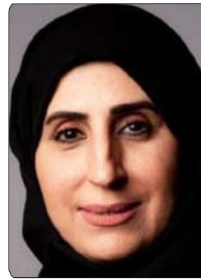
الدورة، إلى جانب فوزها بالمركز الأول في بطولة ألعاب التحدي