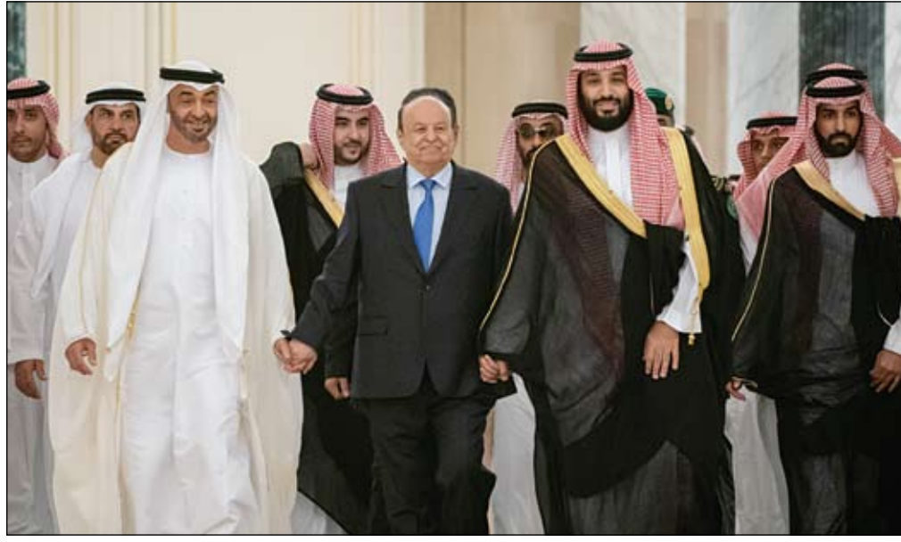
محمد بن زايد ومحمد بن سلمان وعبد ربه منصور خلال حضورهم توقيع اتفاق الرياض

•• سقطرى-وام: افتتحت هيئة الهلال الأحمر الإماراتي، مرحلة جديدة من مشاريعها التنموية في أرخبيل سقطرى اليمني، تضمنت 22 وحدة سكنية ومدرسة، بناء على توجيهات القيادة الرشيدة، ومتابعة سمو الشيخ حمدان بن زايد آل نهيان ممثل الحاكم في منطقة الظفرة رئيس الهيئة. وكانت الهيئة، قد بدأت تنفيذ توجيهات القيادة الرشيدة، بإنشاء عدد من المشاريع التنموية الحيوية، في أعقاب الأعاصير المتتالية التي ضربت الأرخبيل، خلال الأعوام الماضية. وقام وفد من هيئة الهلال الأحمر الإماراتي، يرافقه عدد من المسؤولين اليمنيين، بافتتاح جانب من المشاريع التنموية في سقطرى، والتي تضمنت تدشين مرحلة جديدة من مدينة الشيخ زايد، اشتملت على 22 وحدة سكنية. (التفاصيل ص6)