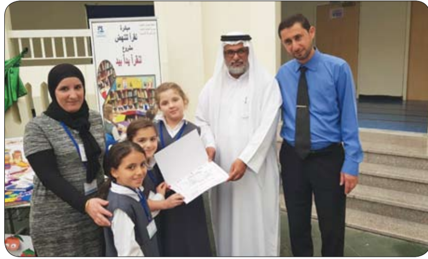
بمشاركة مئة ألف طالب... كرنفال القراءة يختتم فعالياته