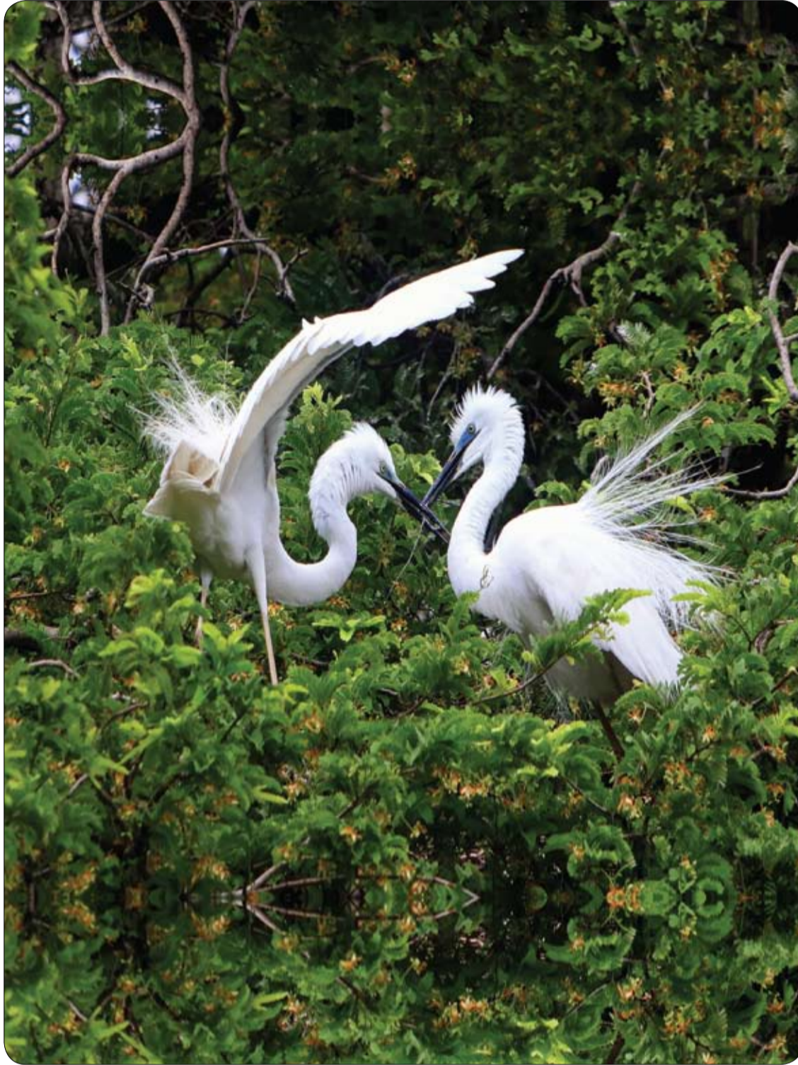
اشتان من طيور البلشون يقفان على شجرة في أجمبر بولاية راجستان الهندية الغربية.