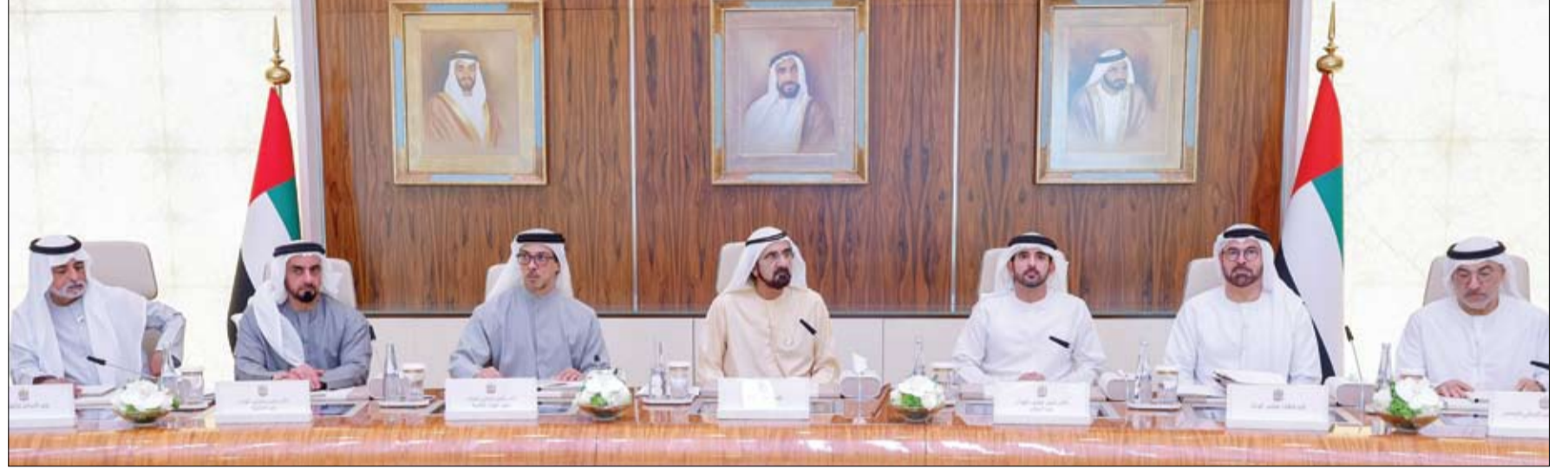
محمد بن راشد خلال ترؤسه اجتماع مجلس الوزراء بحضور منصور بن زايد وحمدان بن محمد (وام)

عطلة القطاع الخاص بمناسبة يوم عرفة وعيد الأضحي من 26 حتى 29 مايو الجاري دبي-وام: أعلنت وزارة الموارد البشرية والتوطين، أن الفترة من 26 مايو الجاري الموافق يوم الثلاثاء، وحتى 29 من الشهر ذاته الموافق يوم الجمعة، عطلة رسمية مدفوعة الأجر لجميع العاملين في القطاع الخاص في الدولة، بمناسبة وقفة عرفة وعيد الأضحي المبارك. يأتي ذلك تنفيذاً لقرار مجلس الوزراء بشأن العطلات الرسمية في الدولة. الإمارات ترسخ ريادتها العالمية في اعتماد الأدوية المتكبرة لتعزيز صحة المجتمع أبوظبي-وام: تقدم دولة الإمارات نموذجاً رائداً في اعتماد الأدوية والعلاجات الطبية الحديثة التي ترتقي بتجربة المرضى، وتسهم في تسريع وزيادة فرص علاج أخطر الأمراض وأخطرها على صحة الإنسان. ورست الإمارات، خلال العام الجاري، تقوفاً في هذا المجال إذ تحولت إلى منصة عالمية للابتكار الطبي والتجارب العلاجية المتقدمة، ما يعكس التزامها المستمر بصحة المجتمع ويعزز جاذبية قطاعها الصحي على المستوى الإقليمي والدولي. وفي هذا السياق، أعلنت مؤسسة الإمارات للدواء، عن اعتماد عقار باكسفندي (Baxfendy) المبتكر لارتفاع ضغط الدم، والذي يستخدم بتركيزيه 1 ملغ و2 ملغ، كخيار علاجي إضافي إلى جانب الأدوية الخافضة للضغط لدى المرضى الذين لا يتمكنون من السيطرة على مستويات ضغط الدم لديهم بشكل كاف. (التفاصيل ص 8)