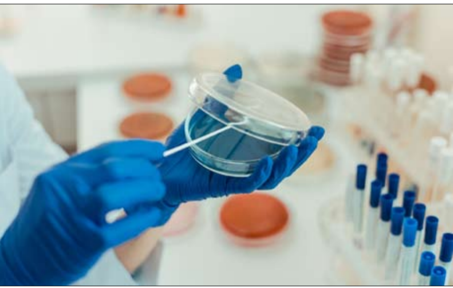
المتممين بالمشاركة في الدورة الرابعة إلى تقديم طلباتها الأولية خلال الفترة بين الأول من يونيو و5 يوليو المقبل، على أن يتم لاحقاً استكمال الجدول الزمني المعتمد للبرنامج.

تقدم دولة الإمارات نموذجاً رائداً في اعتماد الأدوية والعلاجات الطبية الحديثة التي تترقي بتجربة المرضى، وتساهم في تسريع وزيادة فرص علاج أمراض الأمراض وأخطرها على صحة الإنسان. ورسخت الإمارات، خلال العام الجاري، تفوقها في هذا المجال إذ تحولت إلى منصة عالمية للابتكار الطبي والتجارب العلاجية المتقدمة، ما يعكس التزامها المستمر بصحة المجتمع ويعزز جاذبية قطاعها الصحي على المستوى الإقليمي والدولي. وفي هذا السياق، أعلنت مؤسسة الإمارات للدواء، عن اعتماد عقار "باكسفندي" (Baxfendy) المبتكر لارتفاع ضغط الدم، والذي يستخدم بتركيزيه 1 ملغ و2 ملغ، كخيار علاجي إضافي إلى جانب الأدوية الخافضة للضغط لدى المرضى الذين لا يتمكنون من السيطرة على مستويات ضغط الدم لديهم بشكل كاف. وتعد الإمارات أول دولة على مستوى العالم تمنح الموافقة لهذا العلاج، المطور من قبل شركة "أسترازينيكا" (AstraZeneca)، في خطوة تعزز كفاءة الرعاية الدوائية، خاصة في مجال أمراض القلب والأوعية الدموية. ويساعد "باكسفندي" على خفض ضغط الدم من خلال تثبيط إنزيم مسؤول عن إنتاج هرمون الألدوستيرون في الجسم، مما يوفر مقارنة علاجية تستهدف