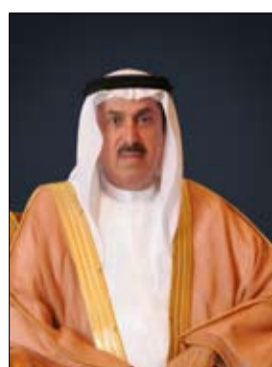
الأمين العام المساعد لشؤون رئاسة المجلس. تعد الزيارة

امتداداً لمسار متنامٍ من العلاقات البرلمانية بين المجلس الوطني الاتحادي والبرلمان الأوروبي، وتجسيدا لحرص الجانبين على تعزيز قنوات التواصل والتعاون المؤسسي، بما يخدم المصالح المشتركة. وتكتسب هذه الزيارة أهمية خاصة في ضوء الزخم المتصاعد الذي تشهده العلاقات الإماراتية - الأوروبية على مختلف المستويات، لاسيما بعد الزيارة الرسمية التي قامت بها معالي روبيرتا ميتسولا رئيسة