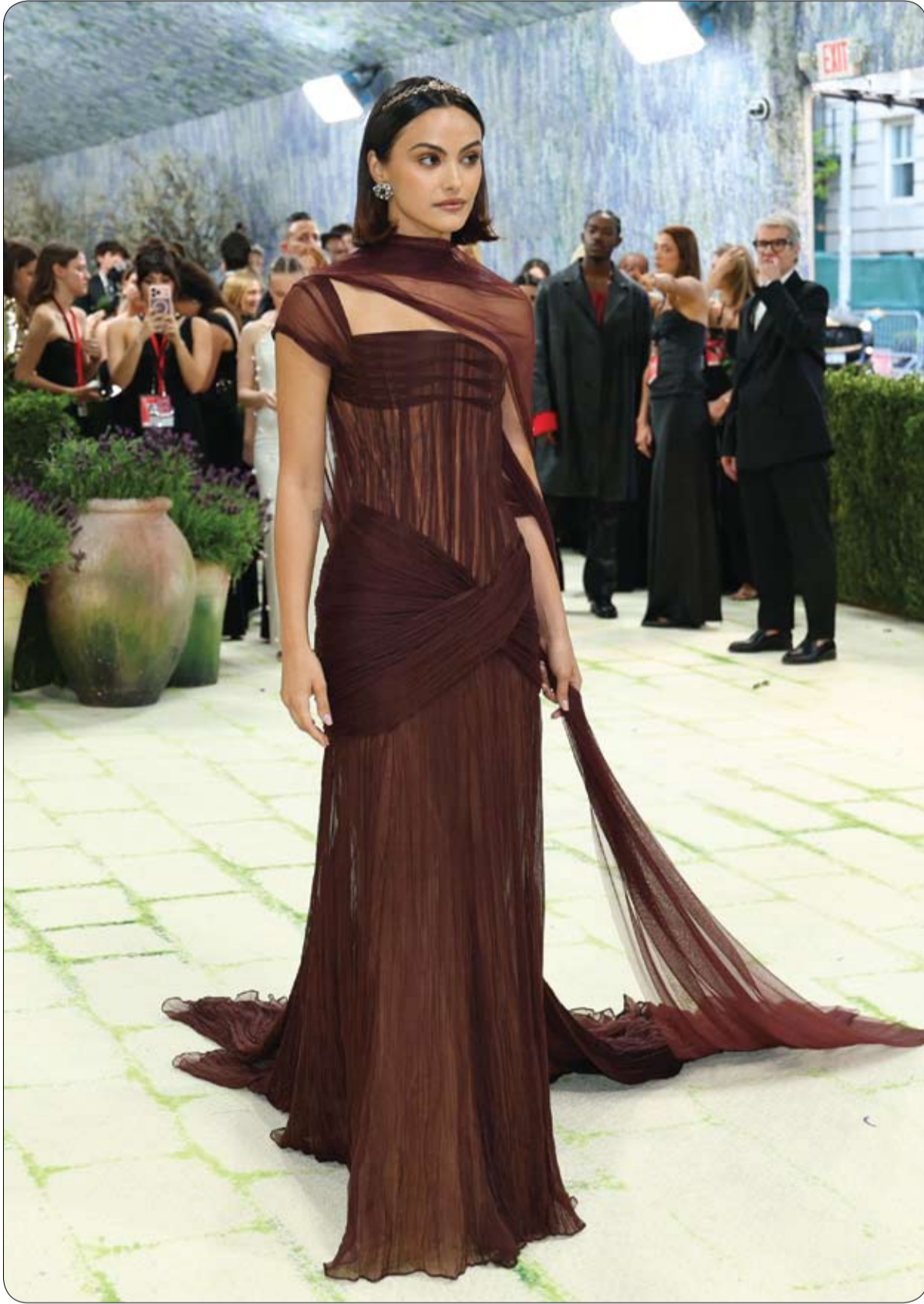
الممثلة الأمريكية كاميليا مينديز لدى وصولها إلى حفل ميت غالا لعام 2026 الذي يحتفي بـ «فن الأزياء»

عثر زوار مقبرة في مدينة شانلي أورفا بجنوب تركيا، على 21 جينياً في علب بلاستيكية داخل حاوية متروكة في مقبرة. وأظهر مقطع فيديو من داخل مقبرة "يني أسري"، الحاوية وهي على شكل برميل بلاستيكي متوسط الحجم وقد ترك فوق جدار، لتتساقط منه علب بلاستيكية بعد دفعه من قبل أحد الأشخاص، ليتضح محتوى تلك العلب. وقالت تقارير محلية إن الأشخاص الذين شاهدوا محتوى الحاوية، أبلغوا الشرطة التي بدأت إجراءات التحقيق في الحادثة. وأضافت أن الكشف الأولي على العلب البلاستيكية في الموقع، بين أنها تحمل أسماء مستشفيات وأطباء. وأشار الفيديو ردود فعل غاضبة في مواقع التواصل الاجتماعي واتهامات بالإهمال وعدم احترام الإنسان وفق تدوينات في موقع "إكس". وأصدرت محافظة شانلي أورفا، بياناً قالت فيه إن فرقاً مختصة أجرت تحقيقات ميدانية في حادثة التخلص غير اللائق من بعض الأجنة والأطراف، والتي يُعتقد أنها خضعت لعمليات طبية. وأضافت أن القضية أحيلت إلى السلطات القضائية لتوضيح ملاسباتها وتحديد المسؤولين عنها، وتتابع المحافظة الوضع من كذب، كما ستخضع القضية لمراجعة إدارية شاملة.