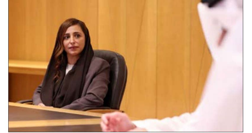
خلال اجتماعها مع رئيس دائرة الموارد البشرية