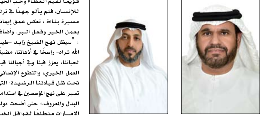
زايد "طيب الله ثراه"، ونجدس مآثره الخالدة في رعاية الإنسان، ومسيرته الحافلة بالخير والإحسان، فقد أرسى "طيب الله ثراه" منهجاً

قال سعادة الدكتور محمد مطر الكعبي رئيس الهيئة العامة للشؤون الإسلامية والأوقاف إن مسيرة المغفور له الشيخ زايد بن سلطان آل نهيان "طيب الله ثراه" الإنسانية تعد سجلاً حافلاً بالعطاء والبذل، وتاريخاً مشرفاً تتفخر به الأجيال ومرجعاً تتعلم منه معاني القيم، وبذل المعروف بروح متسامية وقلوب منشرحة فأعماله الإنسانية راسخة في كل ربوع العالم، رمزاً للتسامح والتعايش وحب الآخرين والوقوف