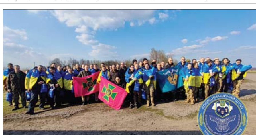
أسرى الحرب الأوكرانيون يقفون لالتقاط صورة بعد تبادل للأسرى مع روسيا.

وقال وزير الخارجية التركي مولود جاويش أوغلو لقناة إيه إكس نيوز في استانبول إن خبير التفريغية الخاصة إن شكري سيزور تركيا قريبا، ربما هذا الأسبوع، مضيفا أن تفاصيل الزيارة سيعلم عنها يوم الأربعاء، وأضاف حان الوقت لاتخاذ خطوات ملموسة. يمكننا خلال زيارة شكري اتخاذ خطوات لتعيين سفيرين. وزار جاويش أوغلو القاهرة الشهر الماضي بعد عشر سنوات من قطع العلاقات الدبلوماسية بين البلدين.