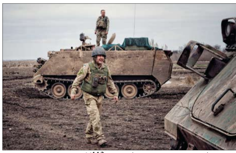
جندي أوكراني يسير بالقرب من ناقلة الأفراد المرمزة M113، في منطقة دونباس.

هجوم مضاد تحدثت عنه مرارا ردا على التوغل الروسي داخل أراضيها، بسبب تسريب وثائق أميركية سرية، وذلك حسبما نقلت شبكة (سي إن إن) عن مصدر مقرب من الرئيس الأوكراني فولوديمير زيلينسكي. وقال مسؤولون أوكرانيون لرويترز إن الوثائق التي ترددت