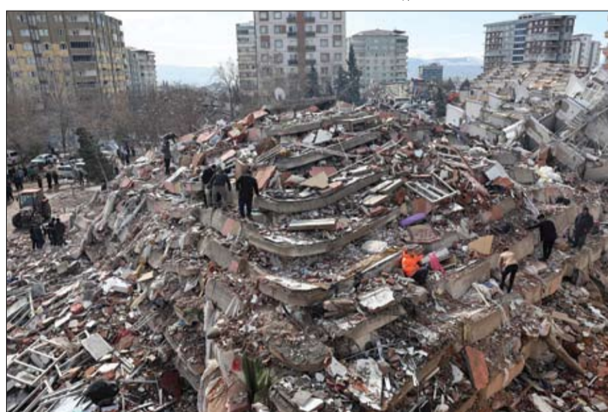
مديون يبحثون عن ناجين تحت أنقاض المباني المنهاره في كهرمانميراس جنوب شرق تركيا. (ا ف ب)

أكثر من خمسة آلاف شخص، بحسب تقارير رسمية جديدة صدرت الثلاثاء، فيما لا يزال عناصر الإنقاذ يحاولون انتشال ناجين من تحت الأنقاض. وفي حصيلة جديدة، أعلنت إدارة الكوارث التركية أمس الثلاثاء، ارتفاع عدد ضحايا الزلزال إلى 3432 قتيلًا و21103 إصابة. وكان نائب الرئيس التركي فؤاد أوقطاي قد أفاد بوقت سابق أن عدد القتلى جراء الزلزال الذي كان مركزه جنوب شرقي بلاده ارتفع إلى 3419، وأن الظروف الجوية القاسية تعرقل توصيل المساعدات إلى المناطق المتضررة وعمليات الإنقاذ. ولاقى ما لا يقل عن 1602 شخص حتفهم وجرح آلاف آخرون في سوريا وسقطوا في محافظات حلب والمدائقية وحماة وريف ادلب وطرطوس الخاضعة لسيطرة النظام، في حصيلة غير نهائية حتى الآن.