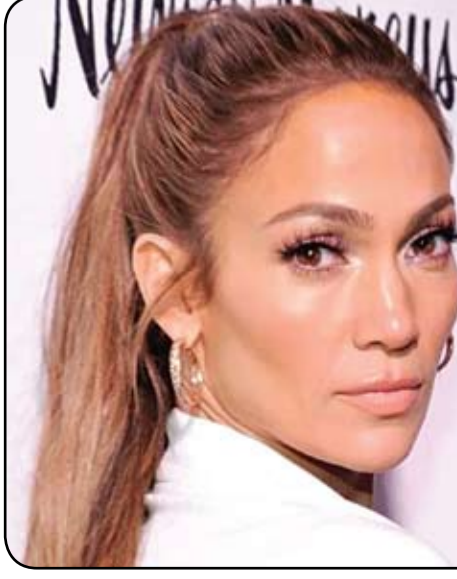
جينيفر لوبيز في حفل الغرامي.

فيما كانت الأضواء تتجه نحو المرشحين الفائزين بجوائز الغرامي بعد طول انتظار، برزت العديد من المحطات اللافتة التي شهدتها الحفل من أبرزها "كمية الحب والانسجام" بين الثنائي جنيفر لوبيز وبين أفليك. فقد شهد الحفل الموسيقي الأضخم تأق لوبيز في جوار أفليك، حتى وحين تركته للصعود إلى المسرح لتقديم جائزة "أفضل ألبوم"، التي حصدها المغني البريطاني هاري ستايلز، إلا أنه بن بدا سعيداً لوجودها معاً وسط الجمهور، الذي كان سعيداً أيضاً برؤية الثنائي الفني معاً. وارادت جنيفر "53 عاماً"، فستاناً أزرق داكناً من دار أزياء "غوثنشي" مخمطاً بالأناس، وزينته بقلاند أناس من دار "بلفغوري"، مع خواتم خطوطها وزفافها الضخمة، فيما بدا زوجها بن أفليك "50 عاماً" متألقاً ببذلة سوداء. وبدت لوبيز رائعة ومتألقة عندما اعلت المسرح وسلمت الجائزة الأولى في الحفلة.