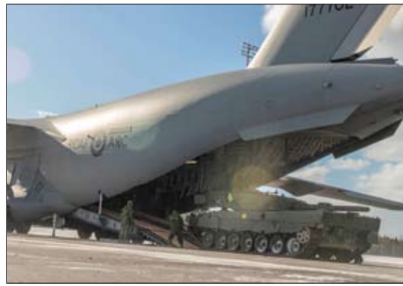
تحميل دبابة ليوبارد 2A4 على سفينة عسكرية كندية لإرسالها إلى أوكرانيا

هجوم في الربيع لاستعادة الأراضي المفقودة، لكنها تنتظر أن يسلمها الغرب ما وعد به من صواريخ بعيدة المدى وببوابات قتال. وقال حاكم منطقة لوغانسك سيرغي غايداي للتلفزيون الأوكراني: تشهد نشر المزيد والمزيد من الاحتياطات الروسية في اتجاهنا، ونشهد إدخال المزيد من العتاد. وأضاف: إنهم يجلبون ذخيرة تستخدم بشكل مختلف عن ذي قبل- لم تعد هناك قصف على مدار الساعة. بدأوا يوفرون (جهدهم).. استعداد الهجوم واسع النطاق، سيستغرق الأمر على الأرجح 10 أيام لحشد الاحتياطات، بعد 15 فبراير نتوقع (هذا الهجوم) في أي وقت. ووصلت الحرب إلى نقطة محورية مع اقتراب الذكرى السنوية الأولى لها، إذ لم تعد أوكرانيا تحقق مكاسب مثلما فعلت في النصف الثاني من عام 2022 وتدفع روسيا بمئات الآلاف من قوات الاحتياط التي حشدتها.