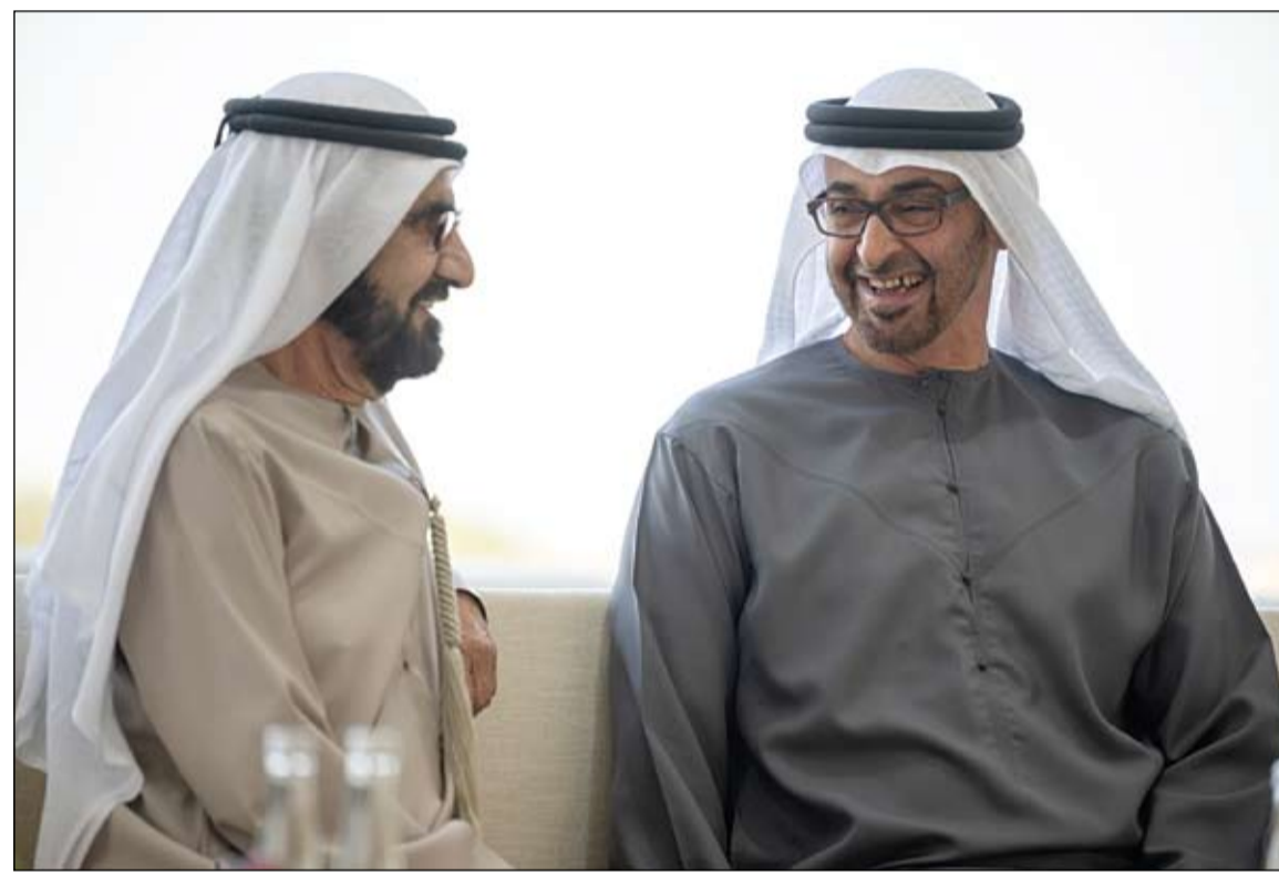
رئيس الدولة خلال استقباله محمد بن راشد

بمباركة صاحب السمو الشيخ محمد بن زايد آل نهيان، رئيس الدولة حفظه الله، أعلن صاحب السمو الشيخ محمد بن راشد آل مكتوم، نائب رئيس الدولة رئيس مجلس الوزراء حاكم دبي رعاه الله، أمس، عن تعديل وزاري في الحكومة الاتحادية. (التفاصيل ص2)