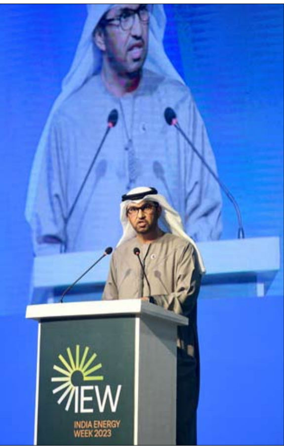
الجابر في أولى جولاته الخارجية

معدلات الازدهار الاقتصادي منذ الثورة الصناعية الأولى، لكن يجب أن يكون هذا الانتقال عملياً وعادلاً. وعند النظر إلى دول الجنوب نجد أن العدالة لم تتحقق إلا بقدر ضئيل حتى الآن، ونحتاج إلى التصدي لهذا بصورة مباشرة، فالتعهدات السابقة بشأن تمويل المناخ التي قطعها العالم كانت إما بمقابل أو لا تتحقق على الإطلاق. ونحن بحاجة للوفاء بهذه التعهدات. وفي الوقت ذاته، علينا العمل على إصلاح المؤسسات المالية الدولية وبنوك التنمية متعددة الأطراف. إننا نحتاج إلى حلول تمويلية بشروط ميسرة للمجتمعات الضعيفة في أنحاء العالم، من أجل تقليل المخاطر، وجذب المزيد من التمويل في القطاع الخاص، وتحويل المليارات إلى تريليونات. وأضاف أن رأس المال له دور رئيسي في دعم وتفعيل صندوق التوظيف عن المساندر والأضرار، ومضاعفة التمويل المخصص للتكيف في المجتمعات الأكثر تعرضاً لتداعيات تغير المناخ. ورغم أنها الأقل مساهمة في حدوثها، يذكر أن اجتماع وزراء الطاقة في آسيا انعقد برعاية المنتدى الدولي للطاقة، الذي يسعى إلى تسهيل الحوار البناء بين الدول المنتجة والمستهلكة للطاقة لتعزيز التنمية المستدامة الشاملة. وتأتي كلمة معالي الدكتور سلطان بن أحمد