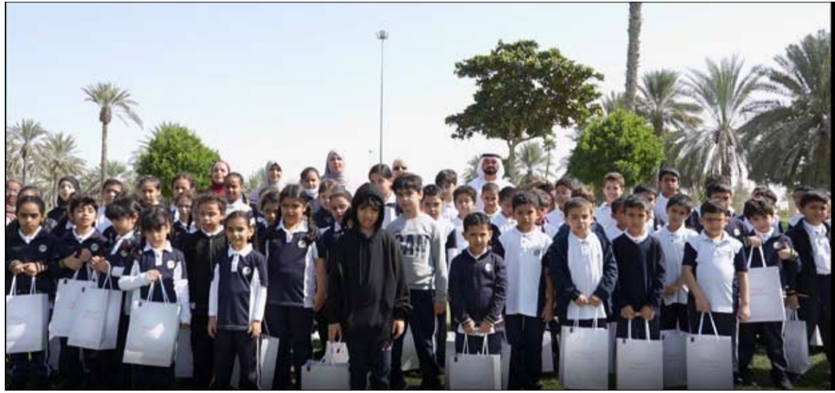
على طلاب وطالبات المدارس المشاركة وذلك لنشر أجواء مملوءة بالسعادة والإيجابية.