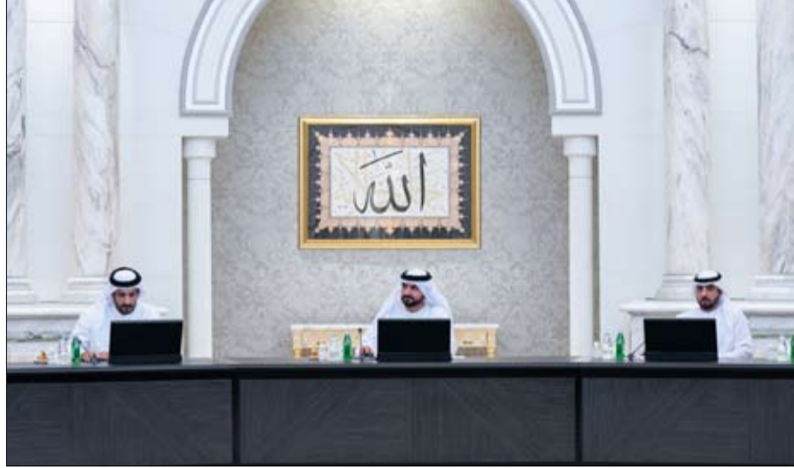
المبادرات والبرامج التي ينظمها المجلس جهود هيئة مطار الشارقة الدولي في التطوير المستمر لكافة الخدمات وأنظمة المطار والعمل على توفير أفضل تجربة للمسافرين.

الإحصائيات ارتفاع الأرقام المحققة بالمقارنة مع العام 2019م. كما تضمن التقرير خطط التطوير والتوسع التي يعمل عليها المطار، وتشمل تطوير مختلف المرافق وتحديثها بأفضل الموصفات والمعايير، والعمل على إضافة العديد من المساحات والخدمات والمرافق التي تواكب النمو الكبير في حركة المسافرين والطائرات التي يشهدها المطار. وشمل التقرير العديد من الإنجازات التي حققتها مطار الشارقة الدولي كالجوائز الدولية وبيروامج الاعتماد من مختلف المؤسسات المختصة، بالإضافة إلى