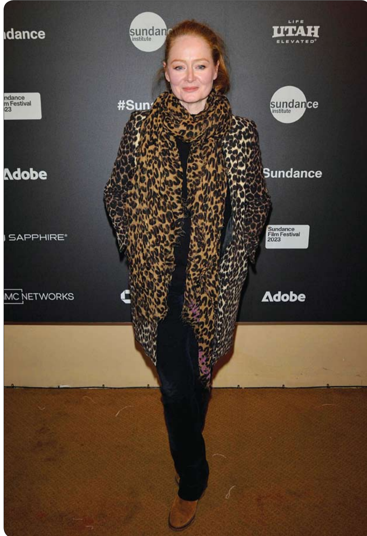
ميراندا أوتو لدى حضورها العرض الأول لفيلم «تحدث معي» في مهرجان صندانس السينمائي 2023 في بارك سيتي.

وأضاف: "عندما لم تجب ليلي على اتصالات والدتها لمدة يومين، اتصلت بالجامعة في لندن وقيل إنها لم تذهب إلى الجامعة، وطلبت من صديقاتها المساعدة واللواتي أخبرن عن وفاتها".