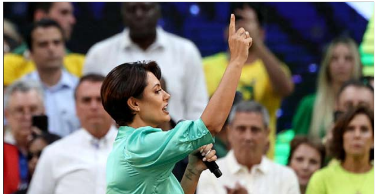
زوجة بولسونارو تخوض معركة كسب الانجليين

بولسونارو يغوي الإنجليين ولنهم نجاح بولسونارو عام 2018، يجب أن ندرك أولاً أن البرازيل كانت تمر بفترة معقدة