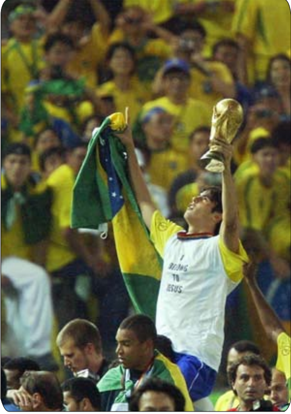
اللاعب منتخب البرازيل عن الحالة التي كان عليها في نهائي موندiales 1998.

وكان المنتخب الآخر الذي حقق العلامة الكاملة في الدور الأول هو المنتخب الإسباني، الذي وصل بعد ذلك لدور الثمانية لكن حظه العاشر أوقفه في مواجهة المنتخب الكوري المنتشي بعد الإطاحة بالمنتخب الإيطالي من دور ال16 يطيح أصحاب الأرض بالمنتخب الإسباني أيضا. وبهذا، ضم المربع الذهبي بطليين سابقين للموندiales هما المنتخب البرازيلي ونظيره الألماني ومنتخبى تركيا وكوريا الجنوبية، اللذين تنافسا على لقب الحصان الأسود لهذه النسخة بعدما أنهى المنتخب التركي مغامرة نظيره السنغالي في دور الثمانية. وفي نصف النهائي، فازت البرازيل على تركيا 0-1 وألمانيا على كوريا الجنوبية بنفس النتيجة ليجمع النهائي بين فريقين جمعا فيما بينهما 7 ألقاب بطولات كأس العالم، التي أقيمت قبل هذه النسخة. وشهدت المباراة النهائية مواجهة مثيرة بين ثلاثي الرءاء (رونالدو وريشالدو ورونالدينيو) في هجوم المنتخب البرازيلي وحارس المرمى الألماني الشهير أوليفر كان، الذي كان من أبرز نجوم هذه النسخة بل إنه أحرز جائزة الكرة الذهبية لأفضل لاعب بهذه النسخة من الموندiales. وفاز رونالدو (الظاهرة) بجائزة الحذاء الذهبي لهداف البطولة برصيد 8 أهداف منها هدفين في المباراة النهائية بمرمى أوليفر كان ليحوز