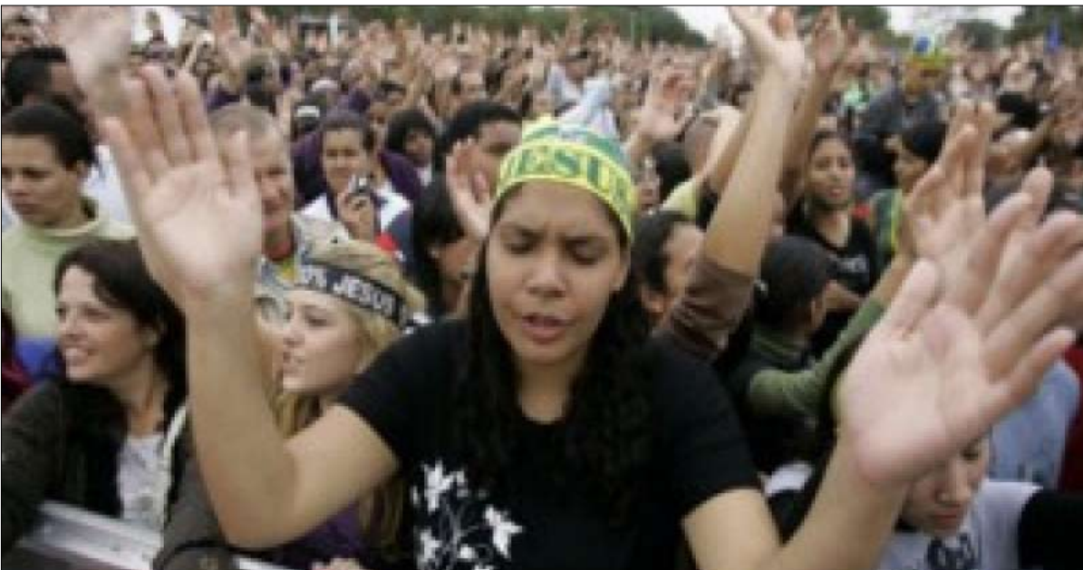
الانجلييون جسم انتخابي حاسم

سيكون من الخطأ افتراض أن «التصويت الإنجيلي» متجانس، لأن الحركة الإنجيلية ليست كتلة واحدة