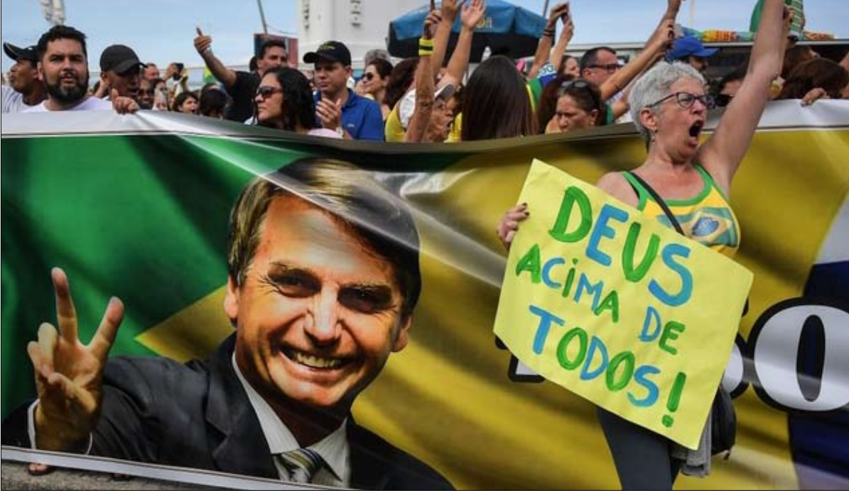
بولسونارو اغوى الانجليين

الناخبين الإنجليين الذين ابتعدوا عن حزب العمال خلال ولاية ديلا روسيف؛ وهكذا، شارك مؤخراً في اجتماع مع ممثلين مخلصين وإنجليين في ريو دي جانيرو، حيث ذكر الحاضرين بـ "كل ما فعله حزب العمال للإنجليين"، مؤكداً في عدة مناسبات أنه مؤمن.