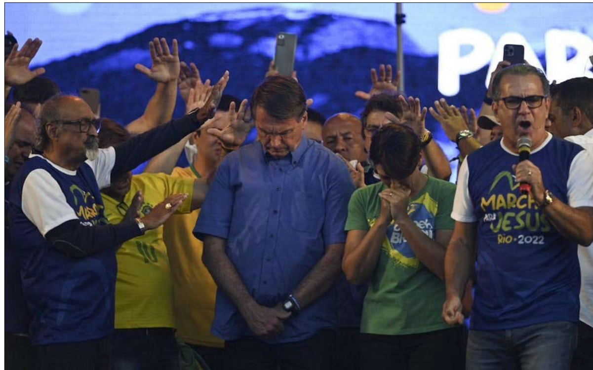
جايير بولسونارو وزوجته ميشيل في صلاة خلال مسيرة ليعس، وهو حدث إنجيلي سنوي، في 13 أغسطس 2022 في ريو دي جانيرو

يدعونهم لدعم بولسونارو، إلى درجة مغادرة الكنيسة أحياناً. ولئن قدم بولسونارو نفسه عام 2018 على أنه مناضف ثانوي - ونقيض للسياسيين المحترفين، ولتوكايس نظام فاسد جوهرياً، فإن هذا الخطاب لم يعد فعالاً عام 2022. وهذا ما يفسر إصرار حملة بولسونارو على تعبئة الحجة الدينية، وذلك بوضع زوجته ميشيل بولسونارو، وهي إنجيلية معمدانية في مقدمة المسرح، إضافة إلى تكوين صورة "سريرة" عن لولا - مما يجعله