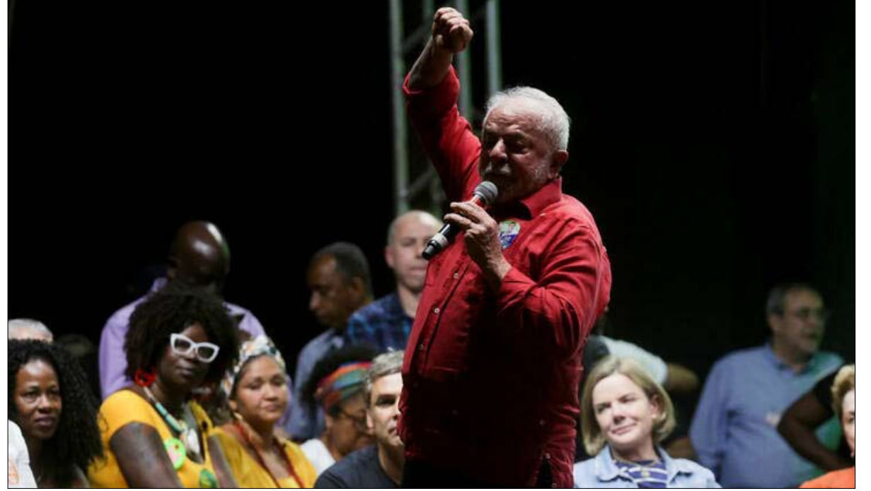
لولا في اجتماع مع الإنجليين لنيل ولائهم

الملاحظة صالحة تماماً للناخبين الإنجليين في البرازيل. في دراسة عن الدين والناخبين في أمريكا اللاتينية أجريت عام 2015، وجد كل من تايلور يواس وإيمي إيريكاسميث، أن "الدين يصنع الفارق في الاختيار الانتخابي وجه الخصوص، في المنطقة، وعلى وجه الخصوص، في البرازيل، لكن المؤلفين أوضحوا أنه من الضروري "تفعيل" هذه الهوية من خلال تعبئة المرشحين - أو الزعماء الدينيين، الذين يقومون هكذا بتسييس اختيار الناخب. كان هذا "التنشيط" للهوية الإنجيلية ناجحاً تماماً من قبل جايير بولسونارو عام 2018؛ في تلك الانتخابات، كان احتمال، يذوق 17 بالمائة، ان يصوت من أتباع الديانات الأخرى والملاحدين.