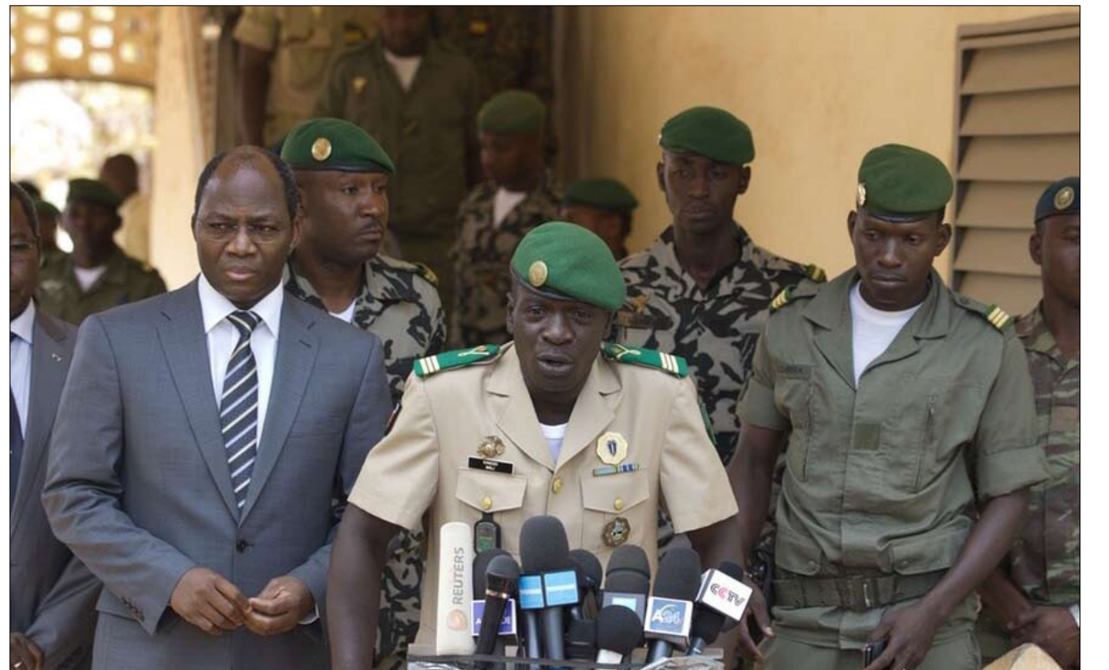
زعيم الانقلاب النقيب أمادو سانوغو (وسط الصورة)