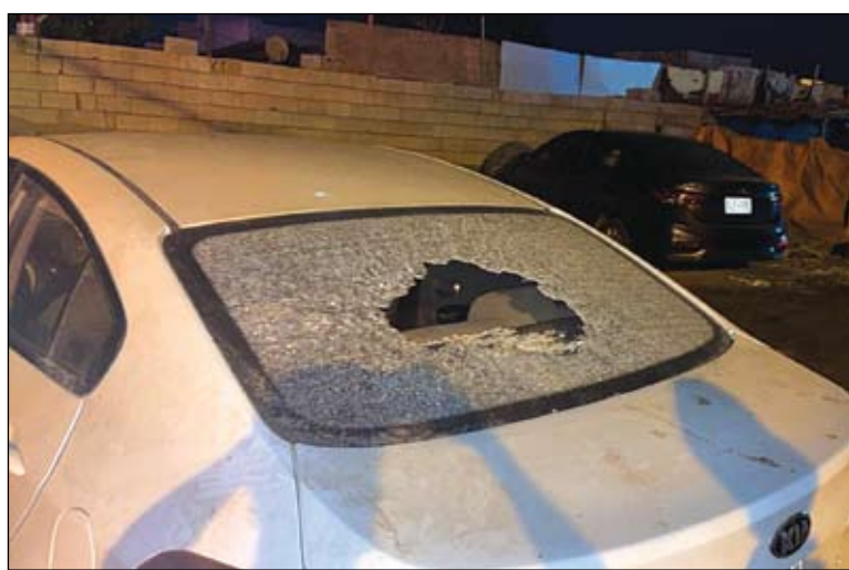
سيارة تضررت بفعل الهجوم الارهابي الحوثى على جازان (واس)

أكد البيان أن أمن الإمارات العربية المتحدة وأمن المملكة العربية السعودية كل لا يتجزأ وأن أي تهديد أو خطر يواجه المملكة تعتبره الدولة تهديدا لمنظومة الأمن والاستقرار فيها. وأشار البيان إلى أن استمرار هذه الهجمات يوضح طبيعة الخطر الذي يواجه المنطقة من الانقلاب الحوثى، واعتبرته دليلا جديدا على سعي هذه الميليشيات إلى تقويض الأمن والاستقرار في المنطقة. وكانت المملكة العربية السعودية قد أعلنت إصابة 5 مدنيين جراء سقوط مقذوف عسكري أطلقته ميليشيا الحوثى الإرهابية المدعومة من إيران من داخل الأراضي اليمنية تجاه إحدى القرى الحدودية بمنطقة جازان. وتقتل وكالة الأنباء السعودية (واس) عن العقيد محمد بن يحيى الغامدي المتحدث الإعلامي لمديرية الدفاع المدني في منطقة جازان قوله: «إن الدفاع المدني تلقى بلاغا عن سقوط مقذوف عسكري أطلقته عناصر الميليشيا الحوثية الإرهابية المدعومة من إيران من داخل الأراضي اليمنية تجاه إحدى القرى الحدودية بمنطقة جازان، وبمباشرة جهات الاختصاص للموقع المتضح سقوط المقذوف العسكري في أحد الشوارع العامه». وأضاف أنه نتج عن سقوط المقذوف إصابة 5 مدنيين، منهم 3 مواطنين و2 من القيمين من الجنسية اليمنية، بإصابات متوسطة وحالات.