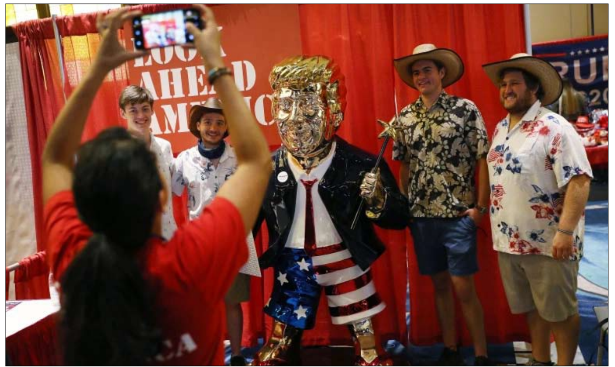
وتحول ترامب الى اسطورة