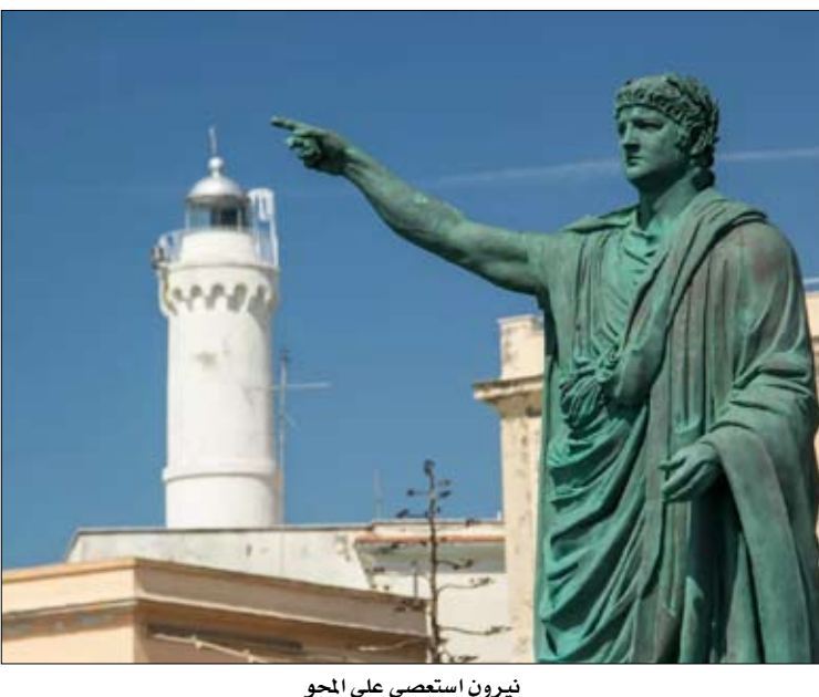
نيرون استعصى على المحو

يبعدو رحيل دونالد ترامب إلى مارا لاغو وكأنه نوع من المنفى