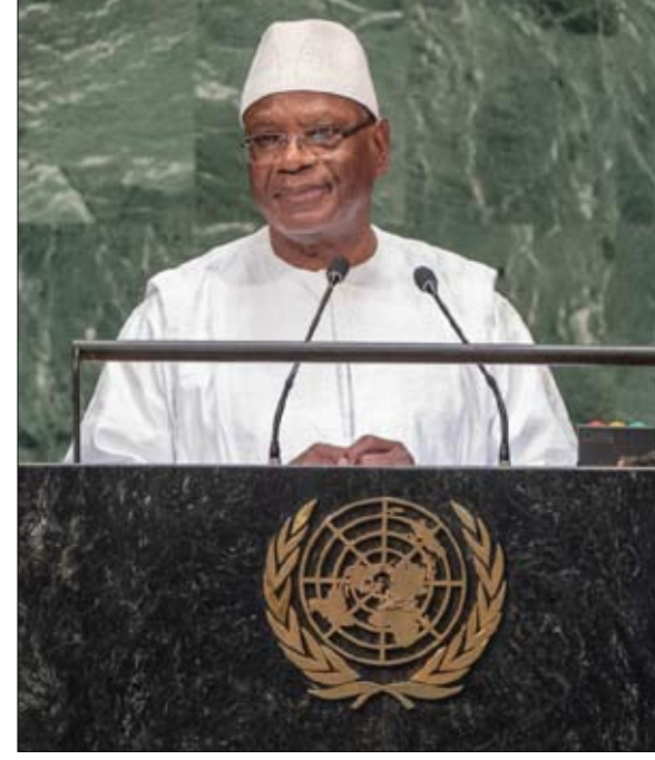
انقلاب ينهي حكم إبراهيم بوبكر كيتا