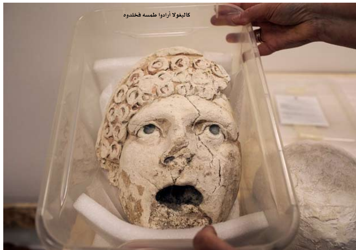
كاليفولا أرادوا طمسه فخلدوه

شهود على الواقع بالإضافة إلى ذلك، من وجهة نظر عملية، كانت للصور والنحوتات الحجوية عن الأبطال العامة عادة غريبة تتمثل في النجاة من مصير العصور القديمة. يؤكد إريك فارنر في كتابه «التشويه والتحول -لعنة الذاكرة واليوترية الإمبراطوري الروماني»، أن عدداً من تماثيل كاليفولا التي تم تخزينها في أماكن أمنة، «محافظة جيداً بشكل مذهن».