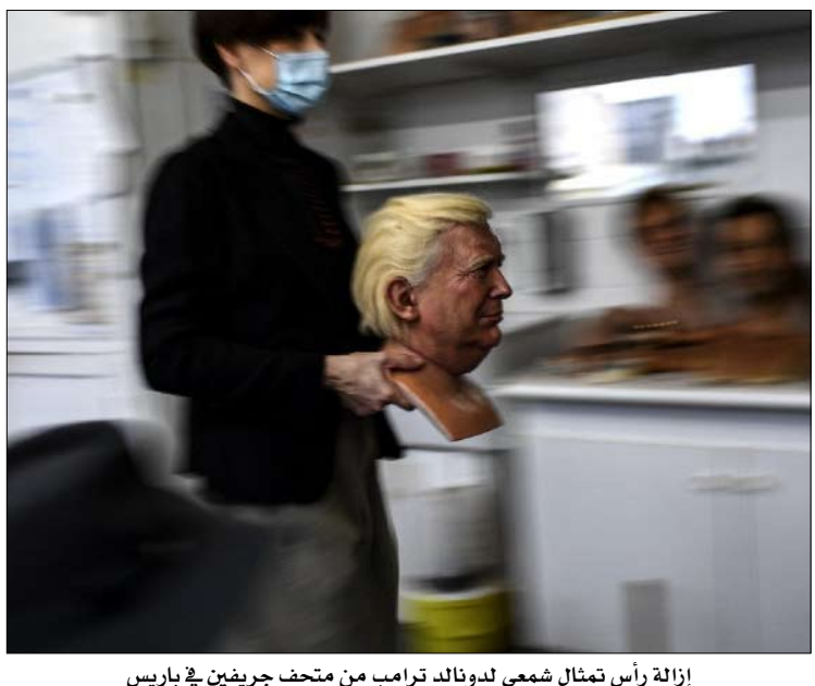
إزالة رأس تمثال شمعي لدونالد ترامب من متحف جريفيين في باريس

هذا درس تعلمته ألمانيا بشكل مؤلم بعد الحرب العالمية الثانية، وقد يجادل البعض بأن الولايات المتحدة لم تتعلمه أبداً في أعقاب الحرب الأهلية. بدلاً من محوها تماماً، نحتاج إلى أن يكتب المؤرخون بصدق عن تلك الحقبة، وأن يكونوا بمثابة شهود، وأن يصفوا بشكل ملموس ما حدث ولماذا. وبدلاً من دهنهم، نحتاج إلى وجهة نظر عن قادتنا، سواء كانوا جيدين أو سيئين، وجهة نظر يمكن أن تكون في مكان ما بين اللعنة وسير القديسين في هذا الفضاء الشاسع الذي نسميه الواقع. أستاذة مساعدة للمعهد الجديد والمسليحية المبكرة وعلم الآثار الرومانية في جامعة ميامي، فلوريديا.