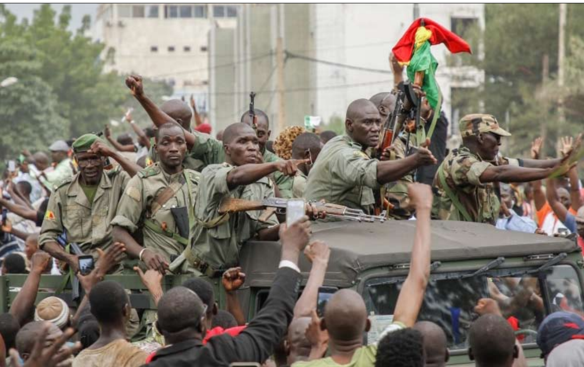
لجيش دور اساسي