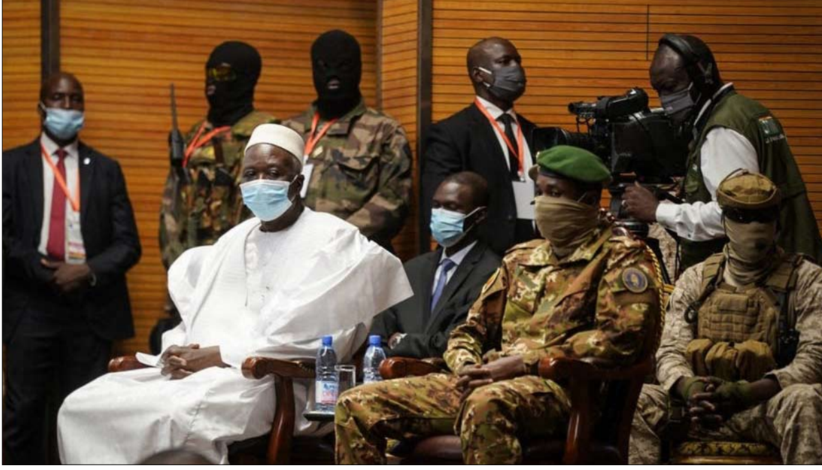
رئيس الانتقال المالي باه نداو

صعوبة في فهم سبب التطبيع مع الذين تحالفوا مع الحركات الجهادية عام 2012، والذين هم أساس هذه الأزمة برمتها (الحركة الوطنية لتحرير أزواد، الآن تنسيقية أزواد). ويزداد عدم الفهم عمقاً منذ أن منع الجيش المالي من دخول كيدال من قبل الجيش الفرنسي عام 2013. هذا الغموض في السياسة الفرنسية، دون التخفيف من مسؤوليات القوة الاستعمارية السابقة، يساهم في تأجيج كل نظريات (المؤامرة أم لا) التي ترى أن فرنسا تقف وراء الحركات الانفصالية و - أو الجهاديين، للحصول على الثروة الضخمة في باطن أرض شمال مالي.