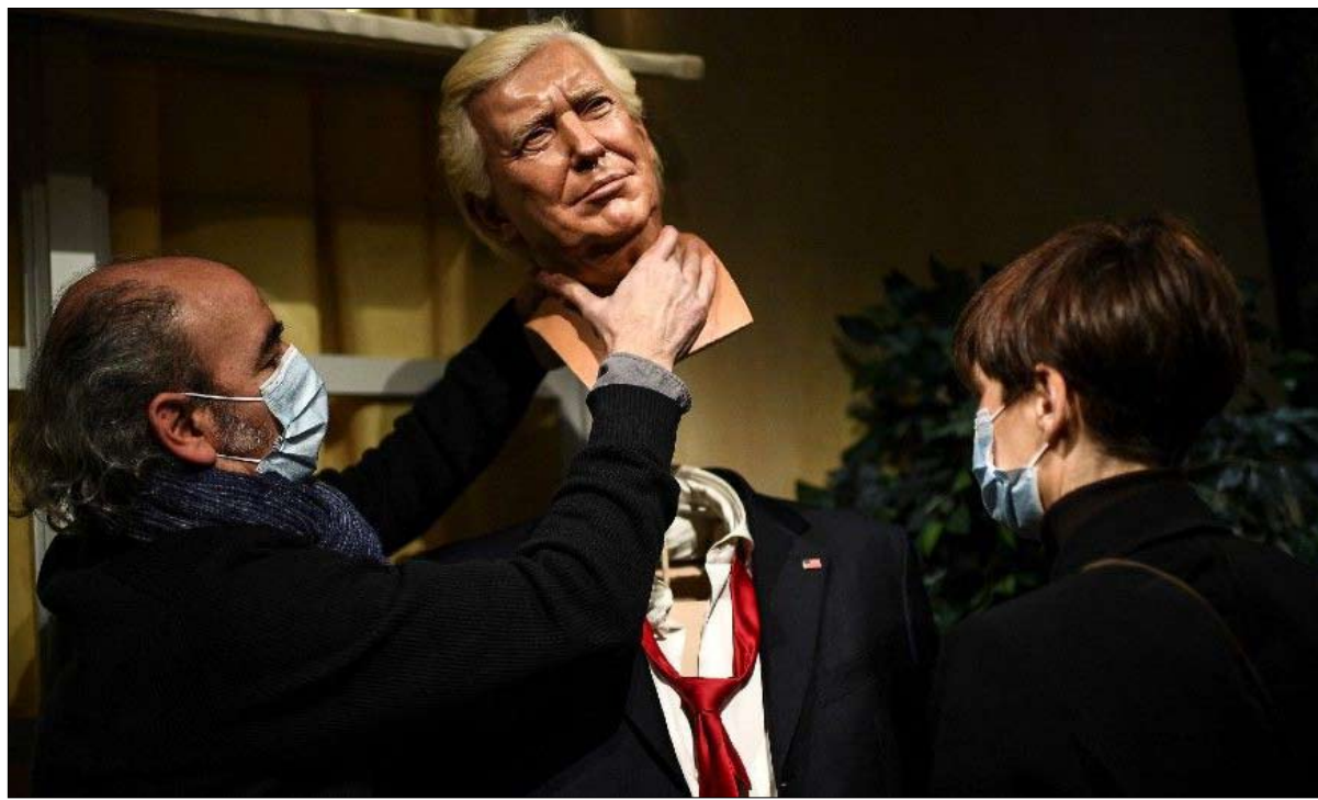
إزالة تمثال الشعم لدونالد ترامب من متحف جريفيين في باريس