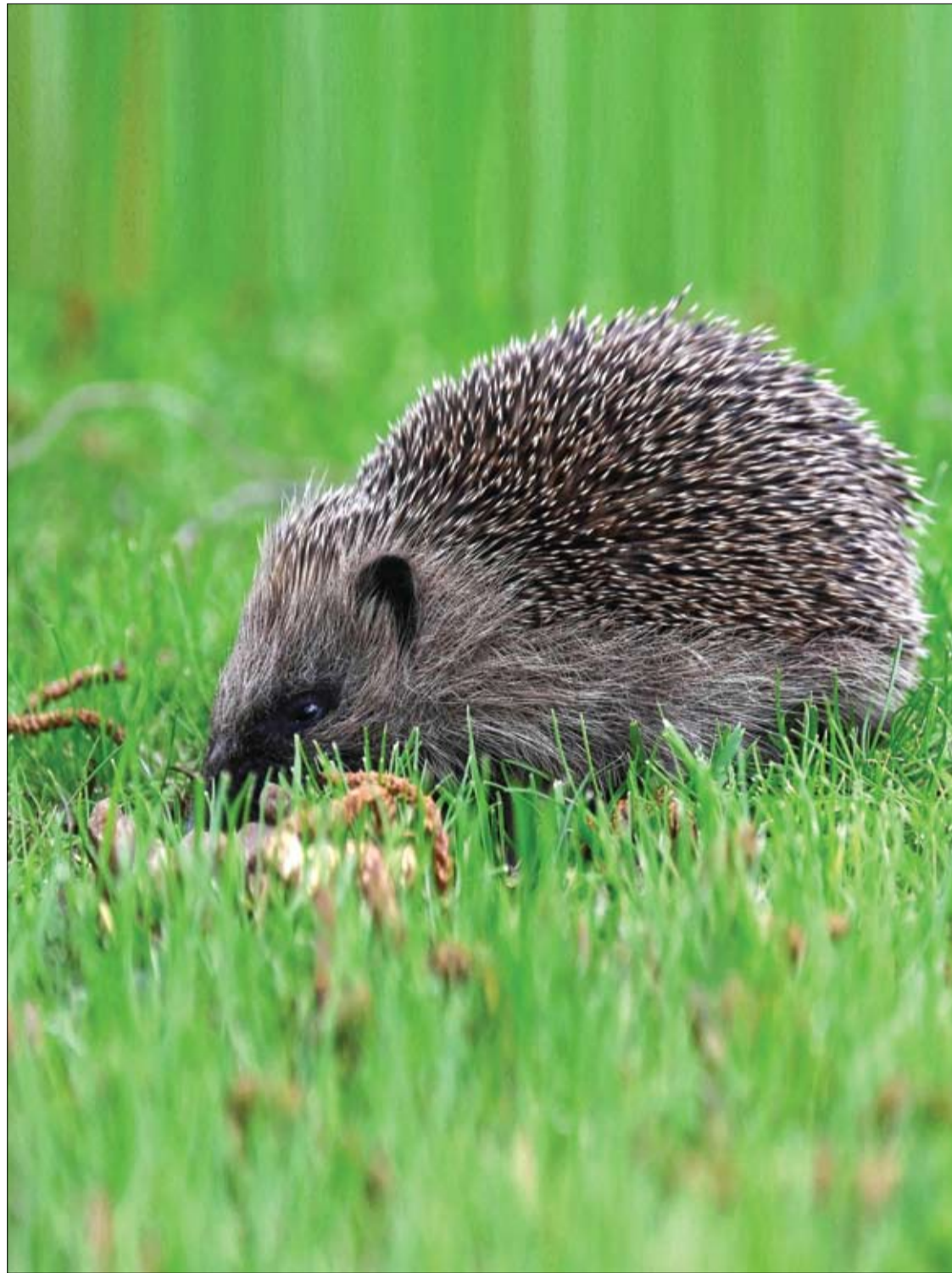
قتنغذ يشق طريقه عبر منطقة عشبية في بلدة بيتون بشمال فرنسا

ويوفر التصوير بالرنين المغناطيسي للقلب رؤية فريدة للقلب، باستخدام التصوير التصيلي الذي يمكنه تحديد التغيرات الطيفية في بنية القلب ووظيفته وحجم الأوعية الدموية وهيكلها وتكوين عضلة القلب وغير ذلك.