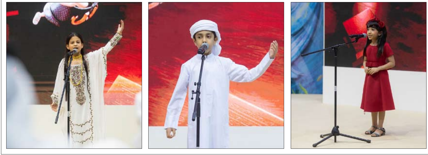
ضمن فعاليات «الشارقة القرائي للطفل»